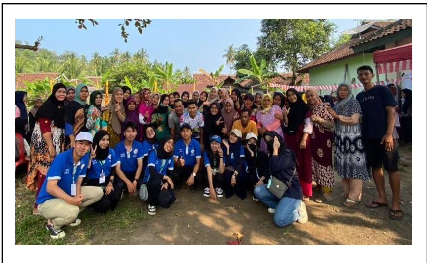
Menjadi panitia dalam pembukaan Bazar UMKM di Desa Kampung Baru