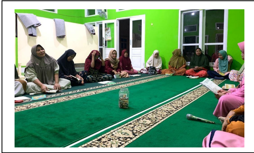
Kegiatan Pengajian Rutin Ibu-ibu Dasa kampung baru