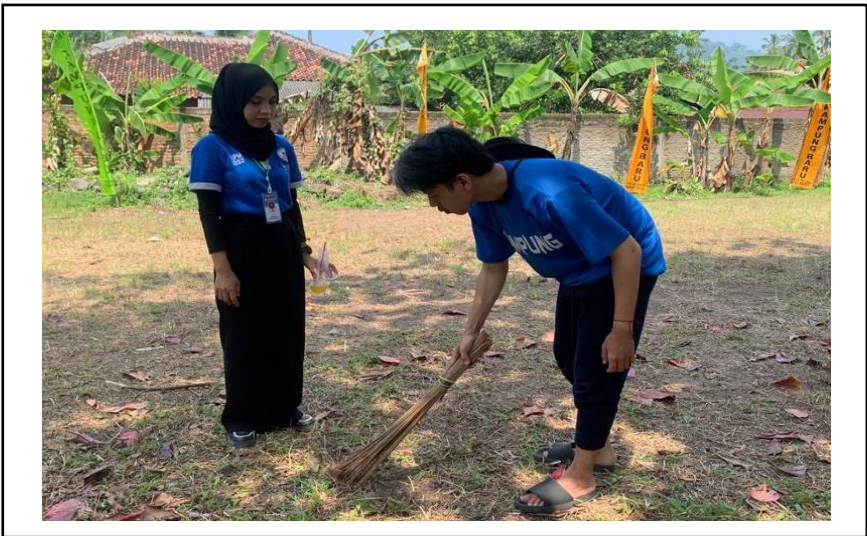
Gotong Royong lokasi perlombaan HUT RI Ke 78