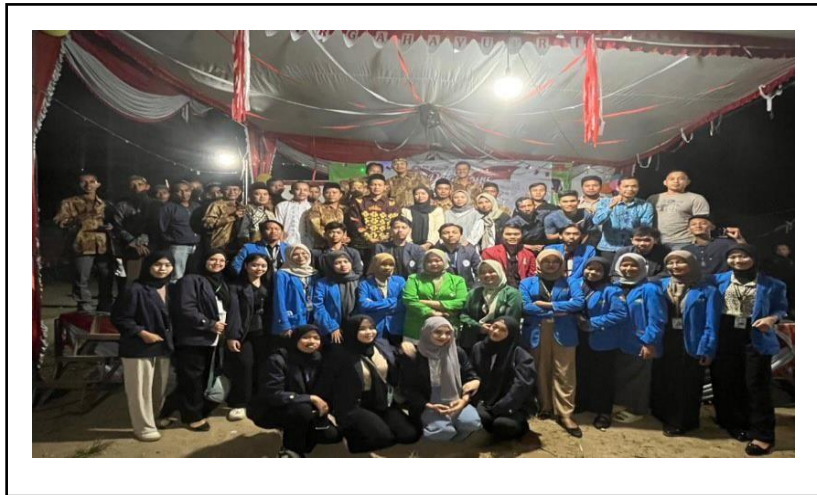
Kegiatan Malam Puncak HUT RI ke 78 dan Pembagian Hadiah