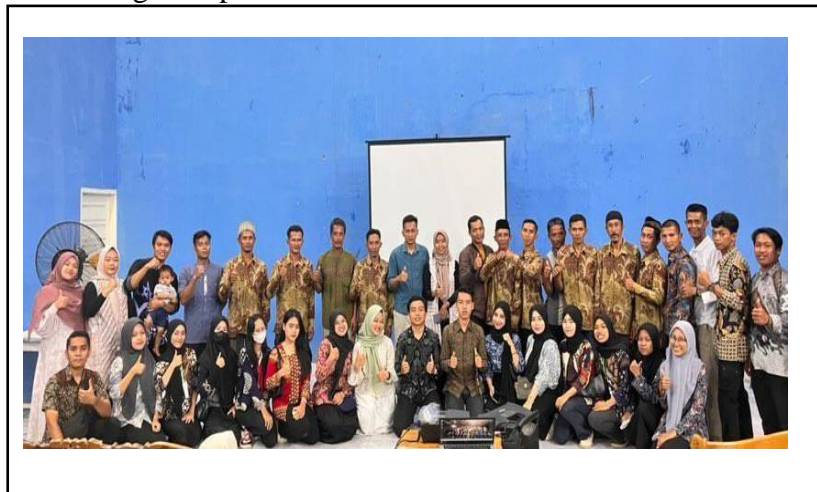
Kegiatan Seminar Leadership bersama Aparatur Desa dan Karang Taruna Desa kampung Baru