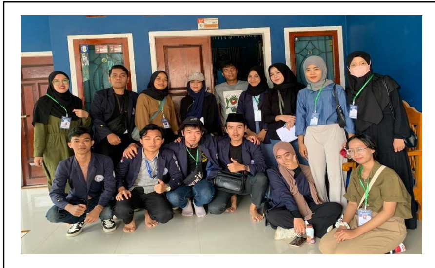
Silaturahmi di kediaman Kepala Dusun Induk