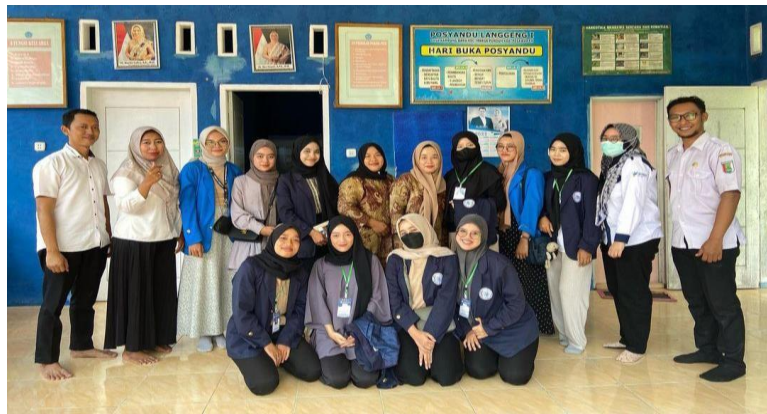
Kegiatan Cek kesehatan Lansia