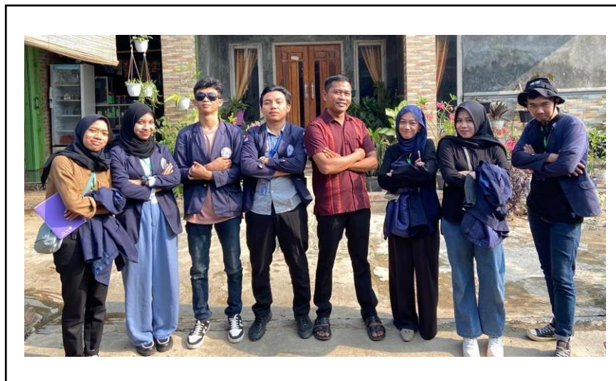
Silaturahmi di kediaman Kepala Dusun Jambatias