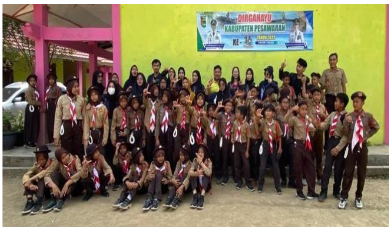
Kunjungan ke Sekolah SDN 04 Marga Punduh