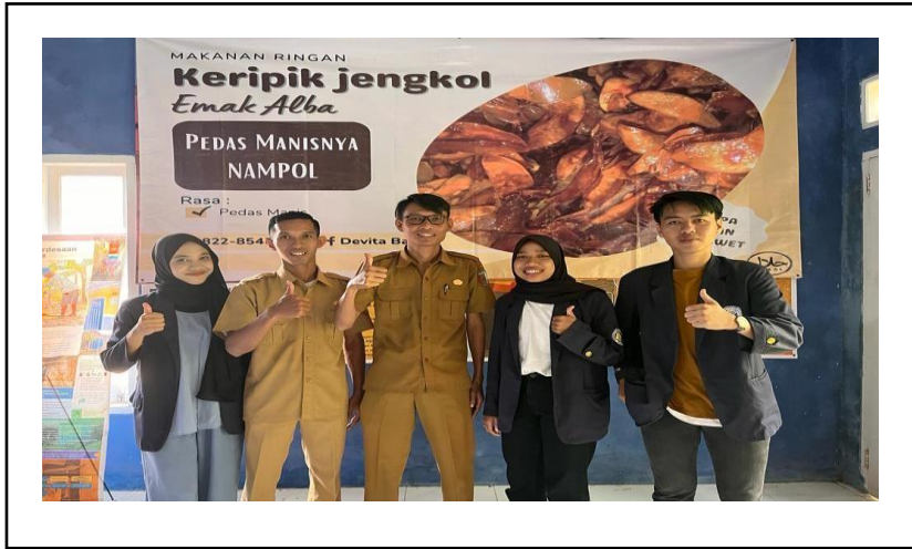
Pemberian Banner UMKM Keripik Jengkol