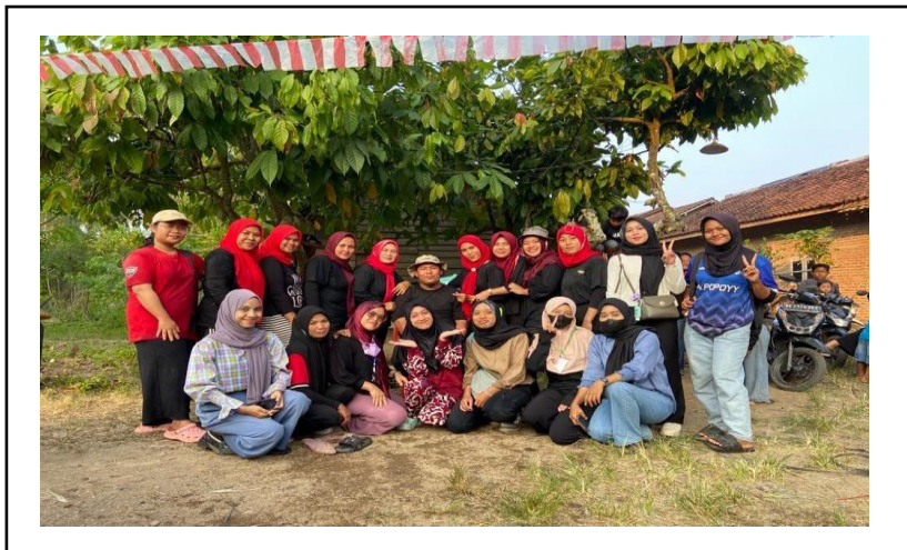
Kegiatan Panitia HUT RI di selirit