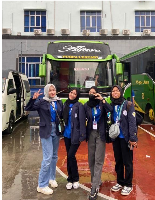
Pemberangkatan Para Peserta PKPM Di Kampus IIB Darmajaya