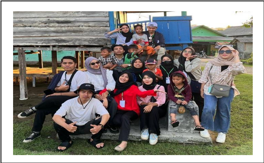
Silaturahmi bersama masyarakat Desa Pemindangan