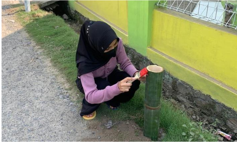
Pengecetan rambu jalan di Desa Kampung Baru