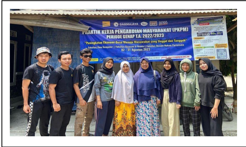
Kunjungan DPL ke Posko Desa Kampung Baru