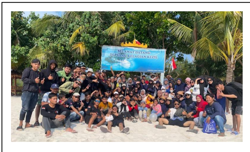
Kegiatan pembubaran Panitia HUT RI ke 78