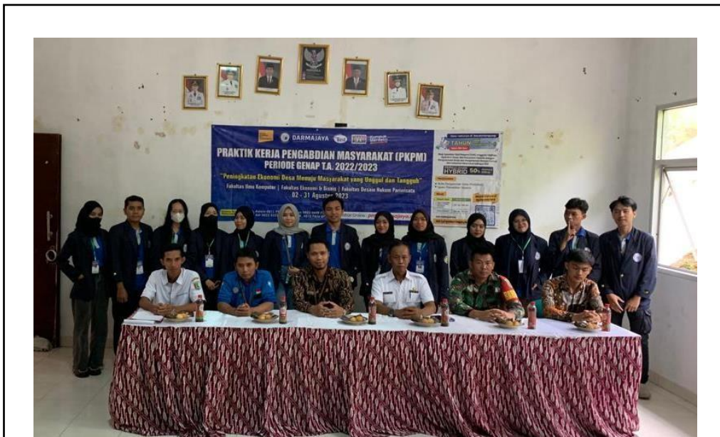
Penyerahan Para Peserta PKPM di Kantor Kecamatan Marga Punduh