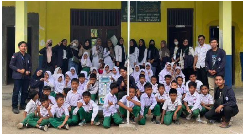
Kegiatan Berkunjung Ke MI Al-Khairiyah