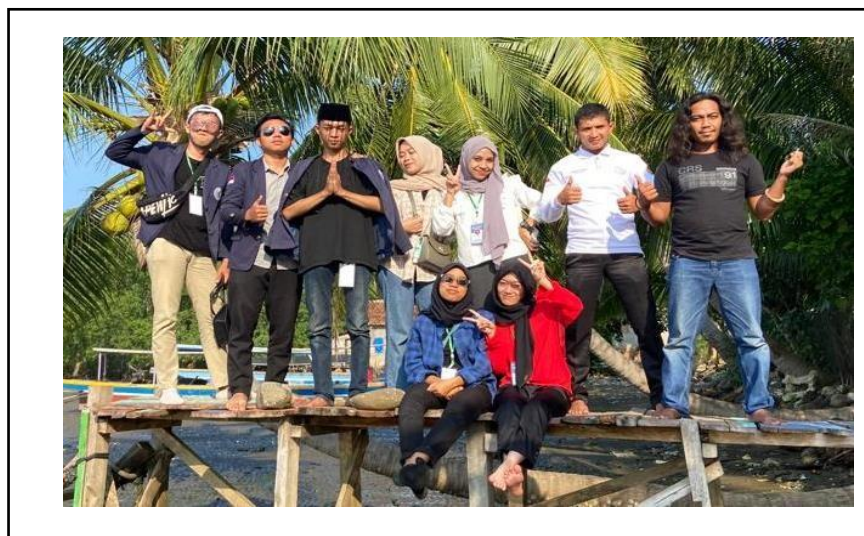
Silaturahmi di kediaman Kepala Dusun Pemindangan