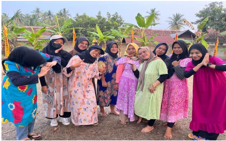
Mengikuti perlombaan HUT RI Ke 78 bersama ibu-ibu Desa Kampung Baru