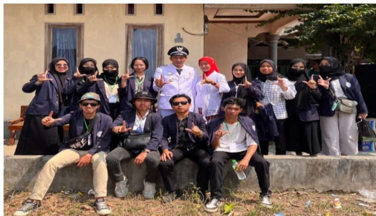
Kegiatan Upacara Bendera HUT RI