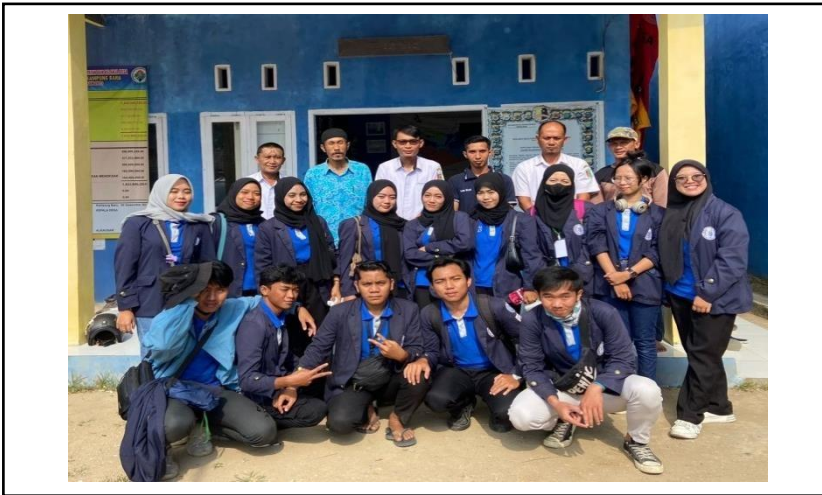
Penarikan Mahasiswa PKPM di Balai Desa Kampung Baru