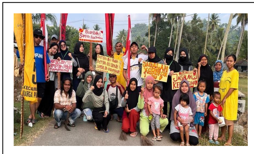
Kegiatan Gotong Royong Membersihkan Pantai Di dusun Pemandangan