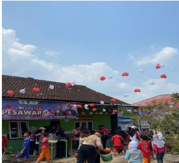
Panitia Lomba HUT RI ke-78 Desa Purworejo