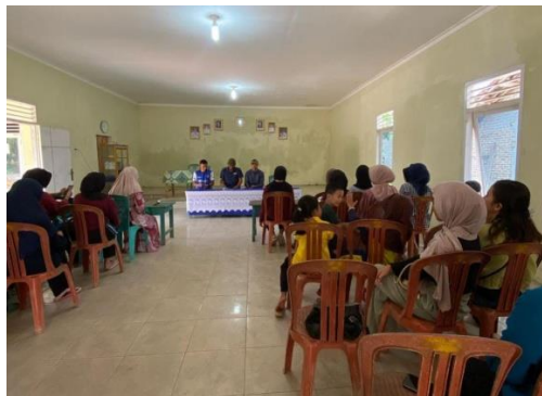
Rapat panitia HUT RI ke-78