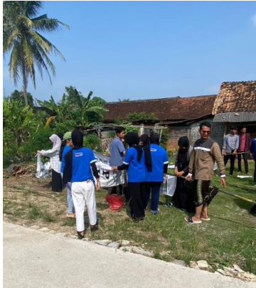
Pemasangan Umbul-umbul di Desa Purworejo