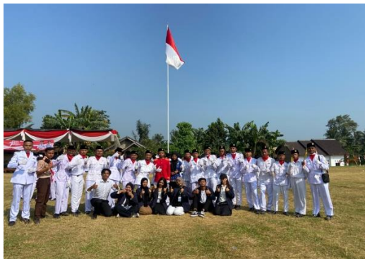
Upacara HUT RI ke-78