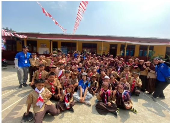
Panitia lomba SDN 1 Negeri Katon