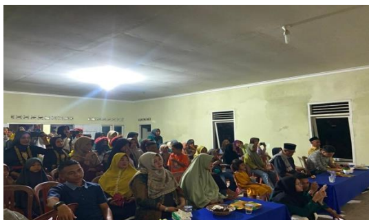
Malam puncak dan Pelepasan KKN UIN RIL