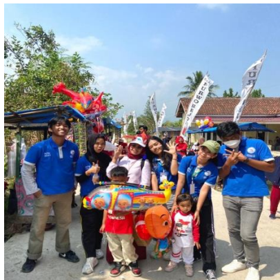
Karnaval Desa Purworejo