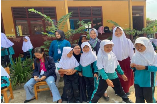
Panitia lomba SDN 1 Negeri Katon