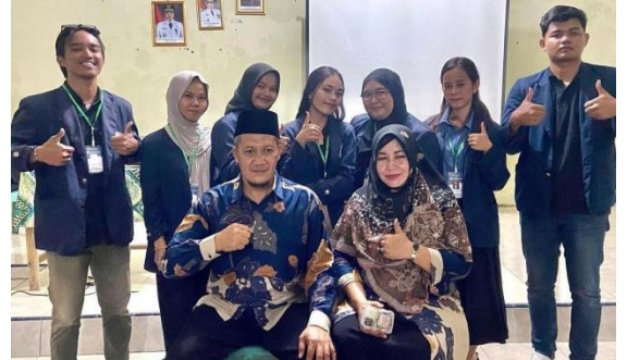
Pelepasan Kepala Desa Lama