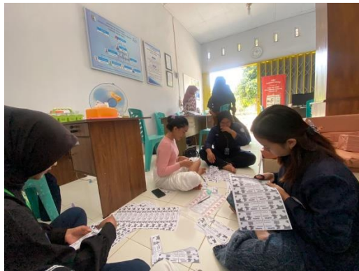
Kupon Persiapan Jalan Sehat dan Karnaval