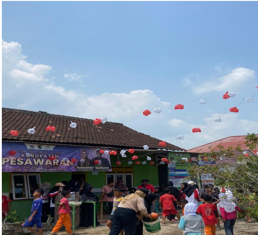
Panitia Lomba HUT RI ke-78 Desa Purworejo