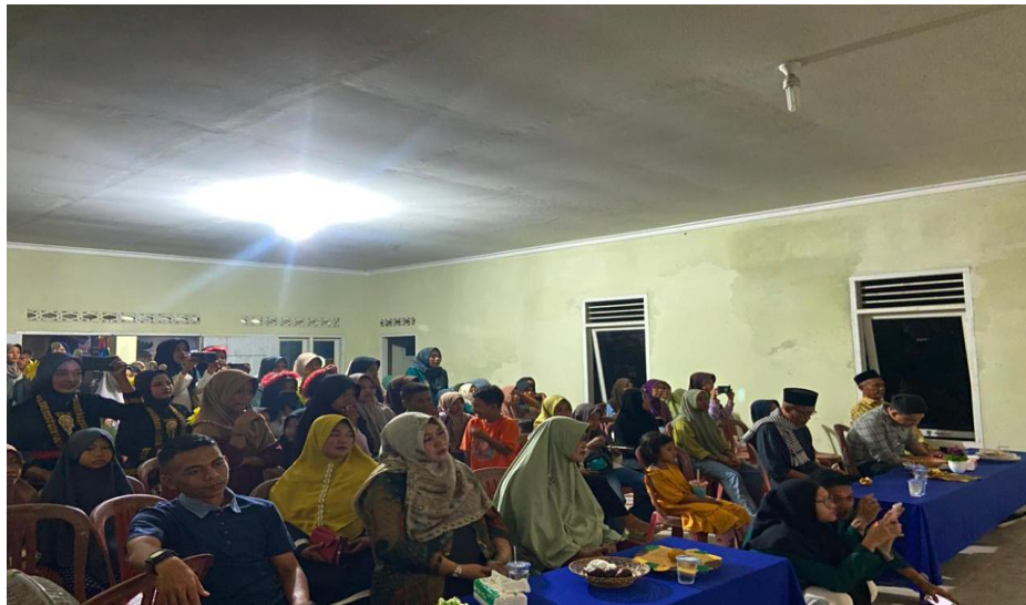
Malam puncak dan Pelepasan KKN UIN RIL