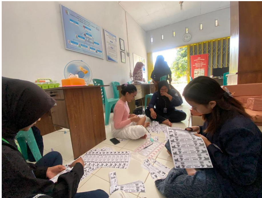
Kupon Persiapan Jalan Sehat dan Karnaval