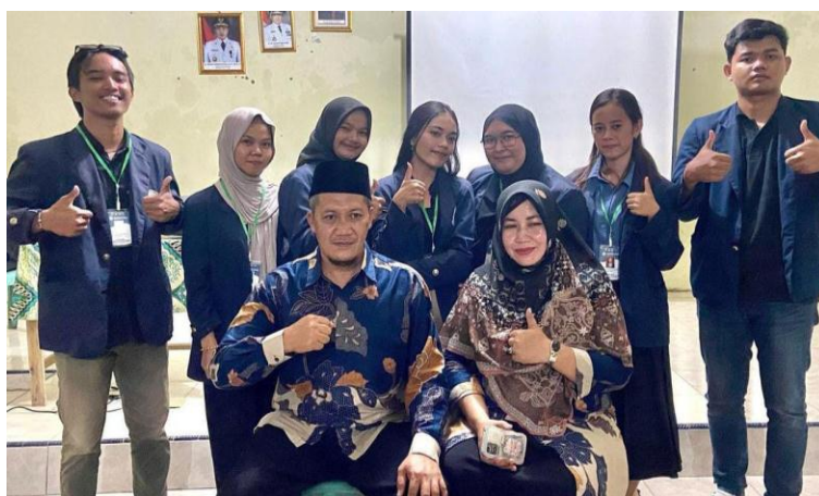
Pelepasan Kepala Desa Lama