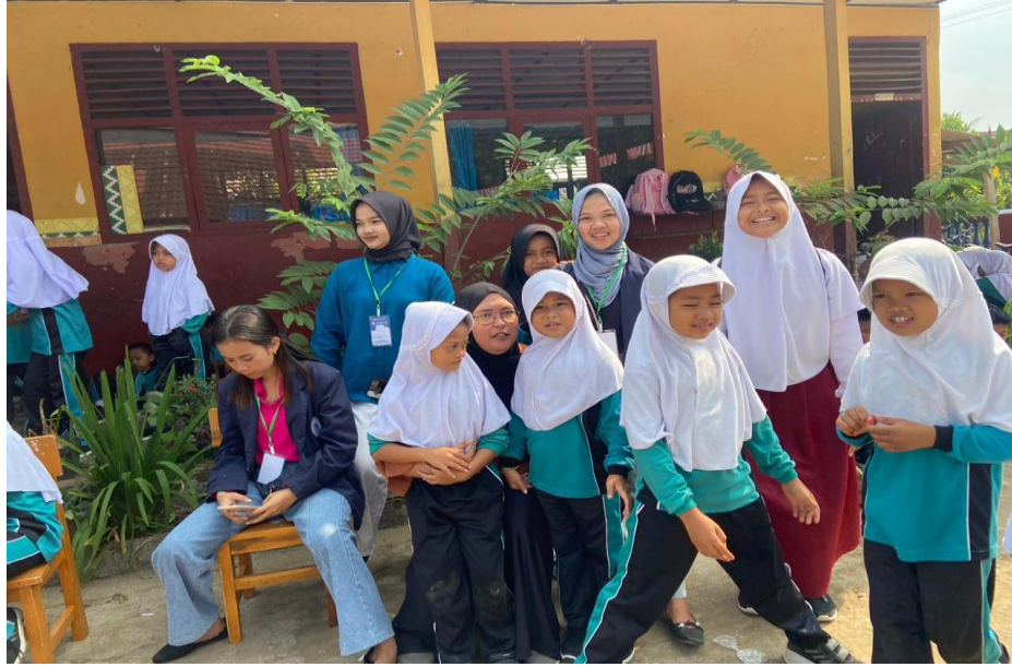
Panitia lomba SDN 1 Negeri Katon