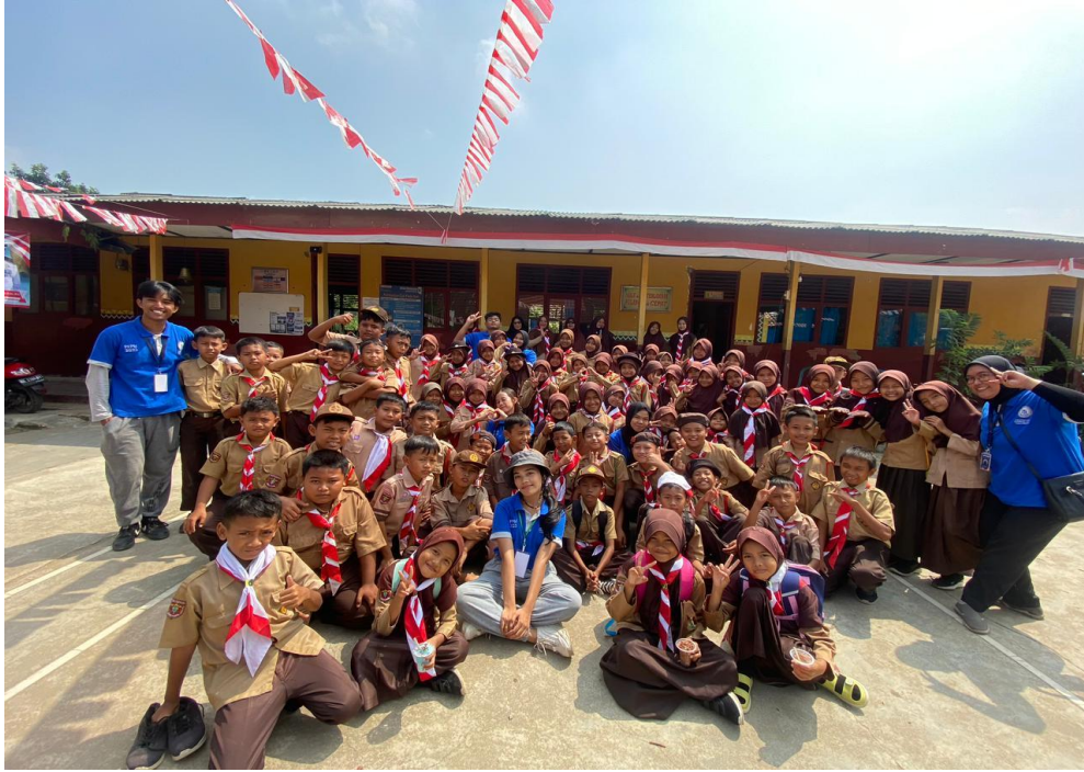
Panitia lomba SDN 1 Negeri Katon