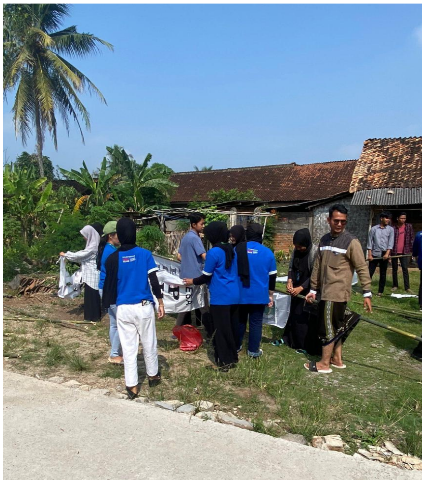
Pemasangan Umbul-umbul di Desa Purworejo