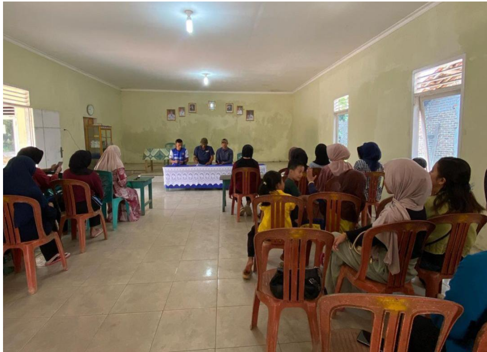
Rapat panitia HUT RI ke-78