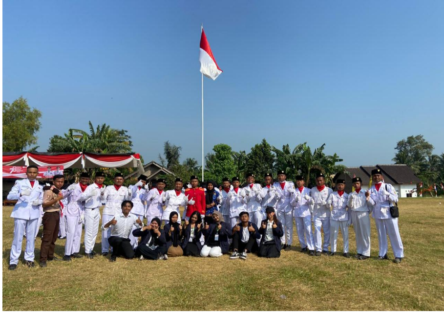
Upacara HUT RI ke-78