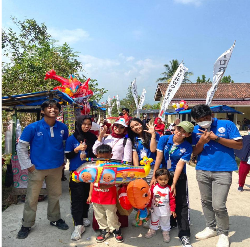
Karnaval Desa Purworejo