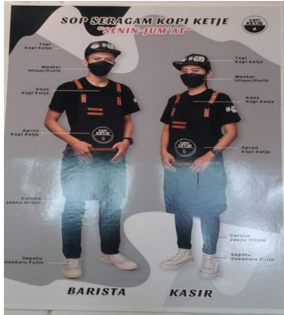
Gambar 3.1 SOP Pakaian Kopi Ketje Rooftop