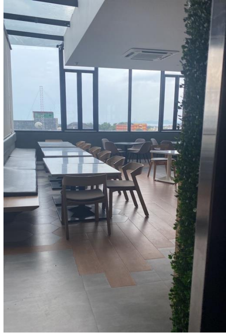
Lokasi Kerja Praktik