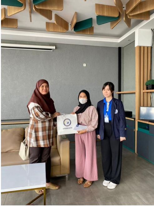
Pengantaran Kerja Praktik