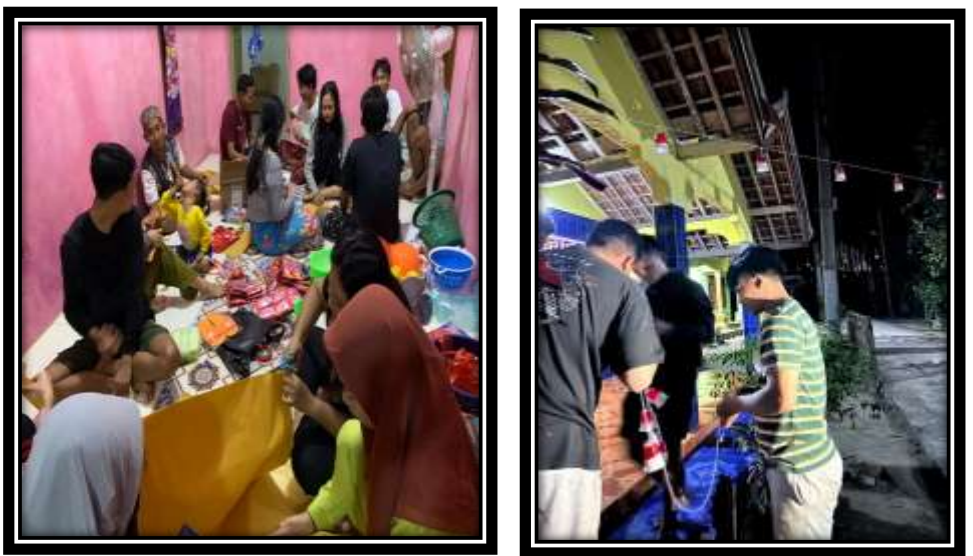
Gambar 10 (Membantu pemuda dalam menghias Desa)

Senam bersama ibu-ibu di Dusun III Jelarangan guna menjaga Kesehatan dan juga mempererat silaturahmi antara mahasiswa dan warga Desa.