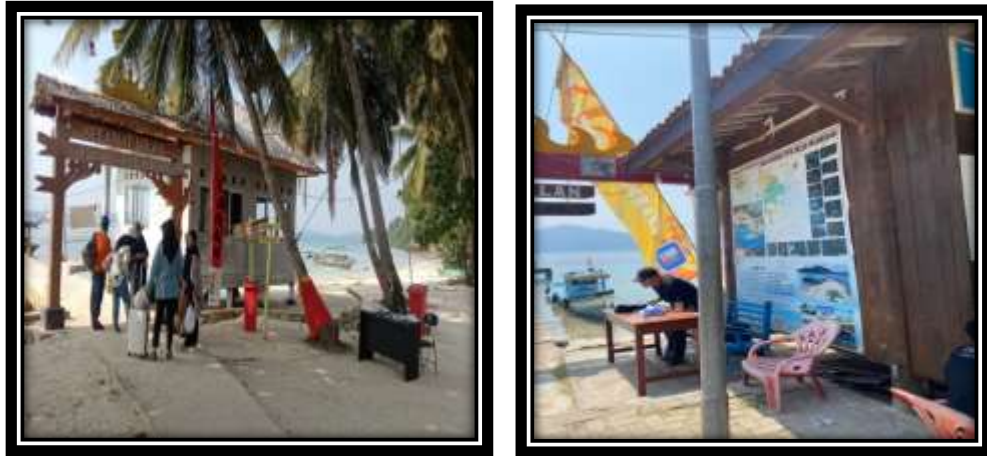
Gambar 13 (Membantu Penjagaan Pos Tiket Wisata)

Sesuai Peraturan Desa No.2 Tahun 2023 mengenai tarif wisatawan masuk ke Pulau Pahawang, kami membantu aparaturnya BUMDes dalam penjagaan pos tiket wisata.