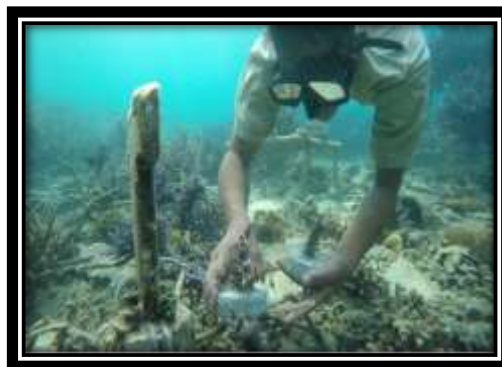
Gambar 14 (Penanaman Terumbu Karang)

Sesuai Peraturan Desa No.2 Tahun 2023 mengenai tarif wisatawan masuk ke Pulau Pahawang, kami membantu aparaturnya BUMDes dalam penjagaan pos tiket wisata.