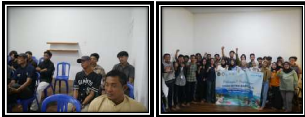
Gambar 12 (Mengikuti Sosialisasi BCA)

Membantu warga dalam memeriahkan Hari Ulang Tahun Republik Indonesia ke 78 di Desa Pulau Pahawang seperti menjadi petugas upacara, mengadakan perlombaan, dan masih banyak yang lainnya.