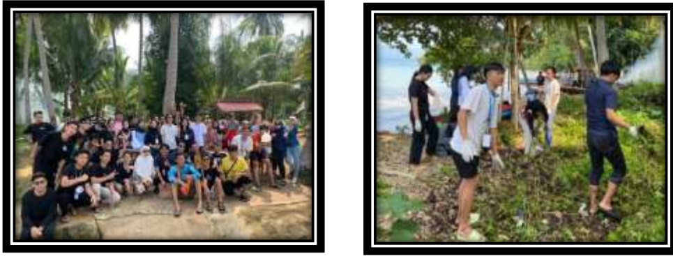
Gambar 4 (Bersih-bersih pantai dan sekitarnya)

Gotong royong membersihkan lingkungan dan pantai sekitar pulau pahawang dilakukan di rutin setiap minggunya bersama warga Desa Pulau Pahawang.