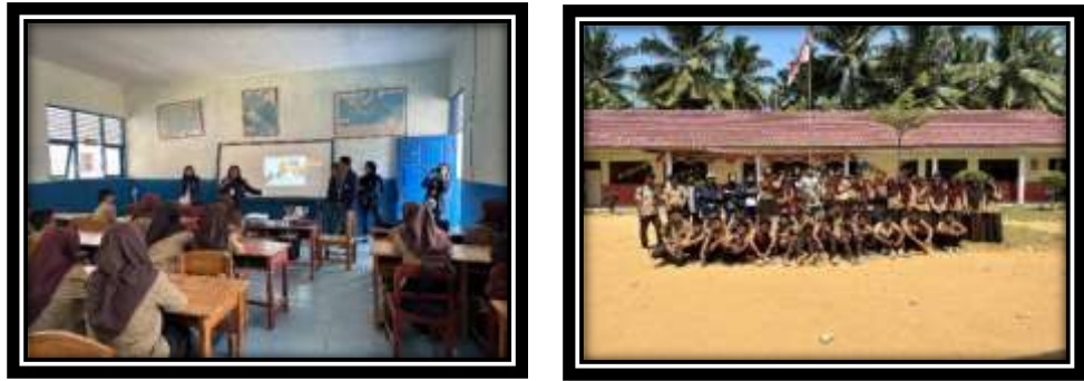
Gambar 8 (Sosialisasi Bahaya Gadget dan Bullying)

Sosialisasi pada siswa sekolah SMPN 8 Satap tentang bahaya gadget, bullying guna mencerdaskan generasi muda.