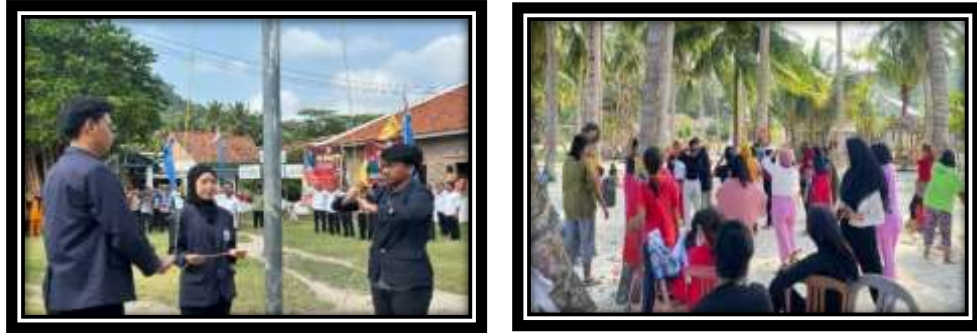
Gambar 11 (memeriahkan HUT RI)

Ikut serta dalam menghias Desa untuk memeriahkan hari kemerdekaan.