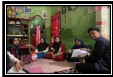
Gambar 7 (Pembinaan Terhadap UMKM Dodol Mangrove)

Pembinaan terhadap UMKM yang ada di Desa untuk memberi solusi dalam hal laporan keuangan, legalitas usaha, digital marketing, dan lainnya guna membantu produktifitas UMKM yang ada.