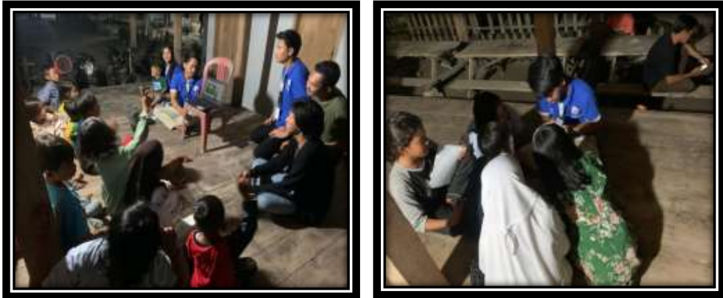
Gambar 2 (Sosialisasi Pentingnya Menabung)

Pada gambar diatas saya memberi penjelasan mengenai pentingnya menabung sejak dini. Pada awal pembukaan saya memberikan pengertian apa yang di maksud dengan menabung dan memberitahu manfaat apa saja jika kita dapat menabung sejak dini.