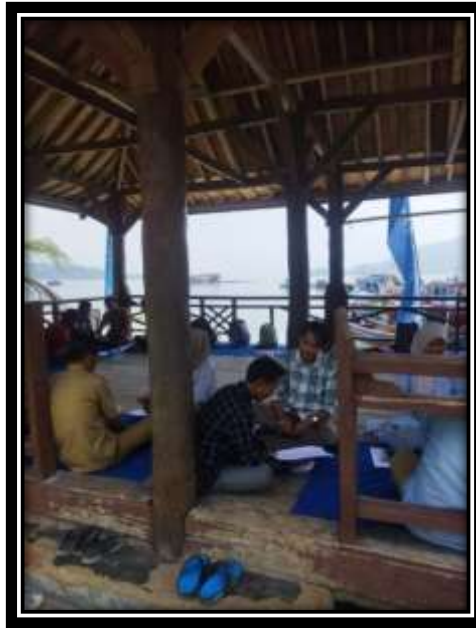
Gambar 6 (Rapat Bersama Mahasiswa ITERA)

Rapat bersama mahasiswa ITERA dan aparatur Desa mengenai kualitas air dan terumbu karang