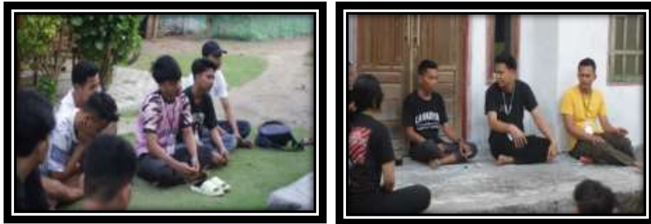
Gambar 5 (Rapat Koordinasi bersama PokDarWis)

Gotong royong membersihkan lingkungan dan pantai sekitar pulau pahawang dilakukan di rutin setiap minggunya bersama warga Desa Pulau Pahawang.