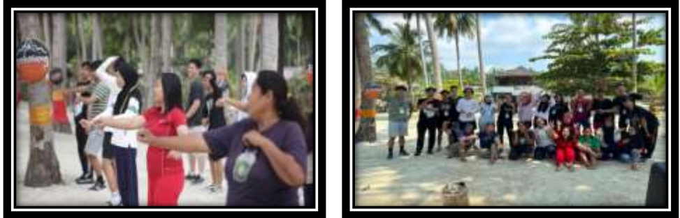
Gambar 9 (Senam Pagi Bersama Warga Desa Pulau Pahawang)

Sosialisasi pada siswa sekolah SMPN 8 Satap tentang bahaya gadget, bullying guna mencerdaskan generasi muda.