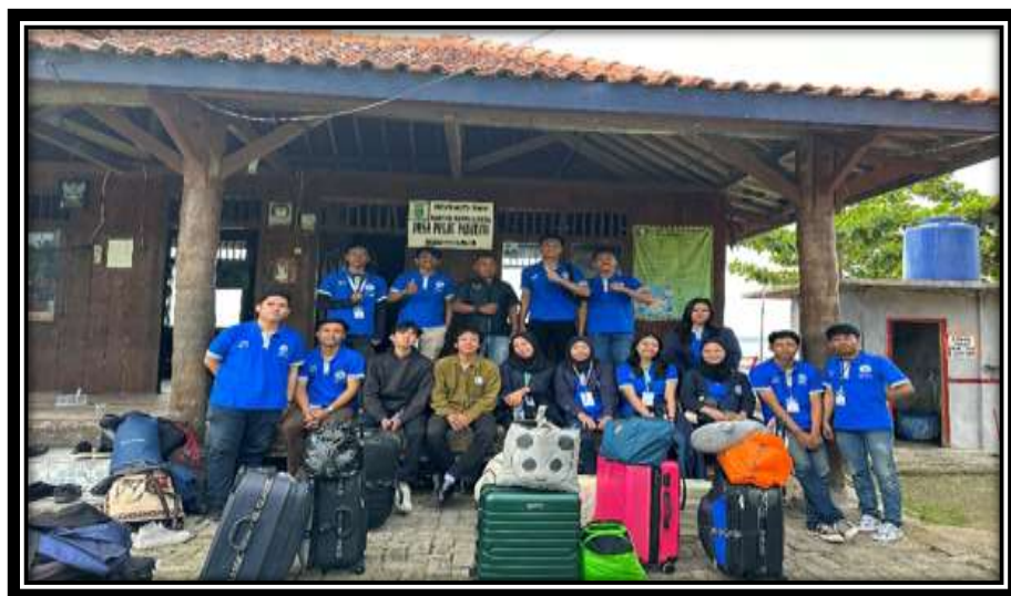
Gambar 3 (Penyambutan di Balai Desa Pulau Pahawang)

Keberangkatan dan penyambutan mahasiswa PKPM di Balai Desa Pulau Pahawang sekaligus kami melakukan perkenalan kepada aparaturnya Desa untuk kami melaksanakan kegiatan pengabdian dari tanggal 2 – 31 Agustus 2023.