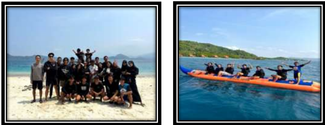
Gambar 20 (Perpisahan bersama pemuda/i Dusun Jelarangan)

Ikut serta dalam perlombaan Mobile Legends di dusun Jelarangan dan Futsal di Lapangan Dusun Pengetahan.