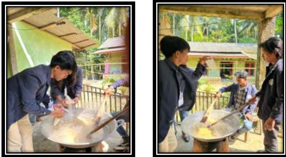
Gambar 16 (Mengikuti proses pembuatan dodol mangrove)

Pada gambar diatas kelompok kami melakukan survei pertama di balai Desa Pulau Pahawang dan menanyakan terkait masalah yang terjadi di Desa tersebut.