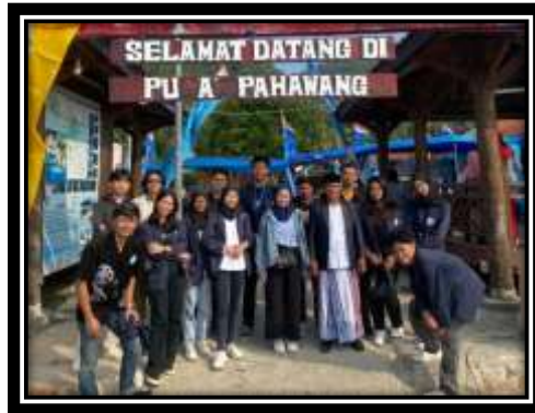
Gambar 15 (Mengunjungi Kepala Desa Terkait Survei Lokasi)

Pada gambar diatas kelompok kami melakukan survei pertama di balai Desa Pulau Pahawang dan menanyakan terkait masalah yang terjadi di Desa tersebut.