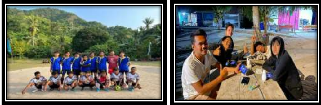
Gambar 19 (Berpartisipasi dalam perlombaan di Desa Pulau Pahawang)

Aplikasi Simonik terdapat juga fitur layanan pengurusan PIRT, halal, BPOM dan branding .