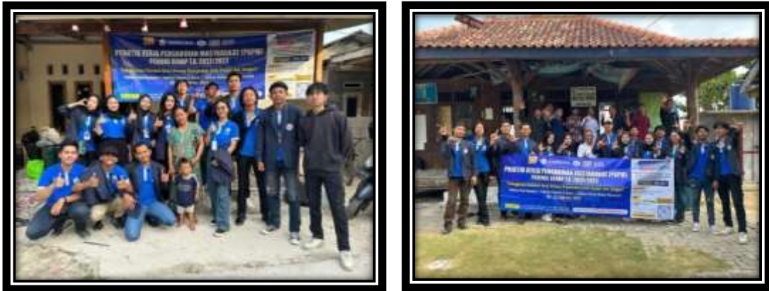
Gambar 21 (Perpisahan bersama ibu pemilik rumah dan Aparatur Desa)

Perpisahan bersama aparatur Desa dan pemilik rumah sekaligus Ibu RT meminta maaf, ucapan terima kasih dan izin pamit meninggalkan Desa Pulau Pahawang.