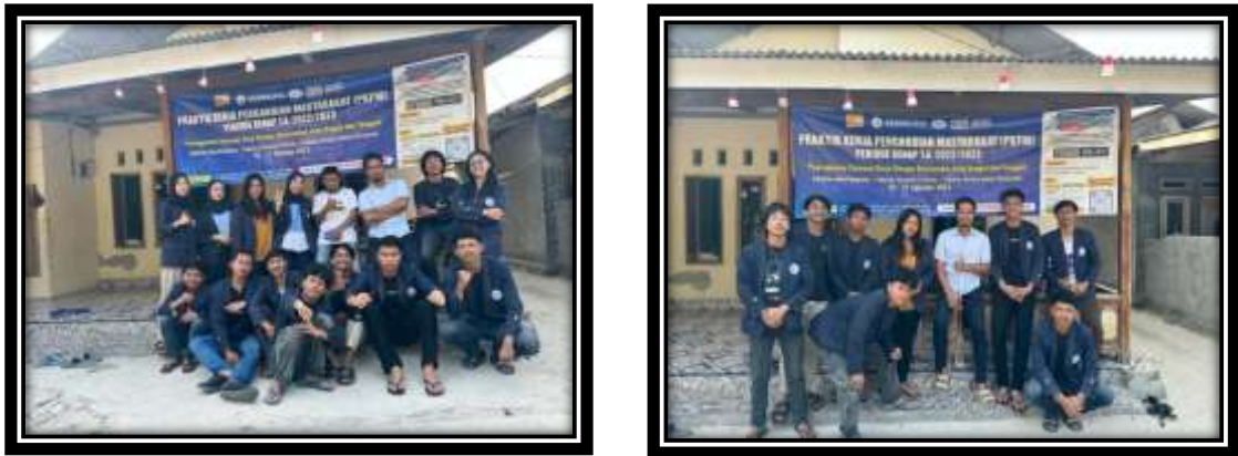
Gambar 17 (Kunjungan DPL ke lokasi PKPM)

Pada gambar diatas, di hari Minggu tanggal 20 Agustus 2023, DPL kelompok 50 bersama DPL kelompok 51 melakukan kunjungan ke lokasi untuk meninjau dan melihat perkembangan para mahasiswa di lokasi.