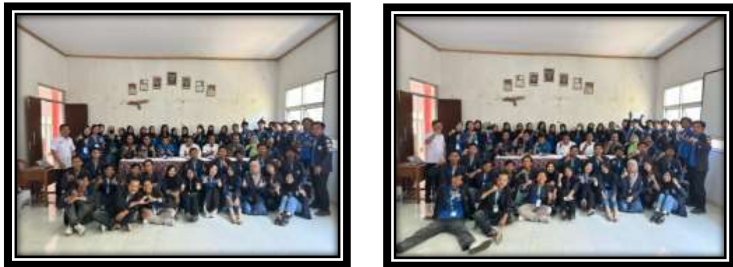
Gambar 22 (Penarikan dan Presentasi hasil kerja)

Perpisahan bersama aparatur Desa dan pemilik rumah sekaligus Ibu RT meminta maaf, ucapan terima kasih dan izin pamit meninggalkan Desa Pulau Pahawang.