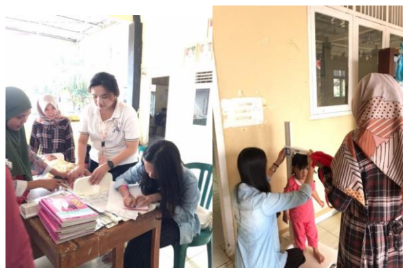
Gambar 7: Kegiatan Posyandu

Posyandu anak berguna untuk memantau pertumbuhan anak di usia 0-5 tahun, dari menimbang berat badan, mengukur tinggi badan, mengukur lingkaran kepala, pemberian vitamin, suntik imunisasi, pemberian dan memberi pemahaman tentang gizi, KB, dan penanggulangan KB.