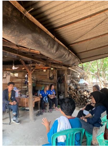
Gambar 1 : Survei UMKM Keripik Manggleng

pembaharuan dan serta pengembangan inovasi yang akan dilaksanakan dan sesuai dengan kebutuhan pihak terkait.