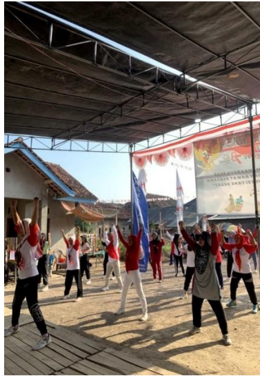
Gambar 6: Senam bersama ibu - ibu

berkembang daya tahan ototnya, kekuatannya, powernya, kelenturannya, koordinasi, kelincahan, serta keseimbangan.