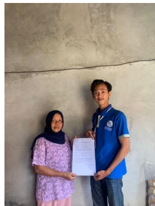
Gambar 2 : Perizinan UMKM

Perizinan ini dilakukan guna silaturahmi dan meminta ijin kepada UMKM bahwa akan menjadi mitra terkait saat pelaksanaan PKPM ini berlangsung di Tanjung Rejo serta menjadi prioritas mitra saat kegiatan.