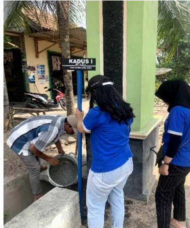
Gambar 11: Gotong Royong dan Pemasangan Plang

Gotong royong ini selain menjaga kebersihan dan keindahan lingkungan juga untuk menjalin silaturahmi antar warga dan juga mahasiswa PKPM. Selain gotong royong ada pula pemasangan plang.