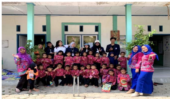
Gambar 8: Kunjungan PAUD Al-Baraqa