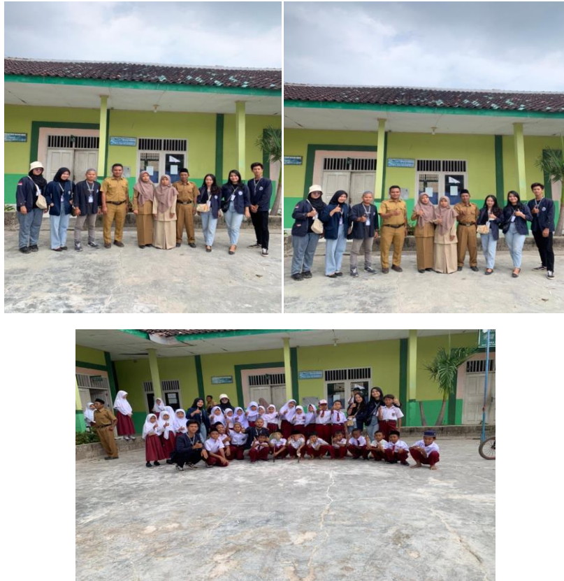
Gambar 9: Kunjungan MI