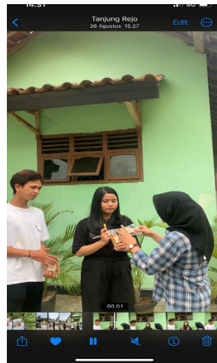
Gambar 3: Pembuatan Vidio Content Marketin

Content marketing teknik pemasaran untuk meningkatkan dan distribusikan konten yang relevan dan berharga untuk menarik, memperoleh dan melibatkan target audience yang jelas untuk di pahami dengan tujuan mendorong tindakan pelanggan yang menguntungkan. Media sosial sebagai salah satu alat dalam pengelolaan content marketing juga memiliki tujuan untuk mendekatkan bahkan hingga melibatkan pelanggan untuk mengikuti brand atau sebuah perusahaan. Hal ini disebut dengan brand engagement. Brand engagement menjadi hal yang penting saat ini, terlebih dengan adanya pemasaran yang dilakukan secara online oleh berbagai pemasar, brand, maupun perusahaan. Adapun pada UMKM ini yang telah dibuatkan suatu vidio content marketing untuk meningkatkan penjualan produk.