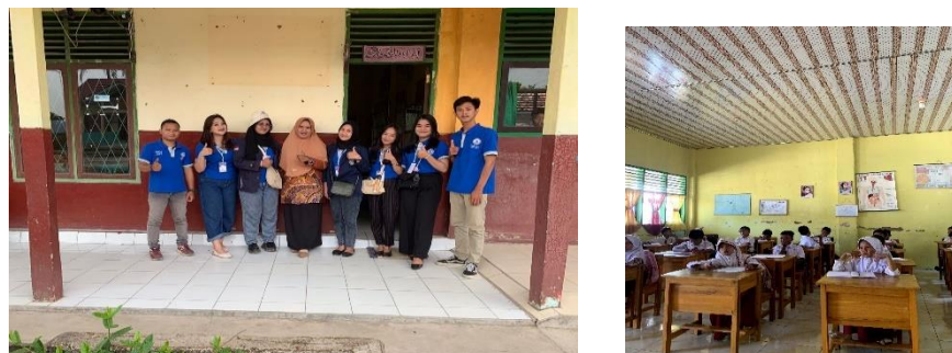
Gambar 10: Kunjungan SD N 8 Way Khilau

Pada kegiatan ini selain menjalankan program kerja tentang pendidikan juga sebagai bentuk silaturahmi. Dalam kegiatan ini kami memberikan beberapa materi tentang kenakalan remaja, narkoba dan ikut serta dalam memberikan materi pembelajaran.