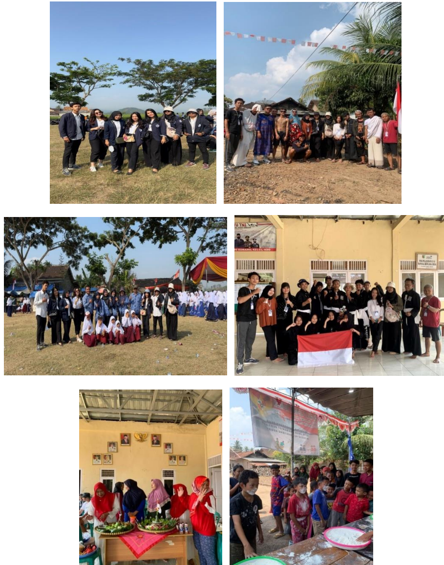
Gambar 5: Upacara HUT RI & Perlombaan dan Pembagian Hadiah Perlombaan HUT RI

semua melakukan upacara bahkan perlombaan pun secara online karna dampak dari Covid-19 ini. Maka dari itu saat ini diadakan kegiatan yang sangat meriah di desa Tanjung Rejo serta penampilan Kuda Jaranan untuk memriahkan HUT RI Ke 78.