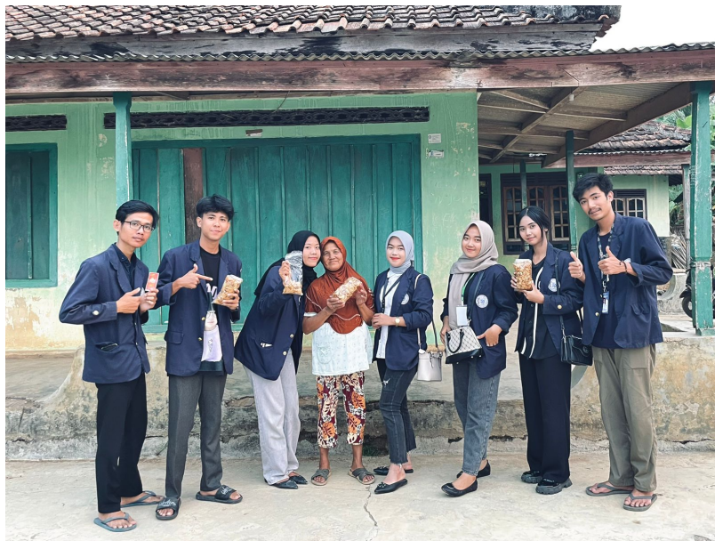
Gambar 2.2 Kunjungan Pertama di Tempat Usaha Mandiri