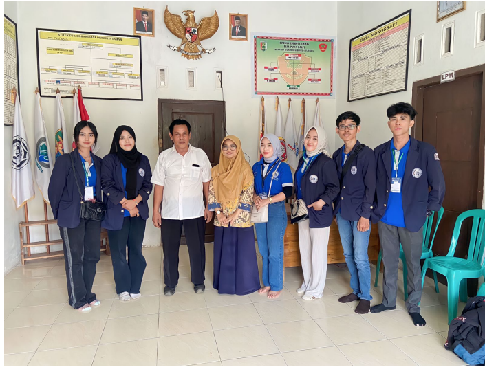
Gambar 2.1 Penyambutan Peserta PKPM

Penyambutan Peserta PKPM di Balai Desa Panca Bakti, Kec Tegineneng, Kabupaten Pesawaran. Acara disambut langsung oleh Kepala Desa Panca Bakti dan dihadiri oleh peserta PKPM beserta Dosen Pembimbingan Lapangan