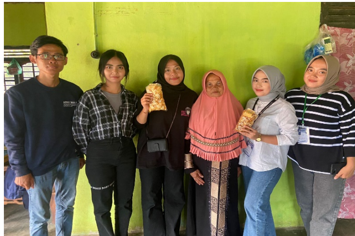
Gambar 2.4 Edukasi Mengenai Pembukuan Keuangan

Setelah melihat proses pembuatan Keripik singkong dari awal hingga akhir, saya melihat dalam bagian proses pembukuan keuangan Usaha mandiri keripik singkong belum menggunakan pembukuan keuangan untuk mengatur keuangan Usaha mandiri sehingga perputaran keuangan kurang efektif, melihat hal itu saya akan mengerjakan program kerja saya yang sesuai dengan konsentrasi bidang saya dan permasalahan yang ada di Usaha Mandiri yaitu tentang pentingnya pembukuan keuangan. Saya memberikan edukasi terhadap pemilik Usaha mandiri agar lebih memahami pentingnya