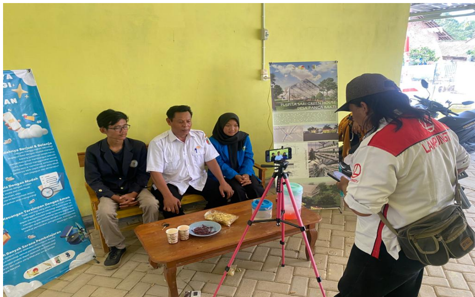
Gambar 2.14 Mengikuti Liputan Lampung Tv