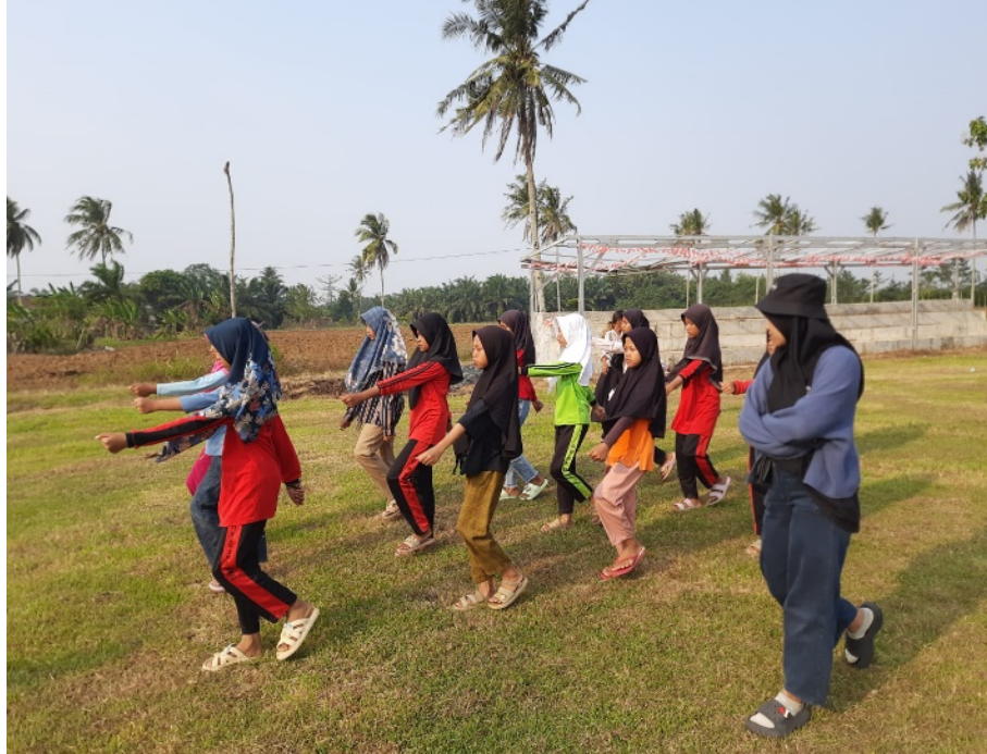
Gambar 2.13 Pelatihan Paskibra SDN 11 Tegineneng