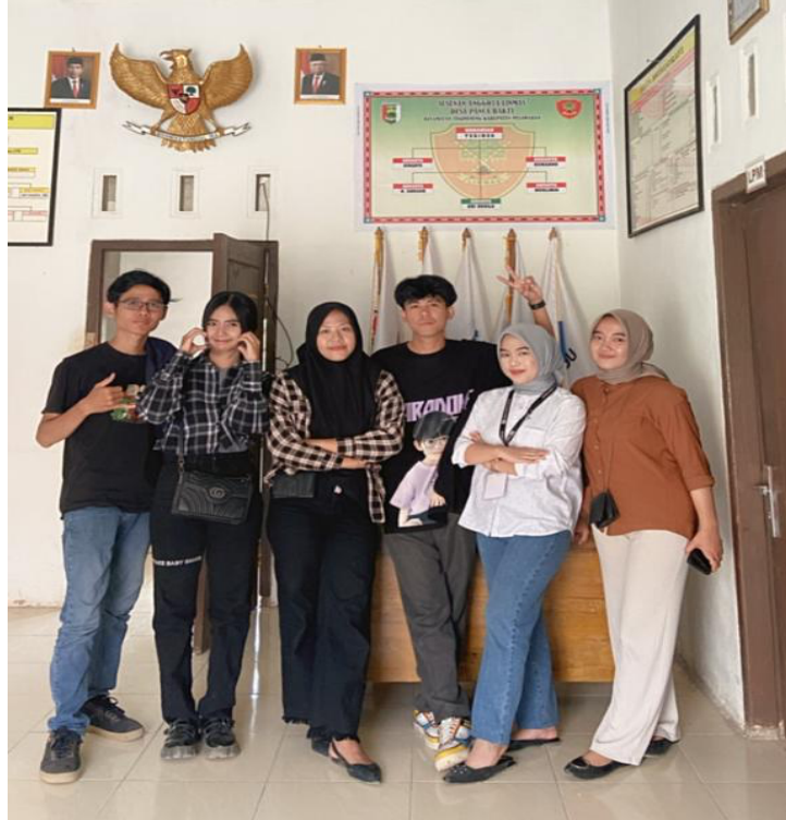
Gambar 2.19 Kunjungan Ke Balai Desa Panca Bakti