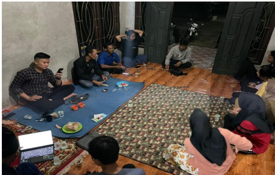
Gambar 2.12 Rapat Kedua Persiapan Hari Kemerdekaan Bersama Karang Taruna dan KKN IAIN Metro