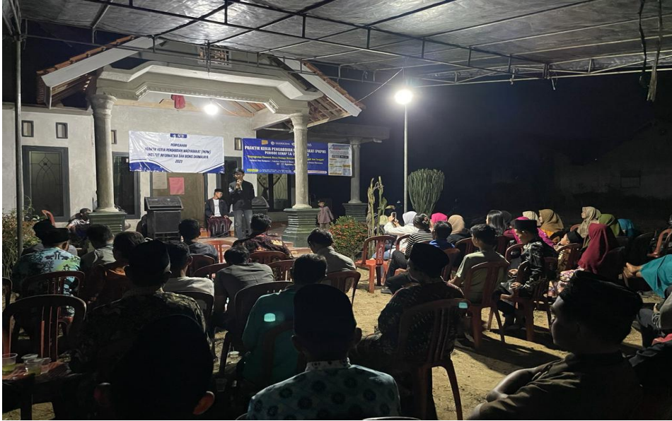
Gambar 2.21 Malam Perpisahan PKPM IIB Darmajaya