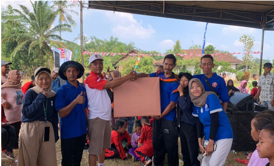
Gambar 2. 15 Juri dan Panitia Lomba Hari Kemerdekaan RI