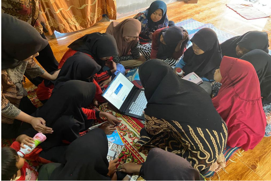
Gambar 2.23 Sosialisasi Dasar-Dasar Microsoft Office dan Microsoft Excel