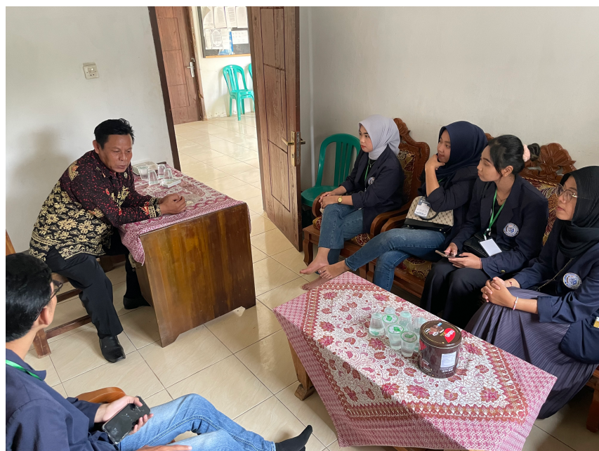
Gambar 2.10 Koordinasi Kepada Kepala Desa

Berikut dokumentasi yang diambil selama kegiatan Praktik Kerja Pengabdian Masyarakat (PKPM) di Desa Panca Bakti, Kecamatan Tegineneng, Kabupaten Pesawaran.