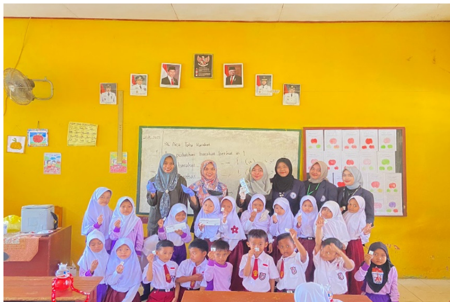
Gambar 2.18 Sosialisasi Kesehatan Rutin