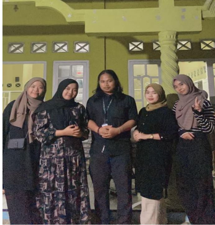
Gambar 2.17 Menghadiri Acara Yasinan Desa Panca Bakti