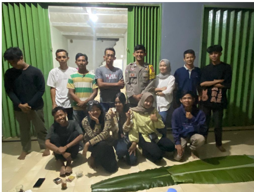
Gambar 2.16 Kumpulan Bersama Karang Taruna Desa Panca Bakti