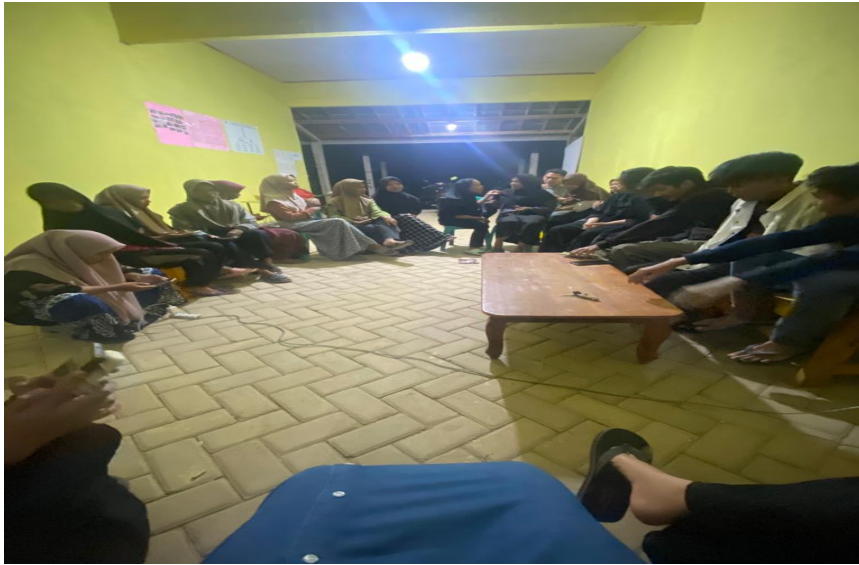
Gambar 2.9 Rapat Persiapan Hari Kemerdekaan