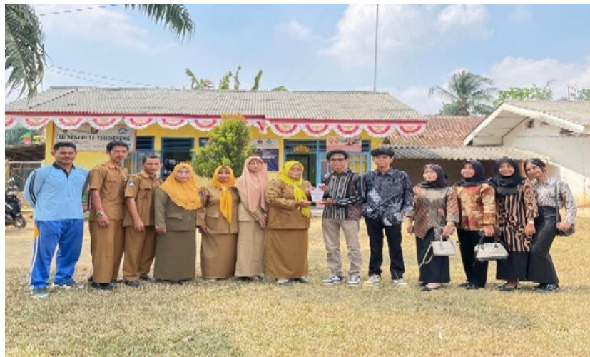
Gambar 2.7 Meminta Izin Kepada Pihak Sekolah untuk Mengajar Siswa/i SDN 1 Tegineneng