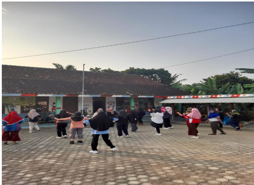
Gambar 2.22 Senam Mingguan Bersama Ibu PKK