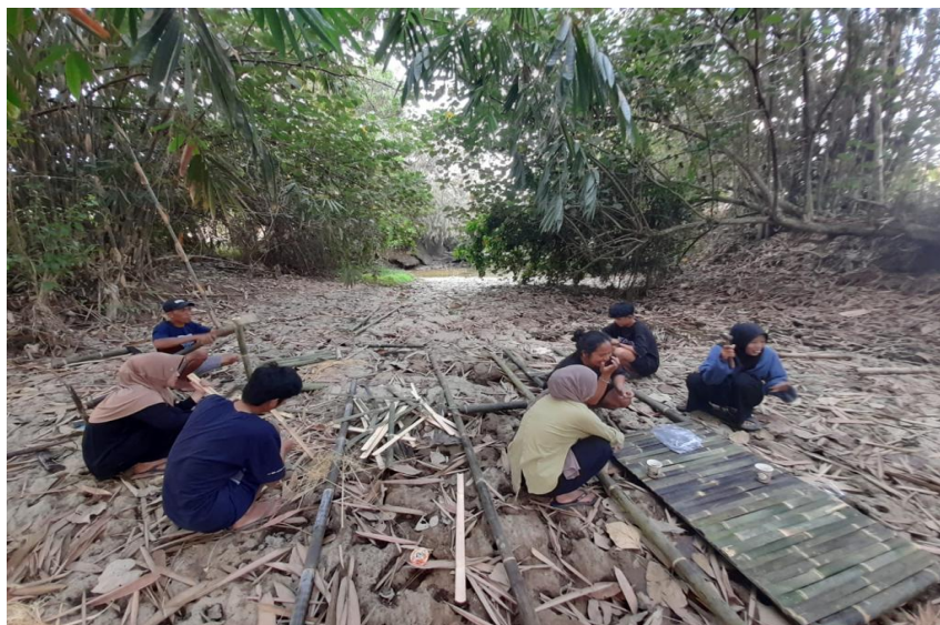
Gambar 2.8 Pembuatan Gapura Desa Panca Bakti