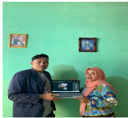
Gambar 2. 2 Penerimaan Akun