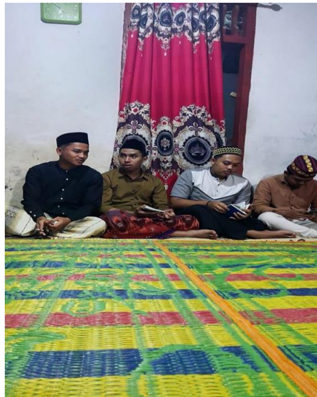
Gambar 2. 9 Mengikuti yasinan rutin malam jumat