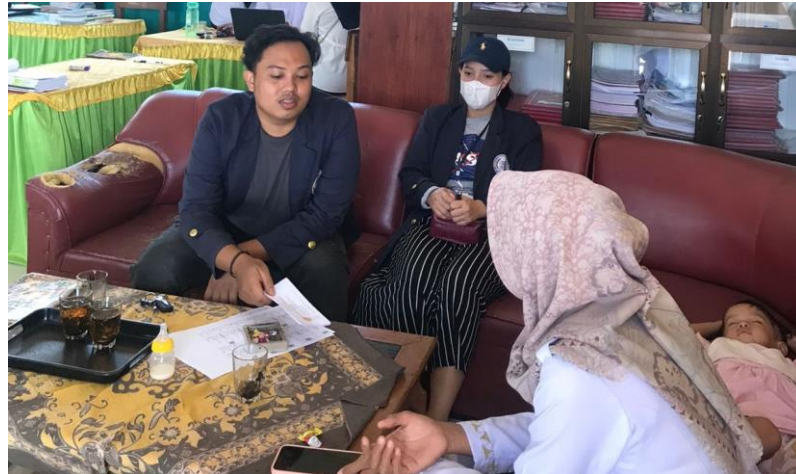
Gambar 2. 10 mengantar undangan