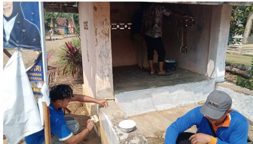
Gambar 2. 11 cat poskamling