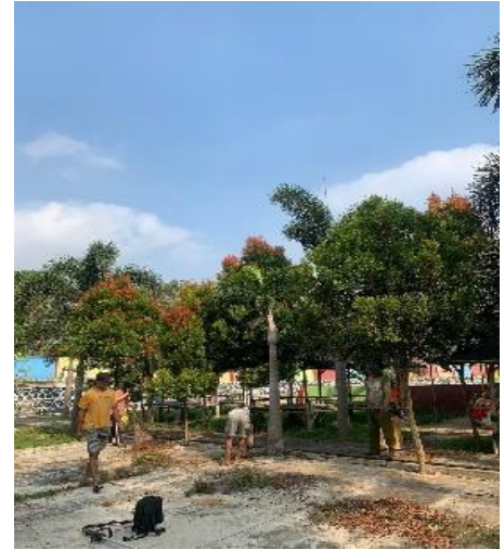
Gambar 2. 8 Gotong Royong