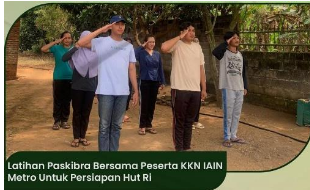
Gambar 2. 5 Latihan Paskibra dengan mahasiswa KKN IAIN Metro