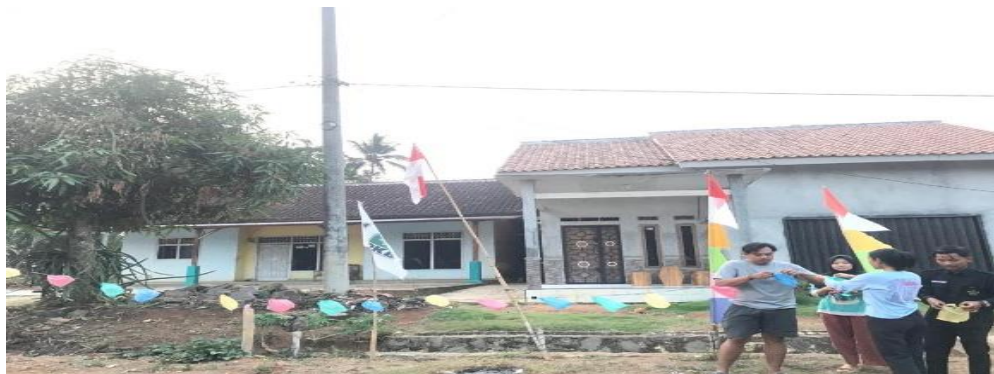
Gambar 2. 6 Membantu menghias dusun 3 dengan warga

Aktif didalam kegiatan masyarakat merupakan bentuk pendekatan dan keakraban yang nyata antara mahasiswa PKPM dengan masyarakat desa selain itu kegiatan-kegiatan yang langsung terjun di lingkungan masyarakat memberikan banyak manfaat untuk kami mahasiswa dalam melaksanakan PKPM. Berikut beberapa kegiatan yang saya dan kelompok ikuti didalam kegiatan masyarakat.