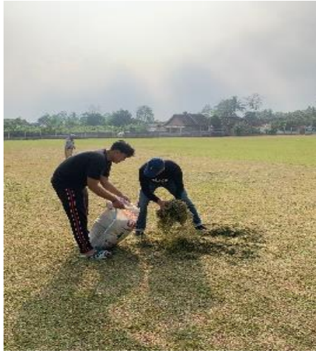
Gambar 2. 7 Jumat Bersih