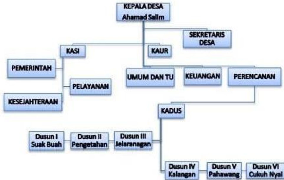
Gambar 1. 2 Struktur Organisasi Perangkat Desa Pahawang