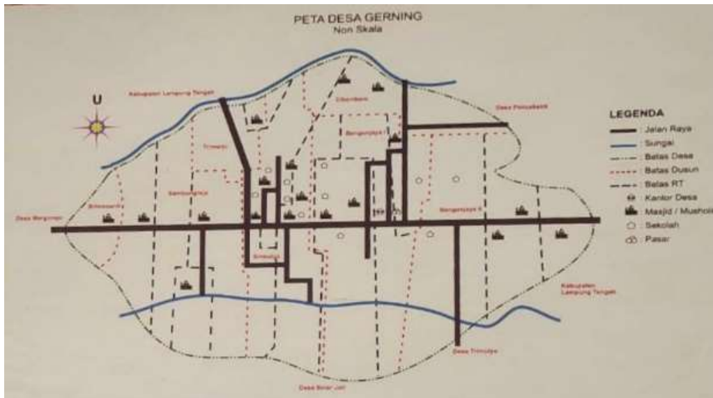
Gambar 1.1 Peta Desa Gerning

Desa Gerning merupakan salah satu Desa yang terletak di Kecamatan Tegineneng Kabupaten Pesawaran. Desa ini memiliki luas wilayah 1.288,08 km 2 . Desa ini jugaterdiri dari berbagai suku diantaranya Sunda, Jawa dan Ogan. Mayoritas matapencapaian penduduk di Desa Gerning adalah petani. Batas wilayah Desa Gerning sebelah utara Desa Ciramas, sebelah selatan Desa Sinarjati, sebelah barat Desa Margorejo dansebelah timur Desa Kedatuan. Desa Gerning meliputi sejumlah dusun sebagai berikut, yaitu: