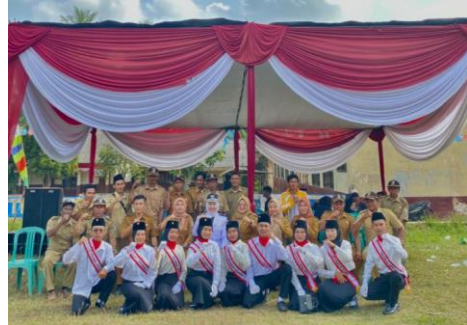
Upacara HUT RI Ke-78 dan menjadi pasukan pengibar bendera