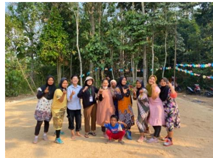
Berpartisipasi menjadi panitia HUT RI di dusun Trikora