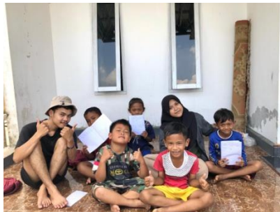
Bimbel rutin kepada anak-anak sekolah dasar