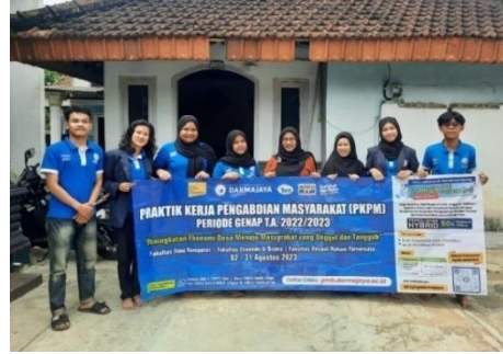
Pelepasan mahasiswa PKPM oleh DPL