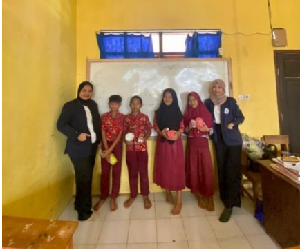
Sosialisasi menabung sejak dini di SDN 05 Negeri Katon