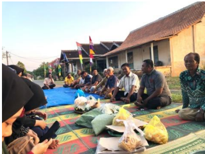
Acara pengajian bersama warga dusun trikora