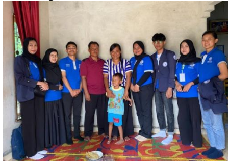
Kunjungan silaturahmi ke kediaman kepala dusun wonosari 1