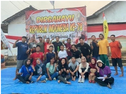
Menjadi panitia HUT RI bersama karang taruna di dusun Wonosari 1