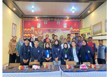
Penyambutan dan pengenalan mahasiswa PKPM dibalai desa