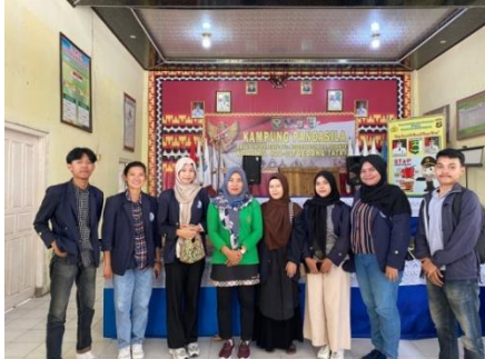
Survey Desa Ponco Kresno oleh mahasiswa PKPM