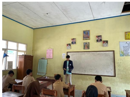
Gambar 2. 5 mengajar SMPN satu atap 10 pesawaran