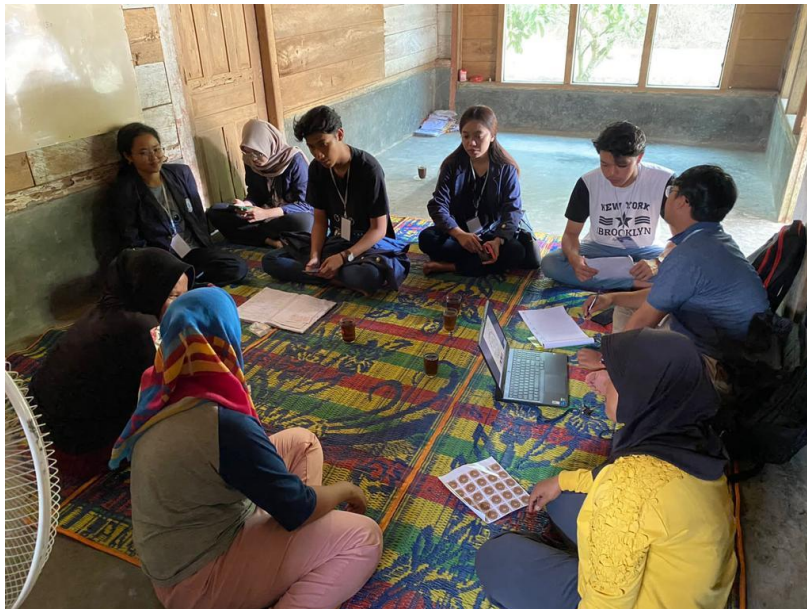
Gambar 2. 1 pelatihan pembuatan laporan keuangan