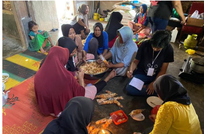
Gambar 2. 2 pelatihan pembuatan laporan keuangan