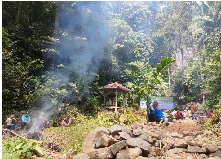
Gambar 2. 4 bersih bersih air terjun