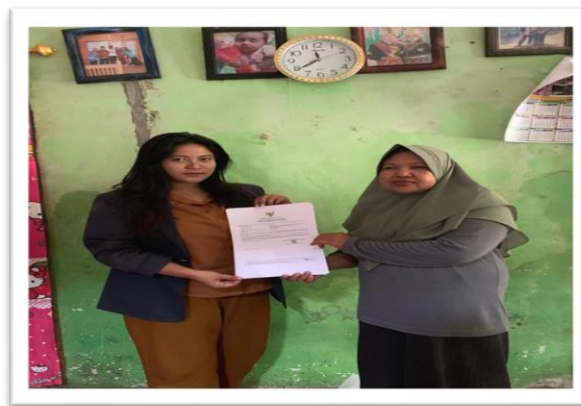
Gambar 1. Sosialisasi Legalitas Usaha Berbasis OSS