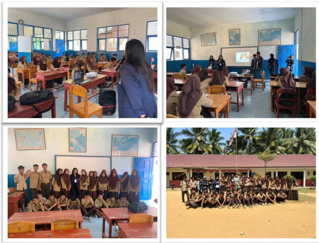
Gambar 2. Sosialisasi SMP