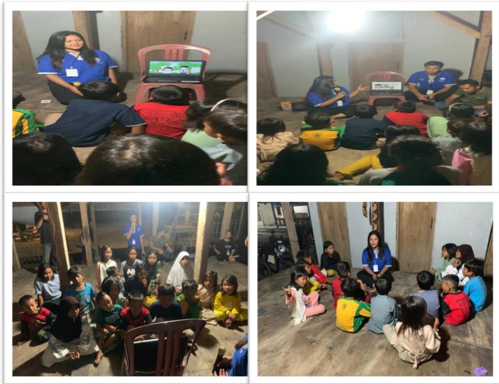
Gambar 3. Sosialisasi Anak- Anak Jalarangan