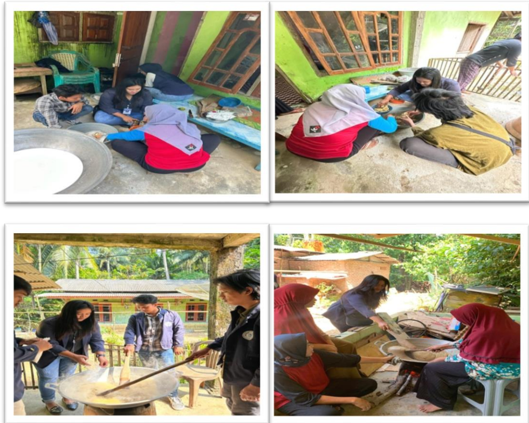
Gambar 3. Proses Produksi