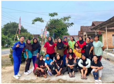
Senam bersama ibu-ibu PKK dusun wonosari 1