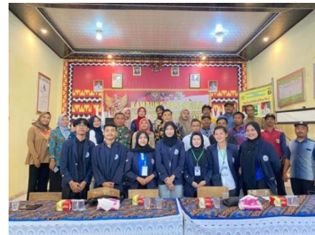
Penyambutan dan pengenalan mahasiswa PKPM dibalai desa