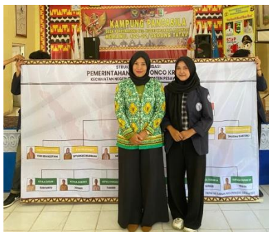
Penyerahan Banner Struktur Organisasi Pemerintahan