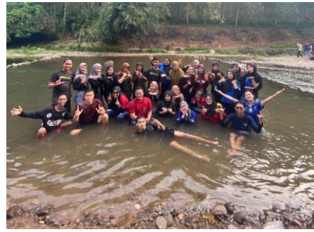
Perpisahan mahasiswa PKPM IIB Darmajaya dan KKN IAIN Metro bersama aparaturnya desa