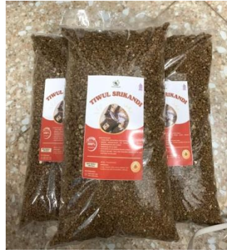
Olahan Tiwul Srikandi