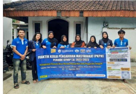
Pelepasan mahasiswa PKPM oleh DPL