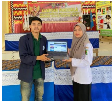
Penyerahan Web Desa kepada Operator