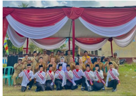
Upacara HUT RI Ke-78 dan menjadi pasukan pengibar bendera