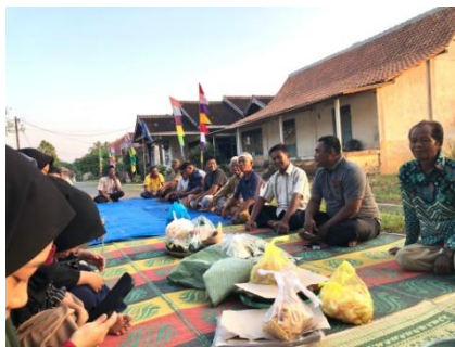
Acara pengajian bersama warga dusun trikora