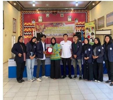
Pemberian cinderamata kepada Desa Ponco Kresno