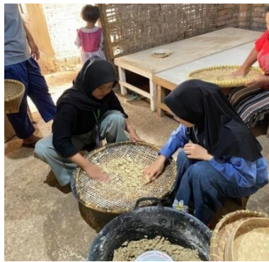
Membantu dalam proses pembuatan Tiwul srikandi