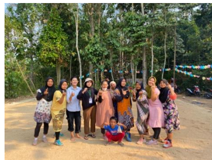
Berpartisipasi menjadi panitia HUT RI di dusun Trikora