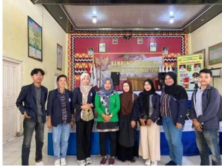
Survey Desa Ponco Kresno oleh mahasiswa PKPM