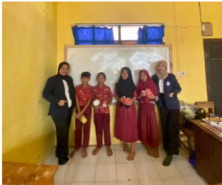
Sosialisasi menabung sejak dini di SDN 05 Negeri Katon