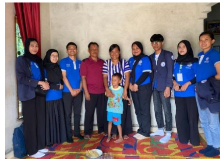
Kunjungan silaturahmi ke kediaman kepala dusun wonosari 1