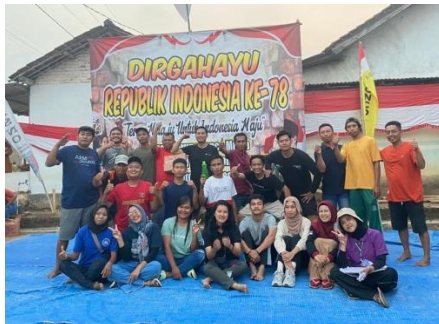
Menjadi panitia HUT RI bersama karang taruna di dusun Wonosari 1