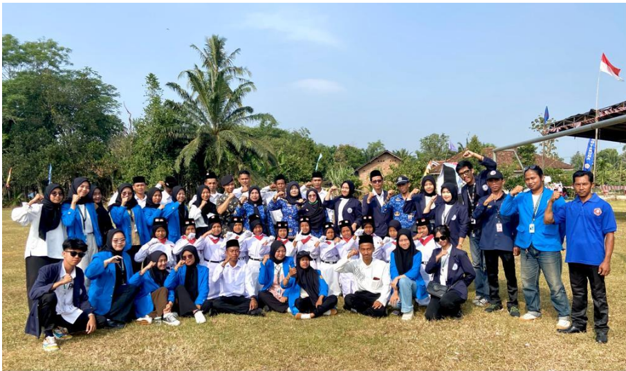
Upacara memperingati HUT RI 17 Agustus di Desa Panca Bakti