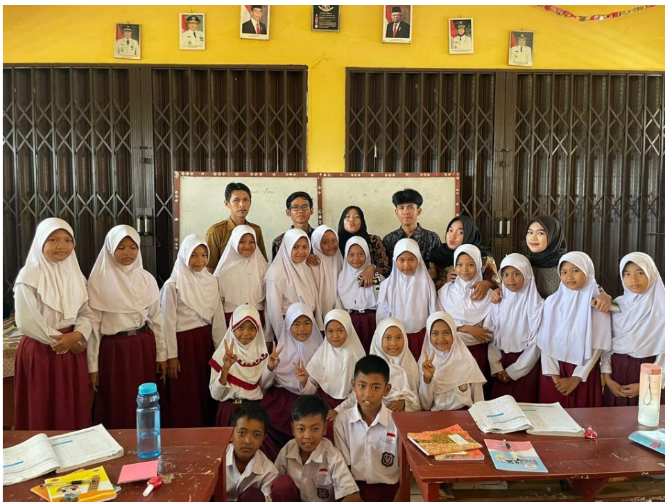
Sosialisasi dan mengajar di SDN 11 Tegineneng