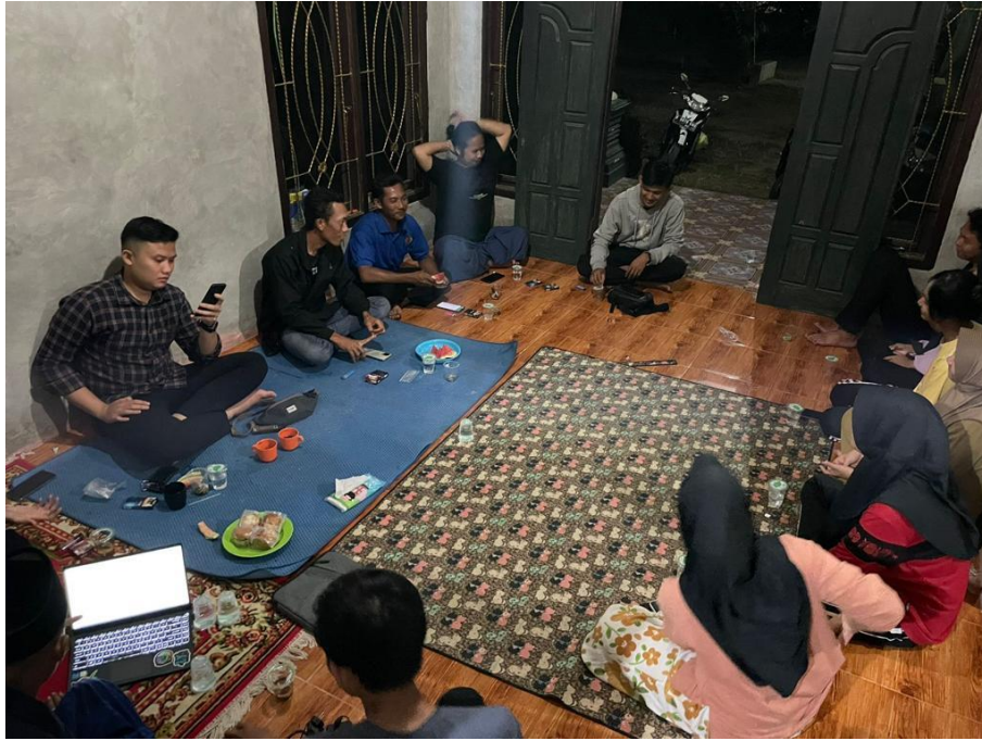
Rapat ke dua panitia HUT RI