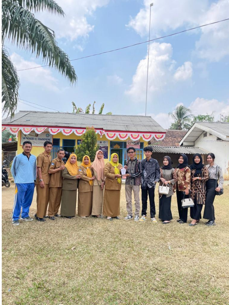
Penyerahan pelakat untuk SDN 11 Tegineneng sebagai kenang kenangan dari Mahasiswa/I PKPM IIB Darmajaya