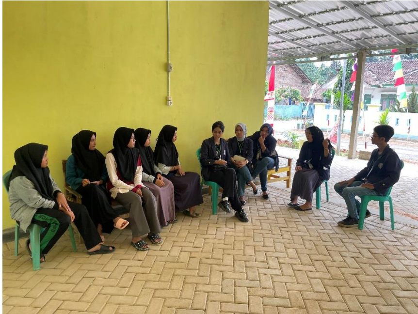
Sosialisasi bersama mahasiswa KKN IAIN Metro sharing tentang program kerja yang dijalankan