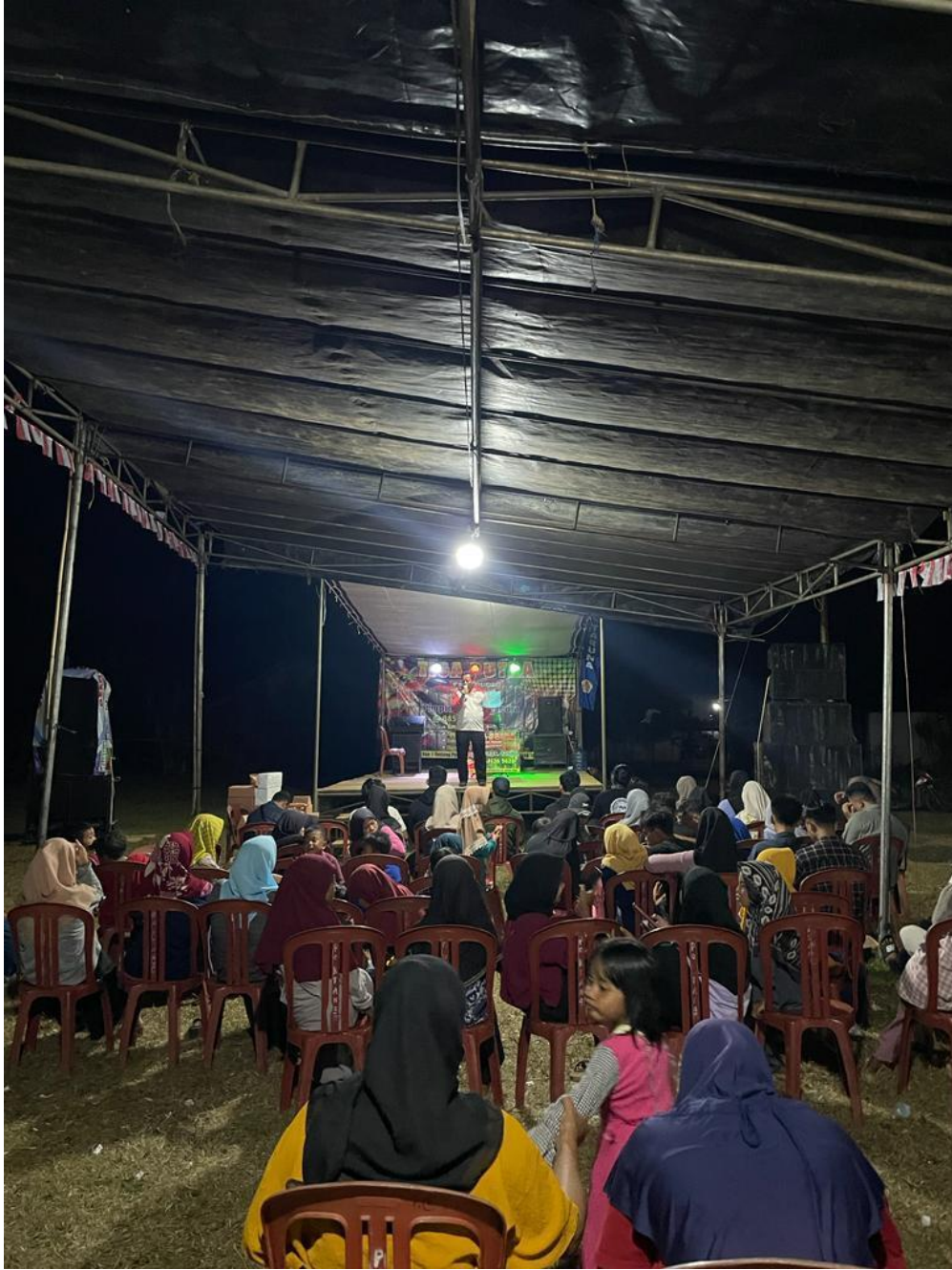
Malam Puncak HUT RI 17 Agustus di Desa Panca Bakti