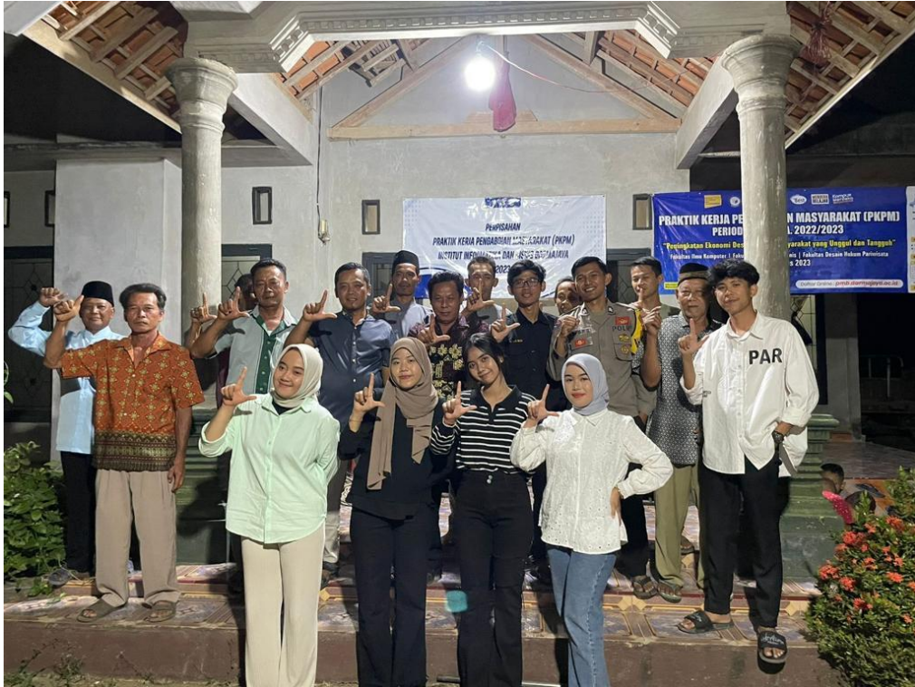
Perpisahan dengan Aparatur dan Perangkat Desa Panca Bakti