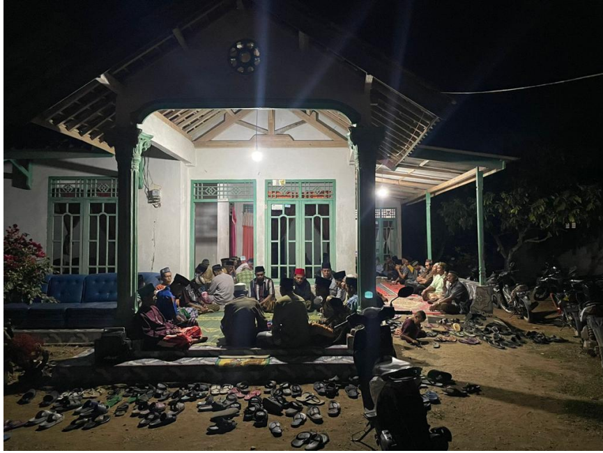
Yasinan rutin warga di Desa Panca Bakti