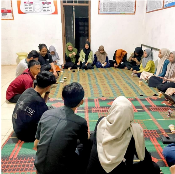
Rapat pembentukan panitia HUT RI di Desa Panca Bakti dengan KKN IAIN Metro dan Karang Taruna