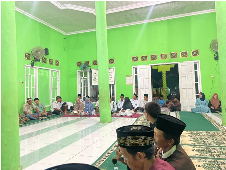
Mengikuti pengajian bersama masyarakat di Masjid Nurul Iman Desa Panca Bakti