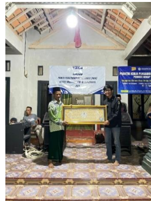
Penyerahan Cendera Mata dan Jam Masjid untuk kenang kenangan dari Mahasiswa/I PKPM IIB Darmajaya untuk Kepala Desa Panca Bakti dan Masjid Nurul Iman