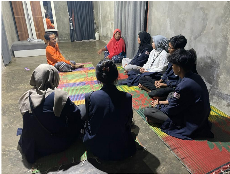
Sosialisasi dengan Perangkat Desa dan Tokoh Masyarakat