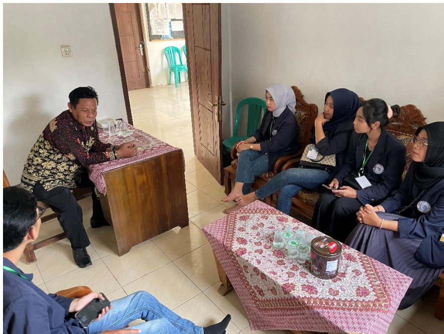
Sosialisasi dengan Kepala Desa Panca Bakti membahas tentang program kerja yang akan dijalankan