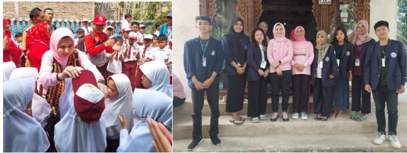
Menyambut Kedatangan Ibu Bupati Pesawaran