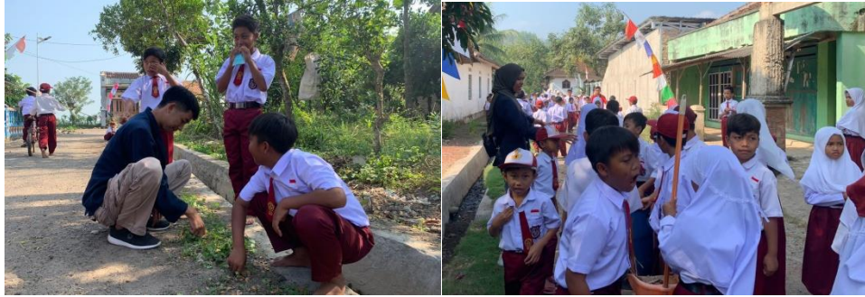
Gotong Royong Bersama SDN 9 Way Khilau