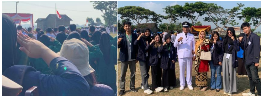
Mengikuti Upacara HUT RI Ke-78