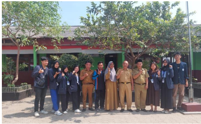
Perpisahan dengan Kepala SDN 9 Way Khilau