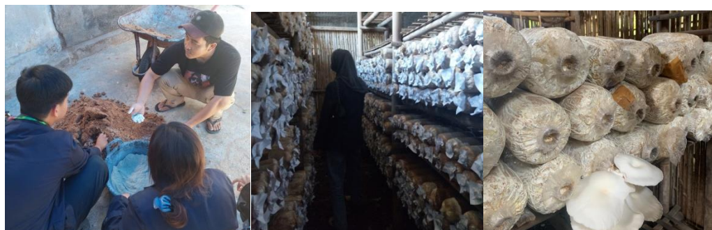
Melihat Proses Budidaya Jamur Berkah Jaya