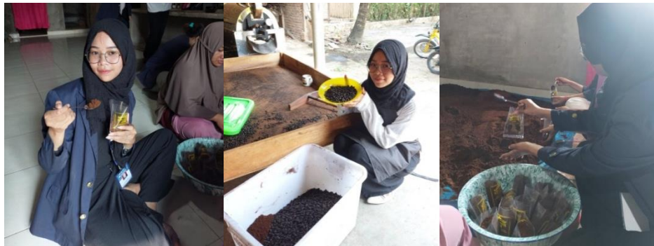
Membantu Pembuatan Kopi Bubuk JM