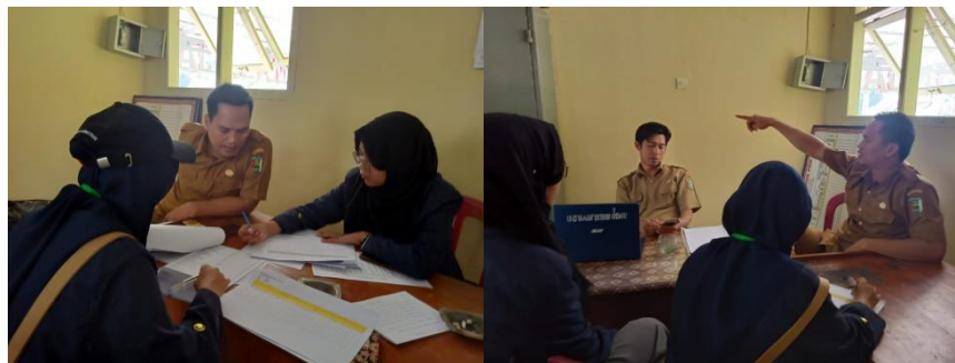
Wawancara Terkait Profil Desa