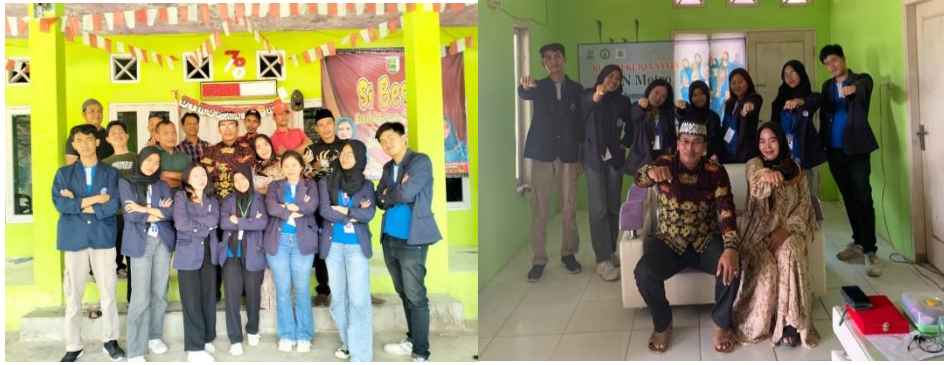
Perpisahan dengan Aparatur Desa