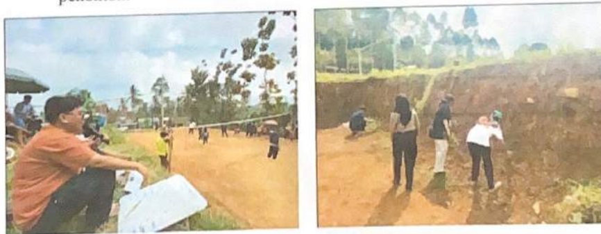
Gambar 2.9. Membantu Mempersiapkan Lomba Volley

Kami berpartisipasi aktif dalam mendukung acara lomba volley yang diselenggarakan di desa Gunung Rejo. Dalam kegiatan ini kami berkontribusi dengan menyusun jadwal pertandingan, mengkoordinasikan team, dan mengurus logistik acara. Dengan kerja sama tim yang baik kami berhasil menciptakan lingkungan yang kondusif untuk peserta dan penonton.