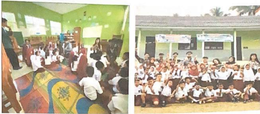
Gambar 2.4. Sosialisasi di SDN 21 Wai Ratai