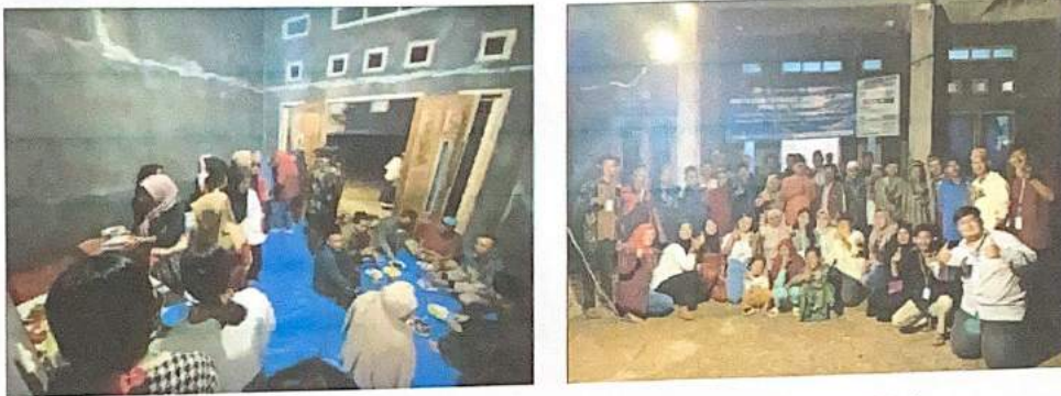
Gambar 2.12. Perpisahan bersama Masyarakat Gunung Rejo

Kegiatan perpisahan menjadi momen penting selama PKPM kami di dusun Tegairejo. Kami berperan dalam mengorganisir dan mendukung berbagai aspek acara perpisahan ini, termasuk pemilihan tema, persiapan dekorasi, dan perencanaan acara. Dengan kerja keras tim, kami dapat menciptakan perpisahan yang berkesan dan penuh makna bagi seluruh warga dusun Tegalrejo.