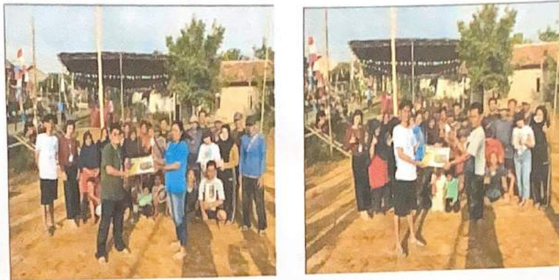
Gambar 2.8. Memberikan Dukungan Fasilitas Volley

Dalam kegiatan ini kami memberikan dukungan terhadap warga yang aktif bermain olahraga volley didusun Tegalrejo berupa Fasilitas papan score dua buah, agar warga Tegalrejo lebih semangat dalam melakukan kegiatan volley bersama yang biasa dilakukan setiap sore oleh warga dusun Tegalrejo.