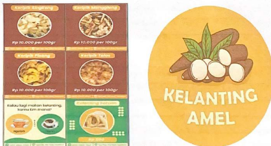
Gambar 2.2. Logo Merek Produk

Berikut ini merupakan Gambar 2.2 dari kartu nama dan banner yang sudah kami serahkan dan kami cetak untuk UMKM.