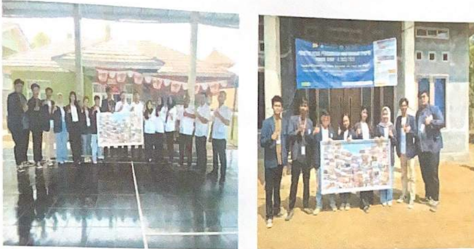
Gambar 2.13. Pemberian Cenderamata Untuk Desa Gunung Rejo