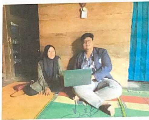
Gambar 2.5. Pembukuan Akuntansi bersama Pemilik UMKM Keripik Bulin

Kegiatan ini dilakukan dengan menggunakan aplikasi Microsoft Excel , untuk memudahkan proses pembukuan menjadi lebih mudah dan praktis, maka dari itu kami buat template pembukuan sehingga pihak UMKM hanya perlu melakukan input angka dan akan otomatis langsung terhitung otomatis.