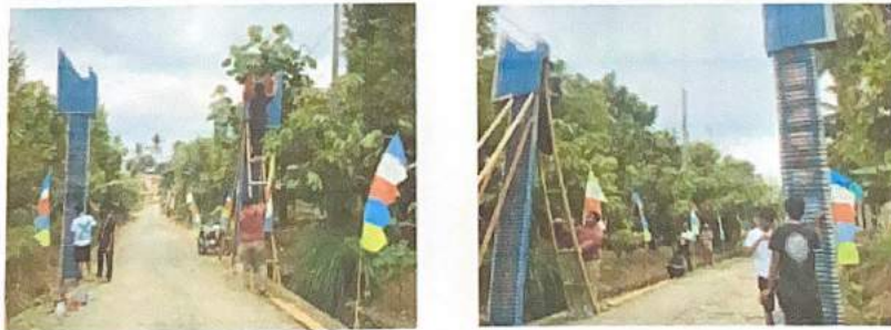
Gambar 2.7. Pembaharuan Gapura Dusun Tegal Rejo

Gapura bukan hanya merupakan bangunan fisik saja namun lebih memiliki fungsi dan arti tersendiri sebagai pintu gerbang maupun tanda batas suatu daerah satu dengan daerah lain. Dengan melihat kondisi gapura sebelumnya yang sudah rusak kami melakukan pembaruan pada Gapura Dusun Tegalrejo yang melibatkan Bapak Kadus, Bapak RT, mahasiswa PKPM Darmajaya dan Bapak-bapak warga dusun Tegalrejo.