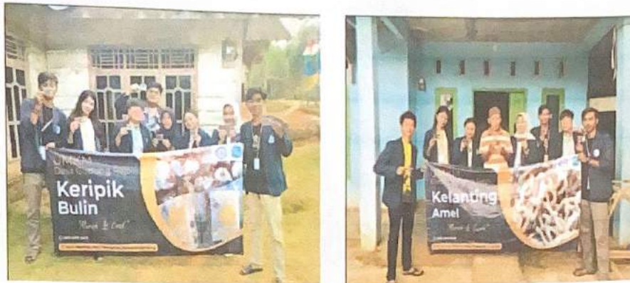
Gambar 2.3. Melakukan Inovasi Branding pada UMKM