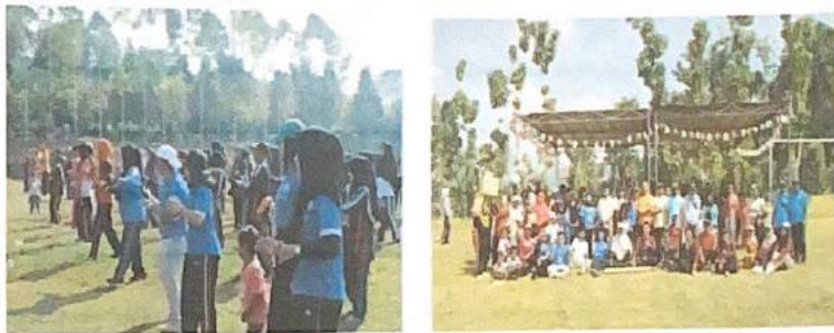
Gambar 2.6. Senam Bersama

Tujuan dari kegiatan ini adalah untuk meningkatkan kebugaran jasmani yang diikuti oleh warga Gunung Rejo yang dilaksanakan di Lapangan depan Balai desa Gunung Rejo pada pukul 08.00 pagi. Yang dihadiri Bapak Kepala Desa beserta Perangkat desa dan diikuti dari kalangan lansia, ibu-ibu, bapak-bapak, remaja, dan anak anak.