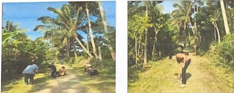
Gambar 2.11. Membantu membersihkan area Dusun Tegal Rejo

Dalam kegiatan ini kami dengan tekun berfokus pada Upaya membersihkan area dusun Tegalrejo, sebagai bagian dari komitmen kami untuk meningkatkan lingkungan setempat. Kami terlibat dalam kegiatan pembersihan, termasuk membersihkan jalan dan lingkungan sekitar dusun Tegalrejo. Upaya ini bertujuan untuk menciptakan lingkungan yang