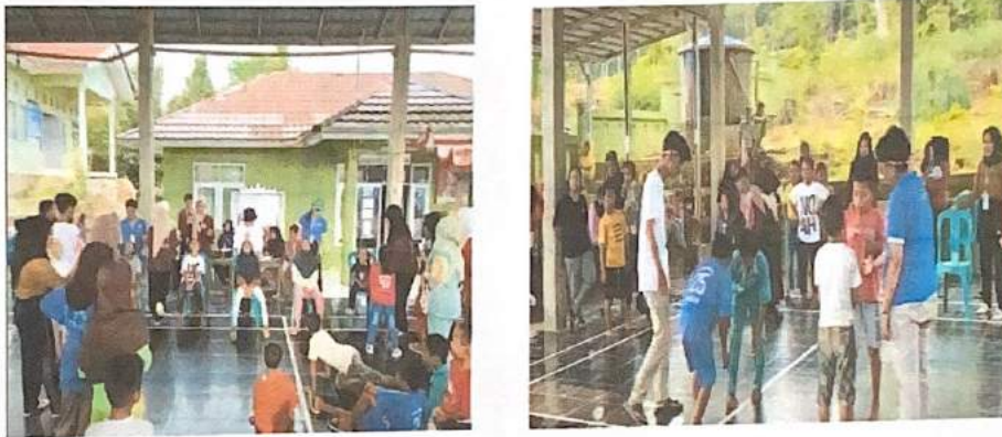
Gambar 2.10. Membantu Acara 17-an di Desa

Dalam kegiatan ini kami turut serta menyukseskan acara lomba 17 Agustus dengan berbagai peran yang kami emban. Kami berperan penting dalam pelaksanaan memperingati Hari Kemerdekaan Indonesia. Dengan kerja keras dan semangat kemerdekaan, kami berhasil menciptakan suasana ini. Selain itu, kami juga aktif dalam mengorganisir perlombaan, mengurus perizinan, dan memastikan keamanan acara berlangsung dengan lancar.