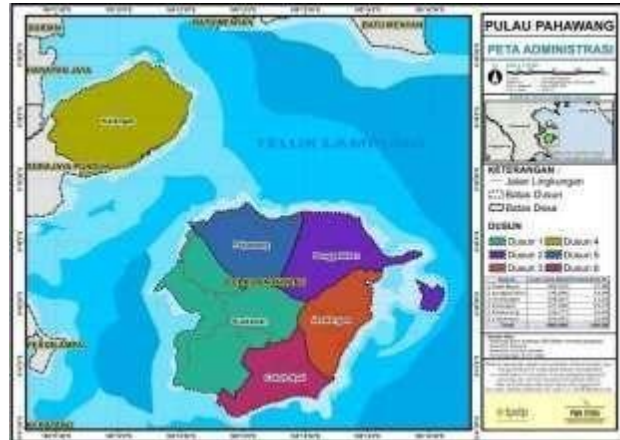
Gambar 1 Peta Desa Pulau Pahawang

Desa Pulau Pahawang merupakan salah satu desa dan pulau yang berada di Kecamatan Marga Punduh Kabupaten Pesawaran, Desa Pulau Pahawang berada 10 meter diatas permukaan laut, kondisi permukaan tanahnya landau dan berbukit memiliki luas hampir 1000 Ha, dan berpenduduk lebih dari 1500 jiwa. Desa Pulau Pahawang memiliki 6 dusun yakni sebagai berikut :