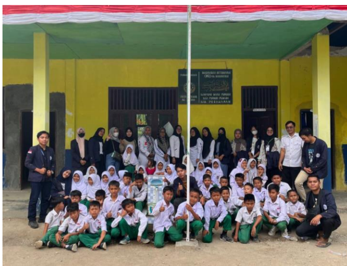
berkunjung ke MI Al-Khairiyah