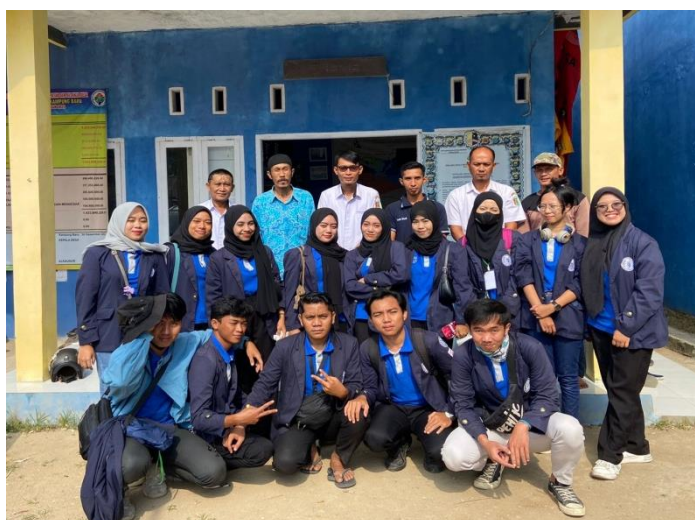
penjemputan mahasiswa PKPM