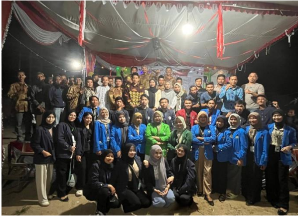
malam puncak HUT RI 78