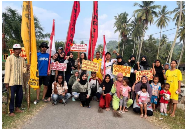
gotong royong di dusun pemindahan