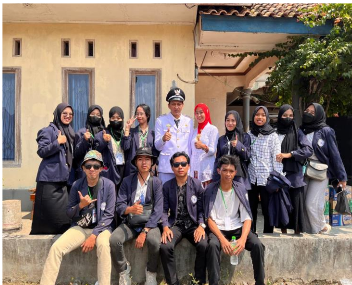
foto bersama kepala desa kampung baru