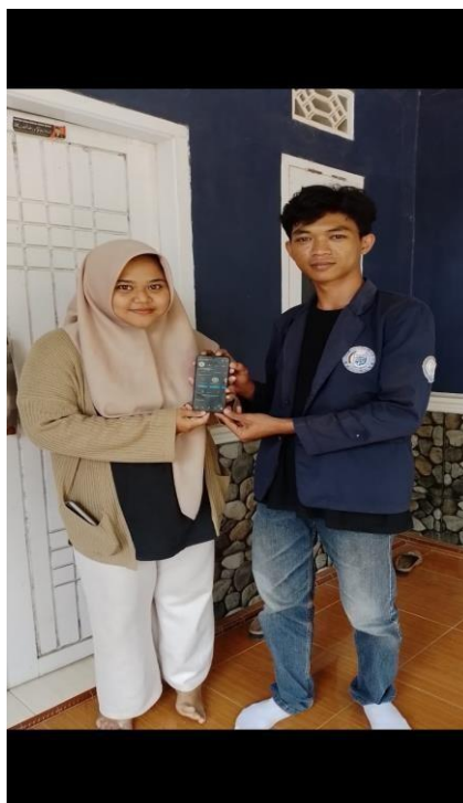
Gambar 1.6 Dokumentasi Penyerahan akun sosia media instagram kepada umkm