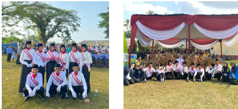
Gambar 2.4 Menjadi Pasukan Pengibar Bendera pada HUT RI Ke-78

Mahasiswa PKPM IIB Darmajaya dan mahasiswa KKN IAIN Metro menjadi petugas pengibar bendera dalam rangka HUT RI Ke-78 di desa ponco kresno.