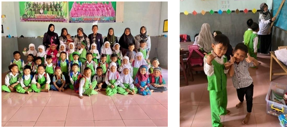
Gambar 2.6 Memberikan Pembelajaran pada anak usia dini di PAUD RA Ma'arif

Memberikan pembelajaran berupa cara membaca, berhitung, bernyanyi dan mewarnai pada anak usia dini di PAUD RA Ma'arif