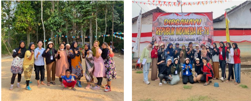
Gambar 2.5 Berpartisipasi Menjadi Panitia HUT RI