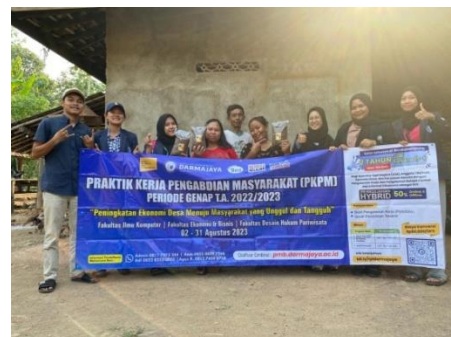
Gambar 2.2 Ikut Serta Dalam Proses Pembuatan dan pengemasan Tiwul