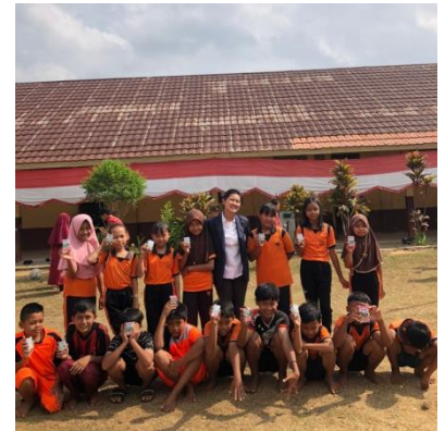
Gambar 2.1 Sosialisasi PHBS dan pembagian susu kepada anak-anak SDN 05 Negeri Katon