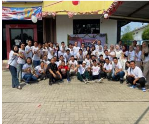
Gambar.5 Kegiatan kemerdekaan Indonesia 17 Agustus