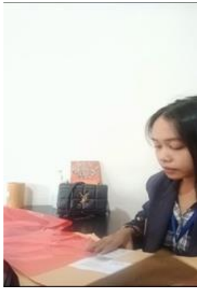
Gambar. 3 Kegiatan packing paket dokumen