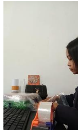
Gambar.6 Kegiatan packing paket barang