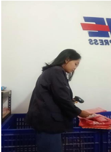
Gambar.7 Kegiatan melakukan HO (Handover Courier)