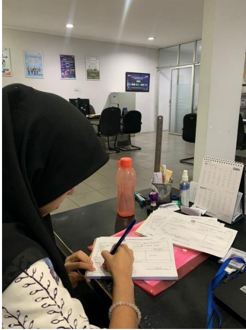
Gambar 5. Membuat overbooking pinjaman nasabah