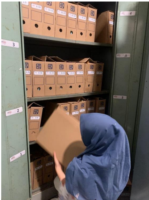
Gambar 4. Menyusun tempat penyimpanan berkas Pinjaman aktif