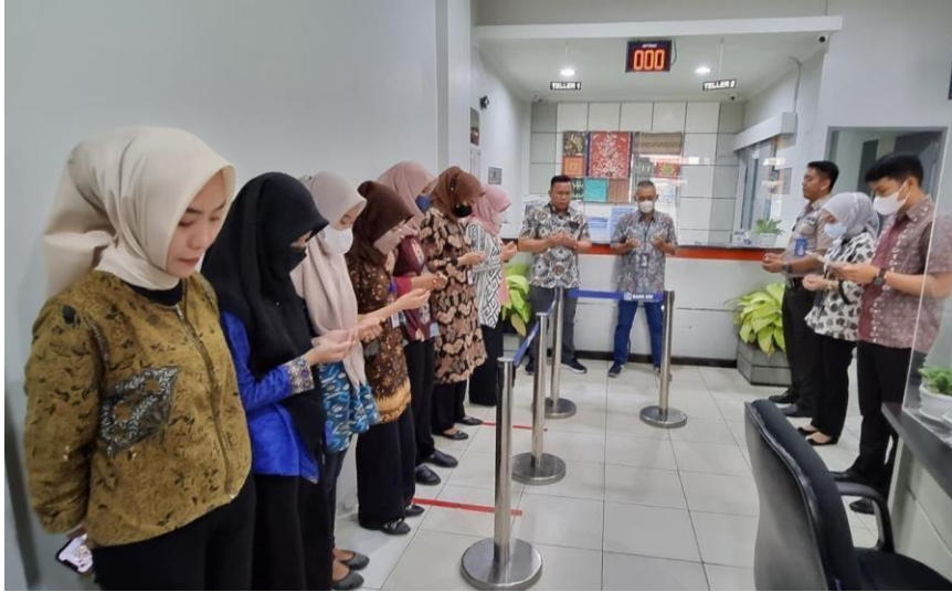
Gambar 7. Kegiatan doa pagi