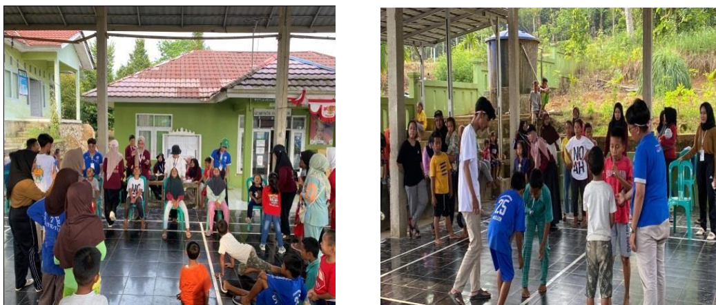
Gambar 2. 10 Membantu Acara 17-an di Desa

Dalam kegiatan ini kami turut serta menyukseskan acara lomba 17 Agustus dengan berbagai peran yang kami emban. Kami berperan penting dalam pelaksanaan memperingati Hari Kemerdekaan Indonesia. Dengan kerja keras dan semangat kemerdekaan, kami berhasil menciptakan suasana ini. Selain itu, kami juga aktif dalam mengorganisir perlombaan, mengurus perizinan, dan memastikan keamanan acara berlangsung dengan lancar.