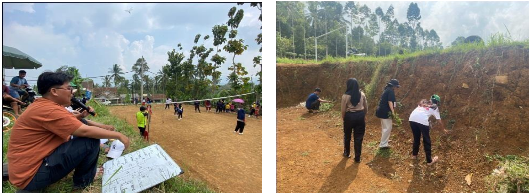
Gambar 2. 9 Membantu Mempersiapkan Lomba Volly

Kami berpartisipasi aktif dalam mendukung acara lomba volly yang diselenggarakan di desa Gunung Rejo. Dalam kegiatan ini kami berkontribusi dengan menyusun jadwal pertandingan, mengkoordinasikan team, dan mengurus logistik acara. Dengan kerja sama tim yang baik kami berhasil menciptakan lingkungan yang kondusif untuk peserta dan penonton.