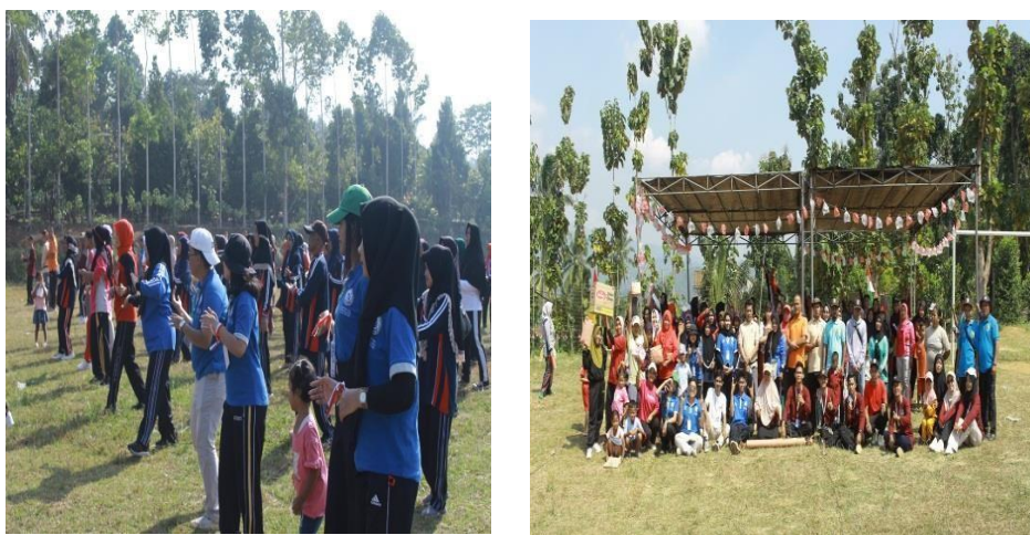
Gambar 2. 6 Senam Bersama

Tujuan dari kegiatan ini adalah untuk meningkatkan kebugaran jasmani yang diikuti oleh warga Gunung Rejo yang dilaksanakan di Lapangan depan Balai desa Gunung Rejo pada pukul 08.00 pagi. Yang dihadiri Bapak Kepala Desa beserta Perangkat desa dan diikuti dari kalangan lansia, ibu-ibu, bapak-bapak, remaja, dan anak anak.