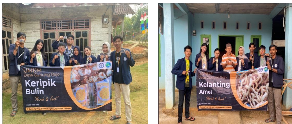
Gambar 2. 4 Melakukan Inovasi Branding pada UMKM