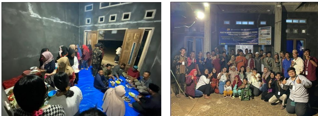
Gambar 2. 12 . Perpisahan bersama Masyarakat Gunung Rejo

Kegiatan perpisahan menjadi momen penting selama PKPM kami di dusun Tegairejo. Kami berperan dalam mengorganisir dan mendukung berbagai aspek acara perpisahan ini, termasuk pemilihan tema, persiapan dekorasi, dan perencanaan acara. Dengan kerja keras tim, kami dapat menciptakan perpisahan yang berkesan dan penuh makna bagi seluruh warga dusun Tegalrejo.