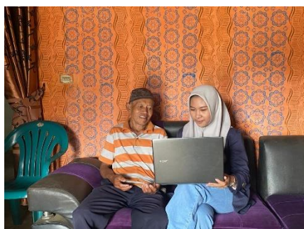
Gambar 2. 2 pelatihan tentang E-commerce

Memberikan pelatihan E-commerce dan desain pada pemilik umkm Kelanting Amel, kegiatan ini dilakukan untuk mengedukasi tentang digital marketing yang bertujuan untuk memasarkan produk agar lebih luas dikenal didalam maupun diluar desa. Melakukan pelatihan E-commerce menggunakan aplikasi-aplikasi digital marketing contohnya facebook, Instagram, shoppe untuk menyokong diskusi antara mahasiswa dan pemilik UMKM kelanting amel , Terdapat desain gambar dan nama produk sebagai identitas umkm kerupuk dua rasa, desain-desain tersebut juga mencantumkan tentang harga, alamat dan kontak yang dapat dihubungi sehingga memperluas dan mempermudah proses penjualan.