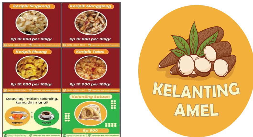
Gambar 2. 3 Logo Merek Produk