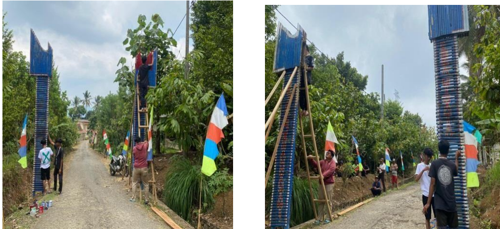
Gambar 2. 7 Pembaruan Gapura Dusun Tegal Rejo

batas suatu daerah satu dengan daerah lain. Dengan melihat kondisi gapura sebelumnya yang sudah rusak kami melakukan pembaruan pada Gapura Dusun Tegalrejo yang melibatkan Bapak Kadus, Bapak RT, mahasiswa PKPM Darmajaya dan Bapak-bapak warga dusun Tegalrejo.