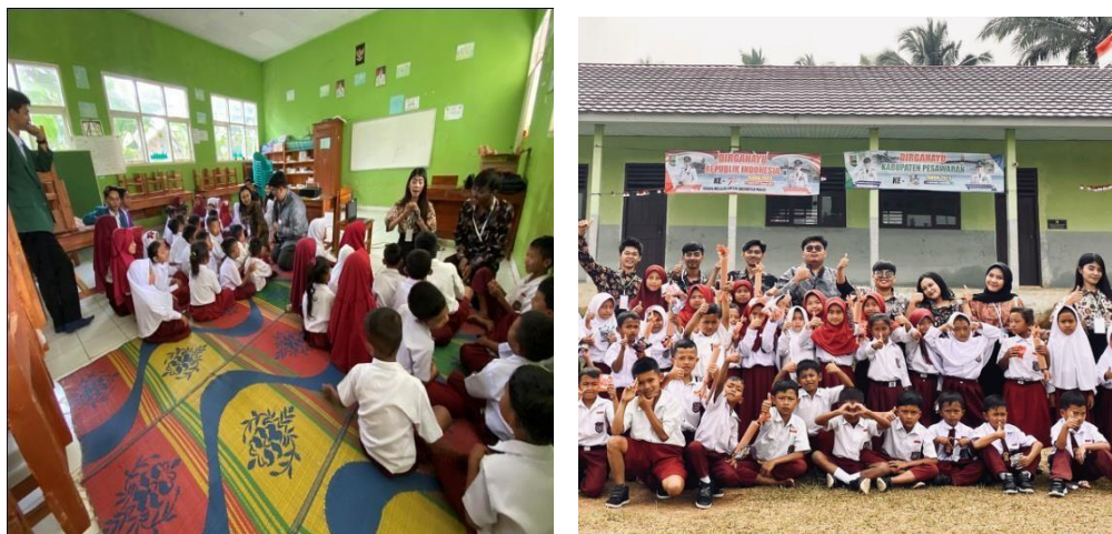
Gambar 2. 5 Sosialisasi di SDN 21 Wai Ratai