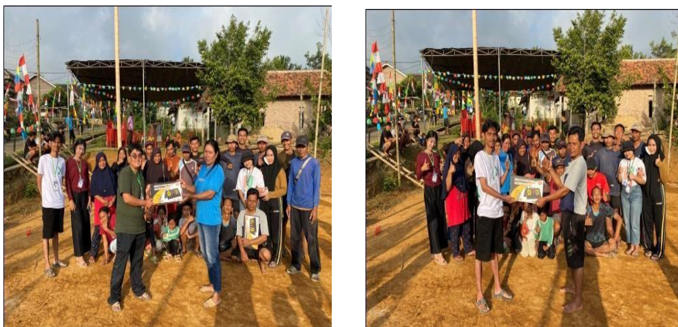
Gambar 2. 8 Memberikan Dukungan Fasilitas Volly

Dalam kegiatan ini kami memberikan dukungan terhadap warga yang aktif bermain olahraga volly didusun Tegalrejo berupa Fasilitas papan score dua buah, agar warga Tegalrejo lebih semangat dalam melakukan kegiatan volly bersama yang biasa dilakukan setiap sore oleh warga dusun Tegalrejo.