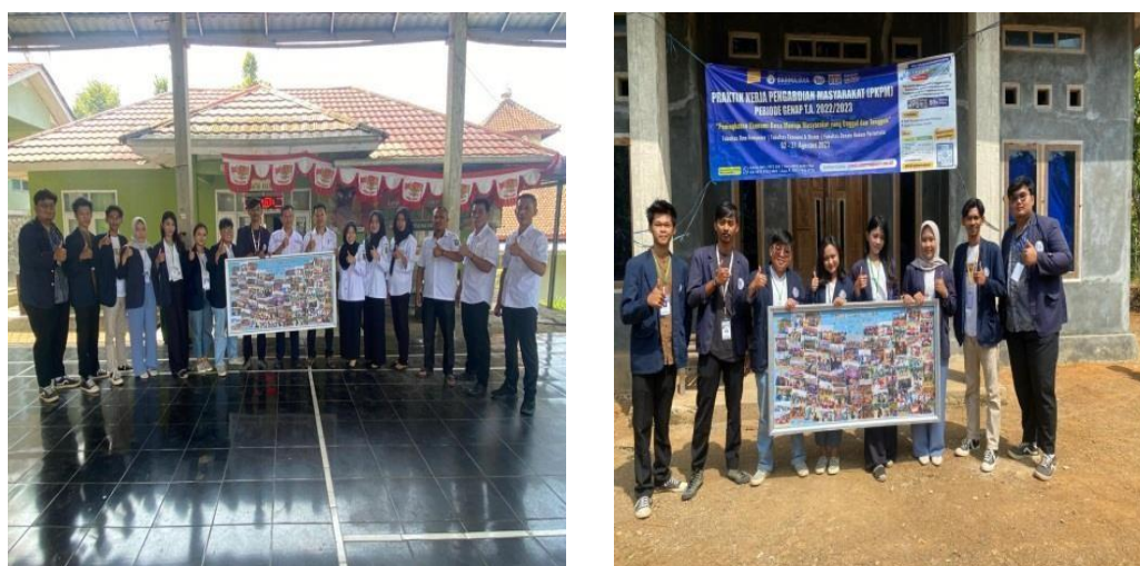
Gambar 2. 13 Pemberian Cenderamata Untuk Desa Gunung Rejo

Sebagai tanda terima kasih atas dukungan dan keramahan Masyarakat dan aparaturnya desa Gunung Rejo, kami memberikan cenderamata sebagai bagian dari Program Kerja PKPM kami di desa Gunung Rejo. Kami membuat cenderamata berupa madding yang kami beri nama 101 Memories yang berisikan dokumentasi kami selama PKPM di desa Gunung Rejo. Pemberian cenderamata ini menjadi cara kami agar Masyarakat dapat selalu mengingat kegiatan PKPM dan juga sebagai bentuk apresiasi kami terhadap keramahan Masyarakat desa Gunung Rejo.