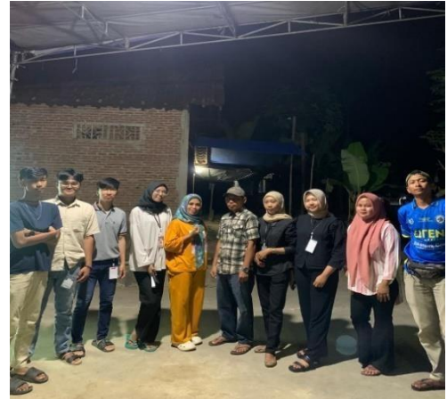
Gambar 2.5 Panitia Perlombaan 17 Agustus