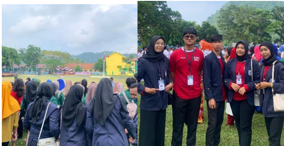
Gambar 2.4 Upacara Kemerdekaan HUT RI Ke 78

Upacara HUT-RI untuk memperingati hari kemerdekaan Bangsa Indonesia, Upacara Peringatan Detik-Detik Proklamasi Kemerdekaan Bangsa Indonesia dan Pengibaran Sang Merah Putih di tingkat Desa. Upacara bendera dapat meningkatkan sikap kebersamaan dan persatuan di sekolah maupun di Desa, karena dengan adanya Upacara Bendera membuat semua peserta upacara yang akan senantiasa bersama-sama mengikuti aba-aba dan arahan dari pemimpin upacara untuk berpakaian seragam, sehingga menunjukkan sikap kebersamaan. upacara membuat semua peserta upacara mengingat perjuangan para pahlawan yang telah gugur.