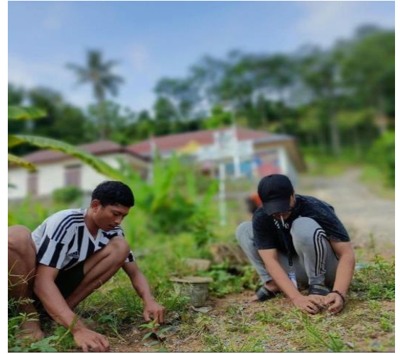
Gambar 2.7 Kerja Bakti