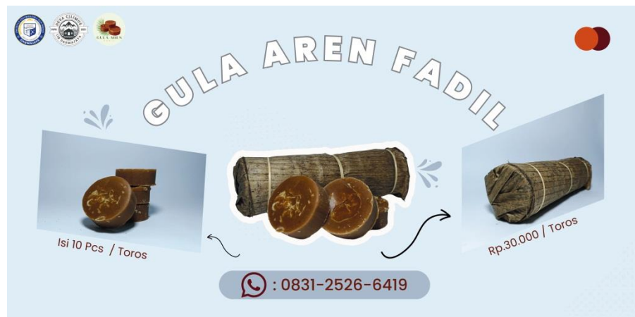
Gambar 2.2 Salah satu Desain Banner untuk UMKM

Pembuatan Banner adalah sarana media promosi, sama halnya dengan contoh pamflet, sama-sama digunakan sebagai media promosi dalam penggunaan dan pemasangan mudah dan tidak terlalu ribet, banner merupakan media promosi yang menggunakan banner Kita dapat menggunakan banner untuk mempromosikan produk UMKM. Selain itu menggunakan banner juga akan mendapatkan keuntungan lebih banyak, pengunjung akan dengan mudah mengenali produk UMKM.