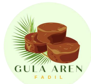
Gambar 2.1 Salah Satu Design Merk untuk UMKM

merk juga menunjukkan asal barang tersebut dihasilkan. Design merk yang baik dapat mensinergikan dan mengintegrasikan dari beberapa elemen desain dan fungsi kemasan, sehingga dihasilkan kemasan yang memiliki tingkat efektifitas , efisiensi dan fungsi yang sesuai baik dalam produksi kemasan sampai kegunaan kemasan. Dengan itu, perlu dibuatkan merk dagang yang mencantumkan nama UMKM dan contact person untuk UMKM yang berada di Desa Cilimus, karena UMKM yang berada di Desa Cilimus belum memiliki merk dagang dengan tujuan agar hasil penjualan UMKM tersebut dapat meningkat, UMKM tersebut lebih mudah diingat dan mudah untuk dihubungi apabila ingin memesan Produk tersebut baik dalam jumlah sedikit ataupun dalam jumlah banyak.