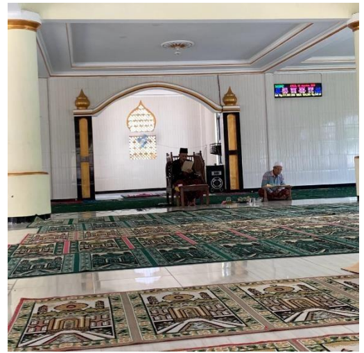
Gambar 2.6 Pengajian Rutin