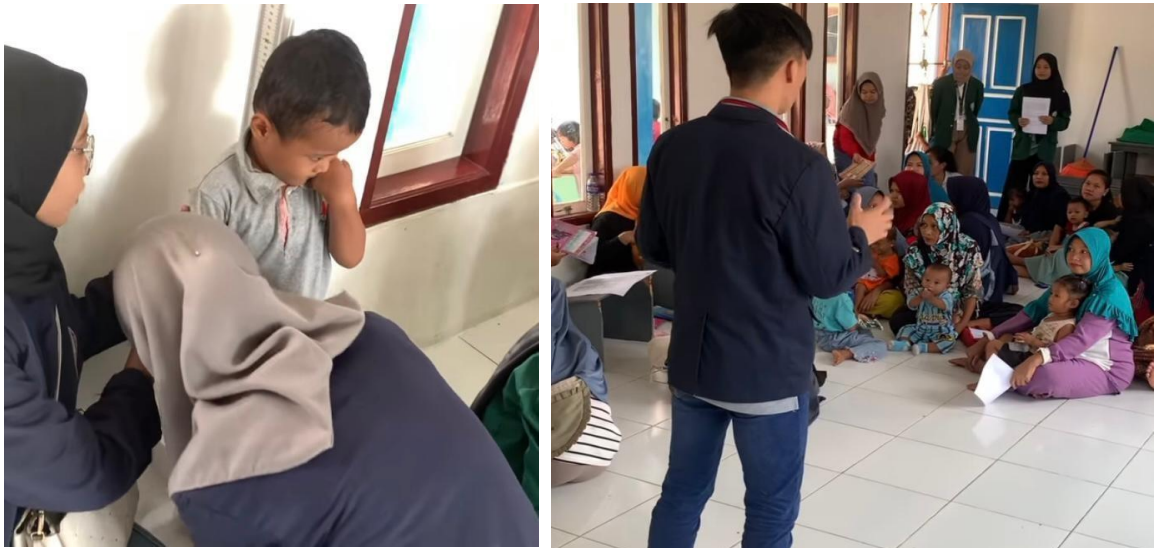
Gambar 2.11 Gerakan Anti Stunting

Salah satu upaya penanggulangan stunting pada balita adalah dengan memberikan edukasi kepada masyarakat dalam rangka peningkatan pengetahuan dan kesadaran akan penanggulangan stunting serta edukasi dalam pemberian makanan tambahan dengan memanfaatkan bahan makanan bersumber daya lokal salah satunya adalah jagung.