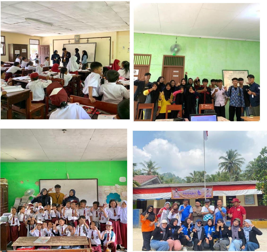
Gambar 2.9 Kegiatan Belajar Mengajar

Pada kegiatan ini selain menjalankan program kerja tentang pendidikan juga sebagai bentuk silaturahmi. Dalam kegiatan ini kami memberikan beberapa materi dan ikut serta dalam perlombaan 17 agustus