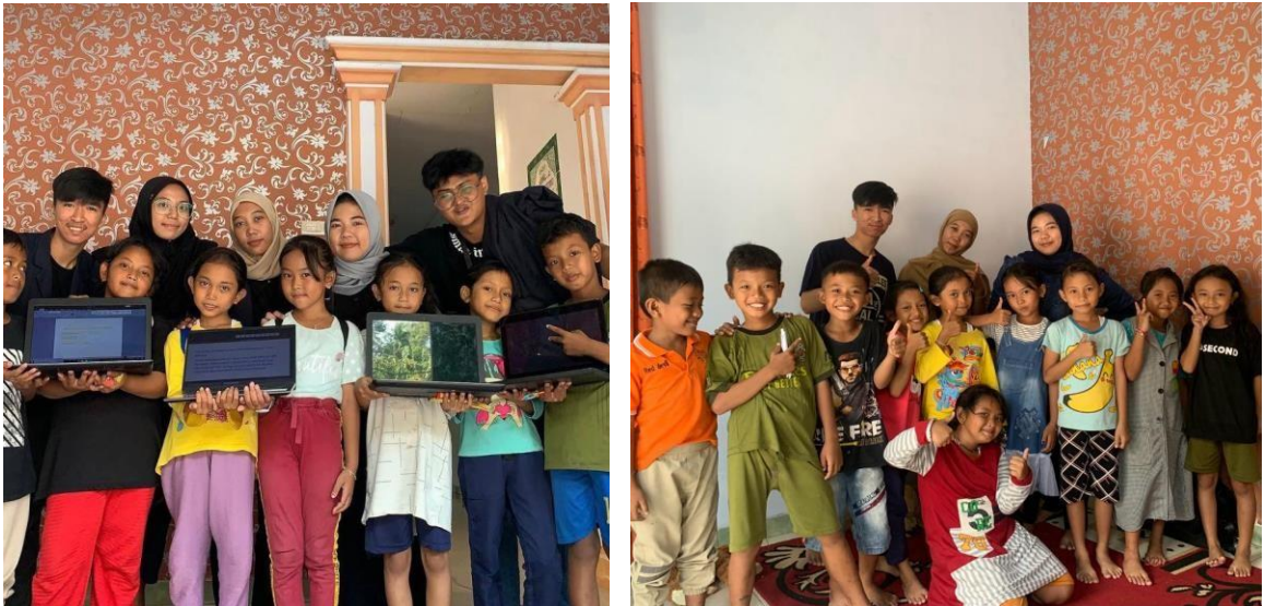
Gambar 2. 10 Bimbel Microsoft Word