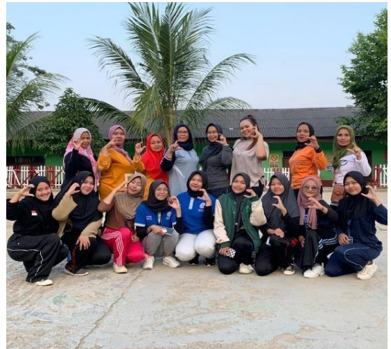
Gambar 2.8 Senam Sore Ibu-Ibu PKK