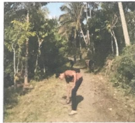
Gambar 2.11. Membantu membersihkan area Dusun Tegal Rejo