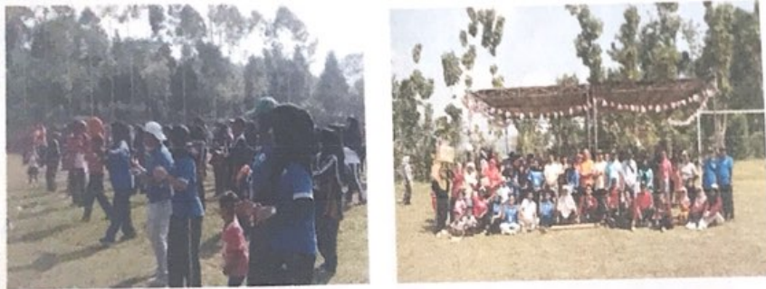
Gambar 2.6. Senam Bersama

Tujuan dari kegiatan ini adalah untuk meningkatkan kebugaran jasmani yang diikuti oleh warga Gunung Rejo yang dilaksanakan di Lapangan depan Balai desa Gunung Rejo pada pukul 08.00 pagi. Yang dihadiri Bapak Kepala Desa beserta Perangkat desa dan diikuti dari kalangan lansia, ibu-ibu, bapak-bapak, remaja, dan anak anak.