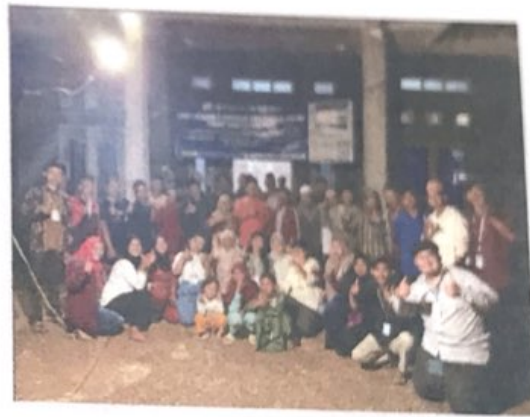
Gambar 2.12. Perpisahan bersama Masyarakat Gunung Rejo