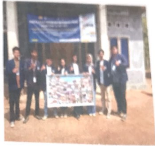
Gambar 2.13. Pemberian Cenderamata Untuk Desa Gunung Rejo