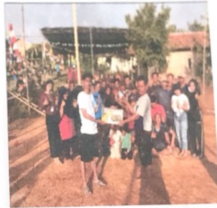
Gambar 2.8. Memberikan Dukungan Fasilitas Volley