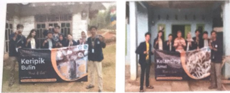
Gambar 2.3. Melakukan Inovasi Branding pada UMKM