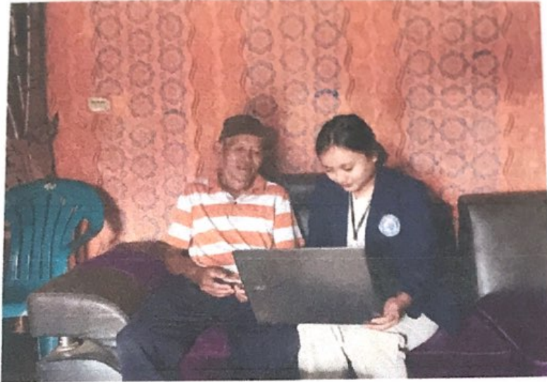
Gambar 2.5. Pembukuan Digital bersama Pemilik UMKM Kelanting Amel