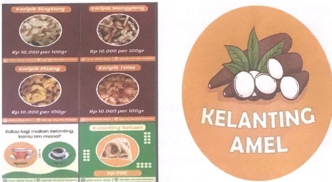
Gambar 2.2. Logo Merek Produk

Berikut ini merupakan Gambar 2.2 dari kartu nama dan banner yang sudah kami serahkan dan kami cetak untuk UMKM.