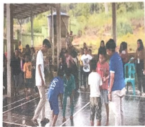
Gambar 2.10. Membantu Acara 17-an di Desa