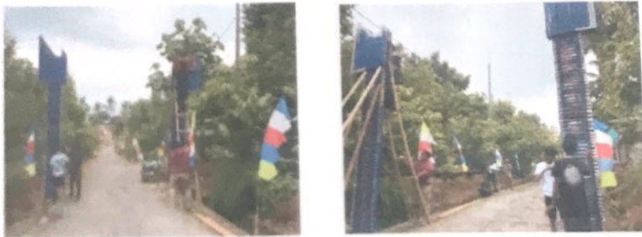
Gambar 2.7. Pembaharuan Gapura Dusun Tegal Rejo

Gapura bukan hanya merupakan bangunan fisik saja namun lebih memiliki fungsi dan arti tersendiri sebagai pintu gerbang maupun tanda batas suatu daerah satu dengan daerah lain. Dengan melihat kondisi gapura sebelumnya yang sudah rusak kami melakukan pembaruan pada Gapura Dusun Tegalrejo yang melibatkan Bapak Kadus, Bapak RT, mahasiswa PKPM Darmajaya dan Bapak-bapak warga dusun Tegalrejo.