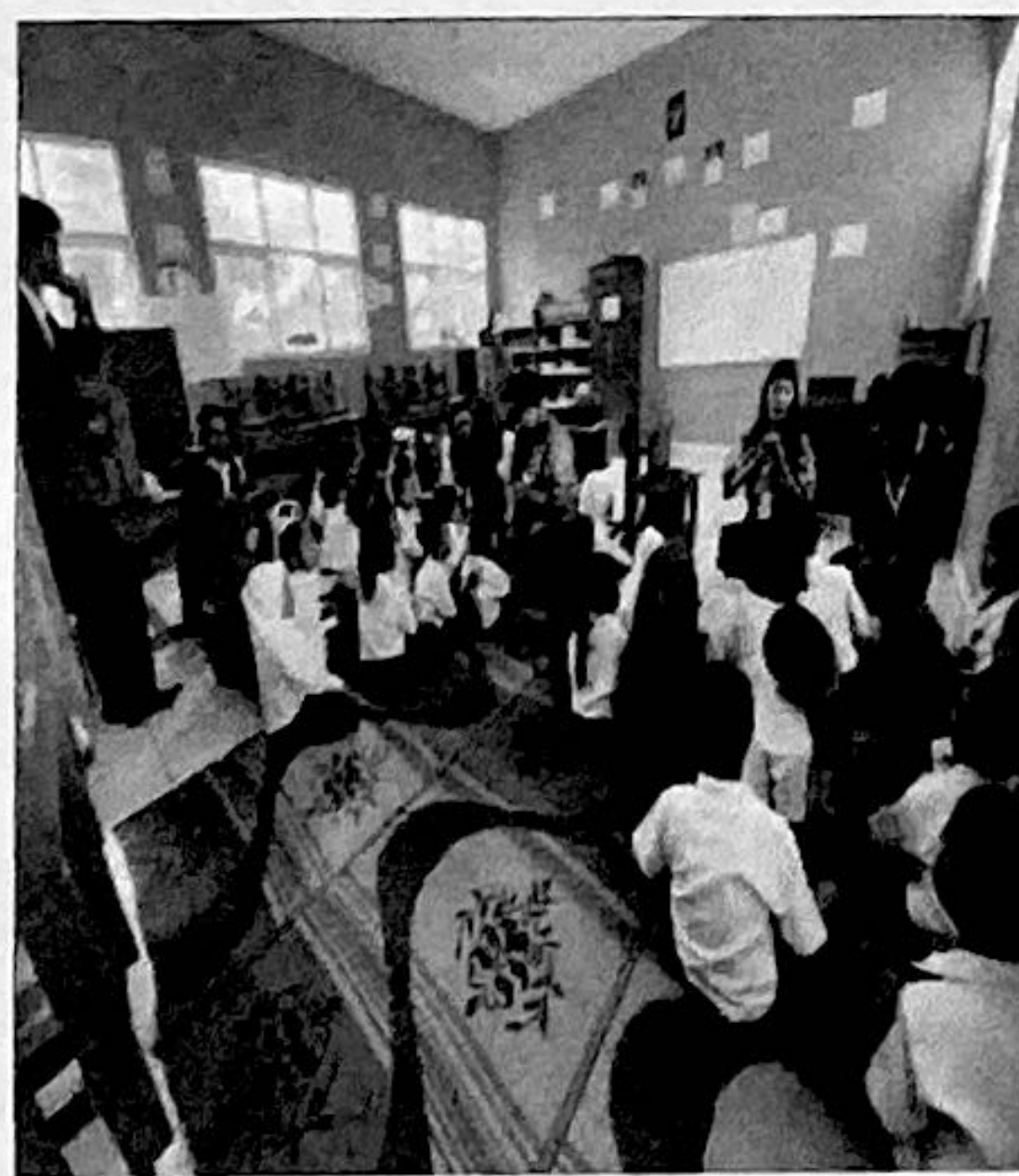
Sosialisasi bahaya gadget di SD