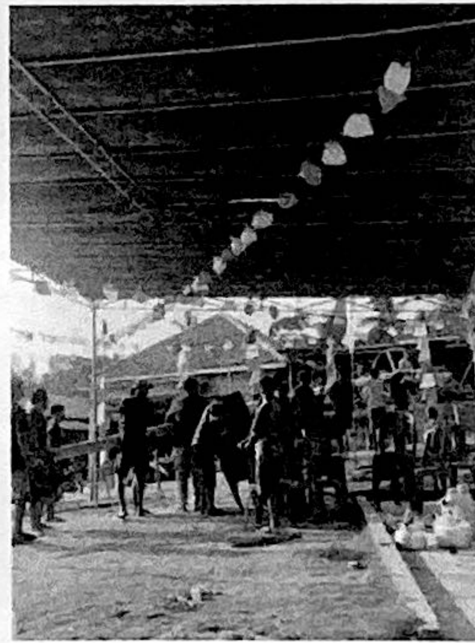
Membantu lomba 17-an