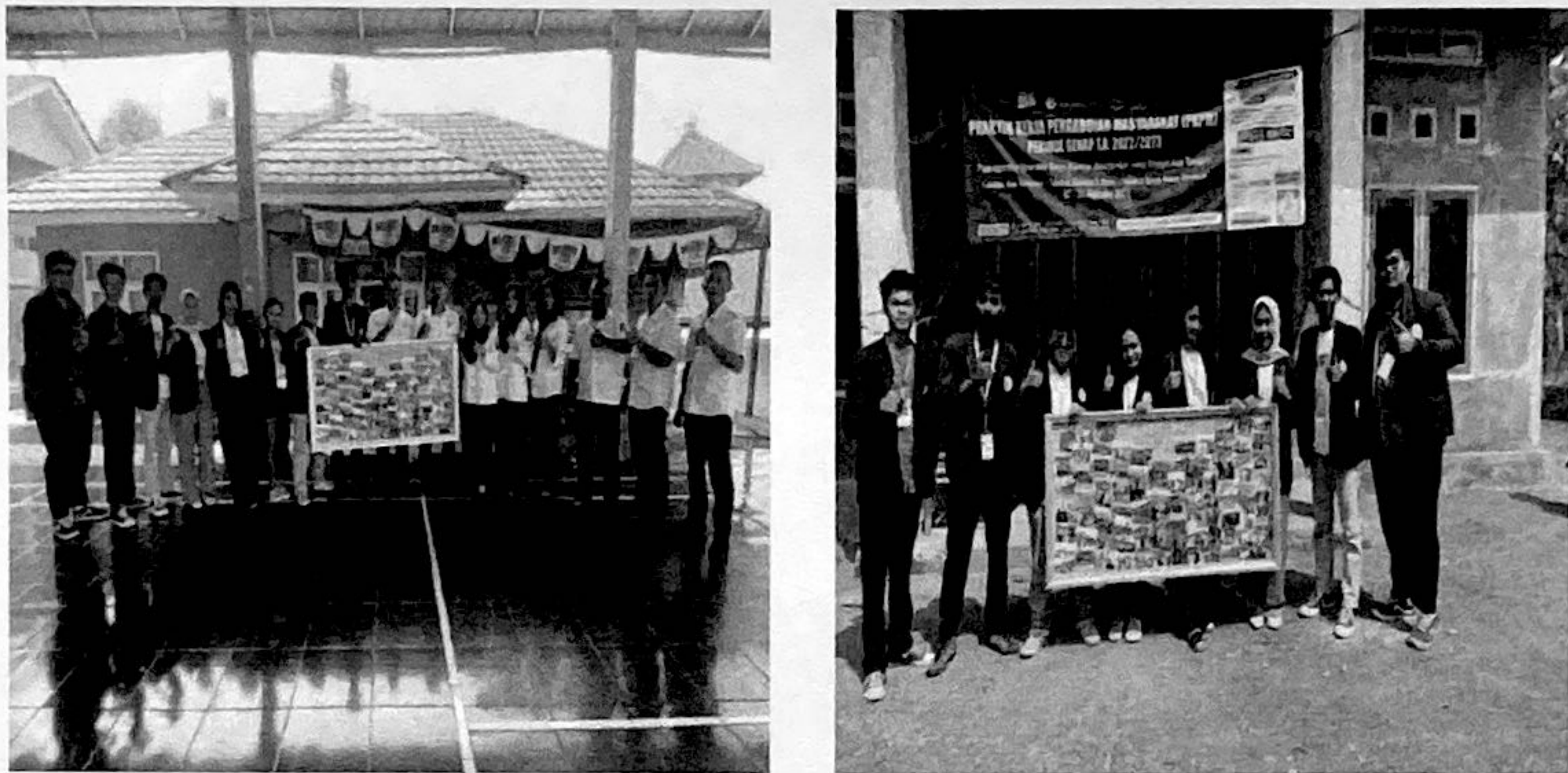
Gambar 2.13. Pemberian Cenderamata Untuk Desa Gunung Rejo