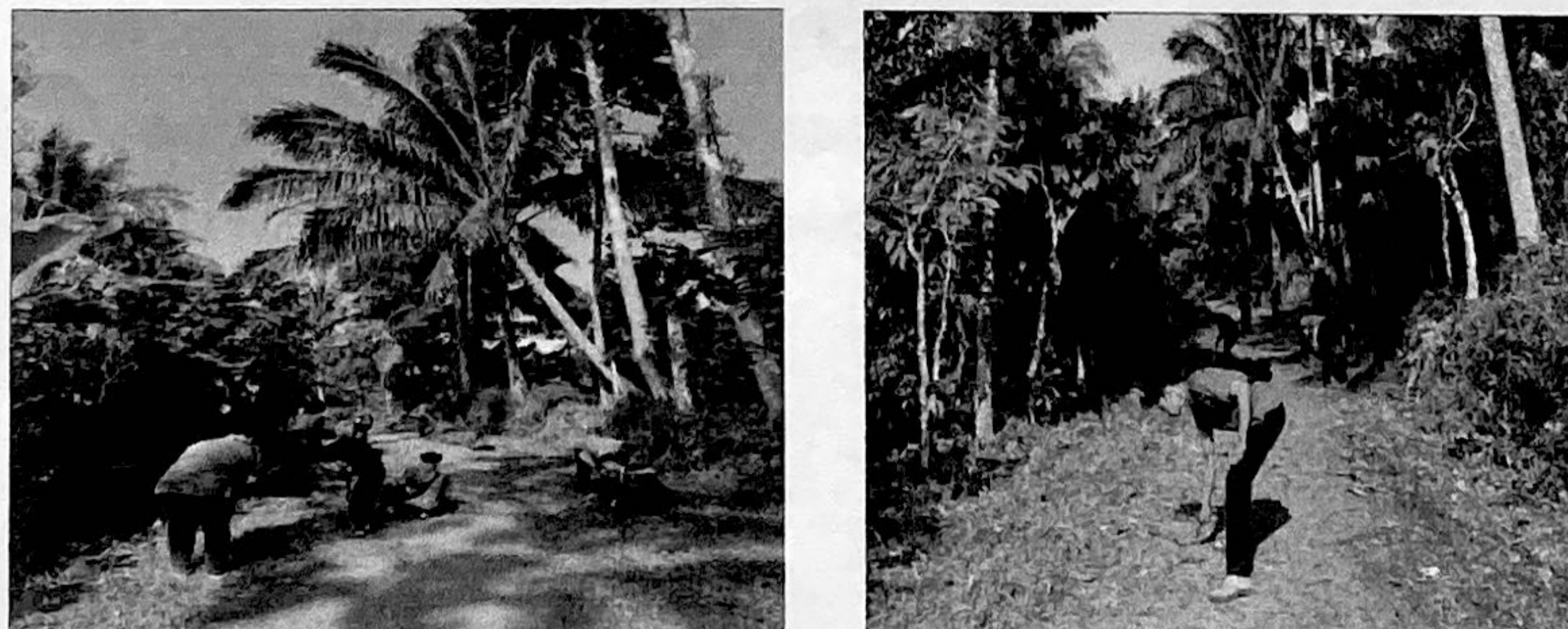
Gambar 2.11. Membantu membersihkan area Dusun Tegal Rejo

Dalam kegiatan ini kami dengan tekun berfokus pada Upaya membersihkan area dusun Tegalrejo, sebagai bagian dari komitmen kami untuk meningkatkan lingkungan setempat. Kami terlibat dalam kegiatan pembersihan, termasuk membersihkan jalan dan lingkungan sekitar dusun Tegalrejo. Upaya ini bertujuan untuk menciptakan lingkungan yang