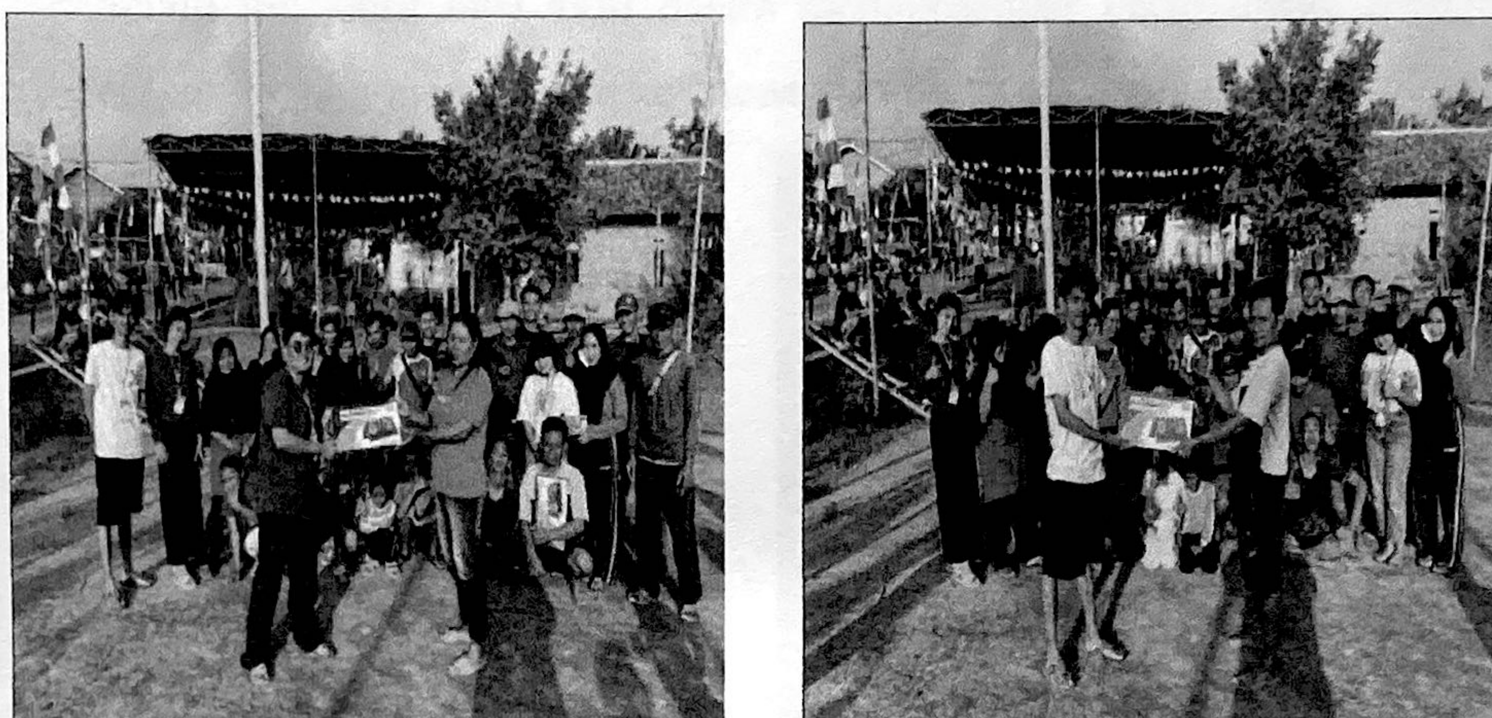
Gambar 2.8. Memberikan Dukungan Fasilitas Volly

Dalam kegiatan ini kami memberikan dukungan terhadap warga yang aktif bermain olahraga volly di dusun Tegalrejo berupa Fasilitas papan score dua buah, agar warga Tegalrejo lebih semangat dalam melakukan kegiatan volly bersama yang biasa dilakukan setiap sore oleh warga dusun Tegalrejo.