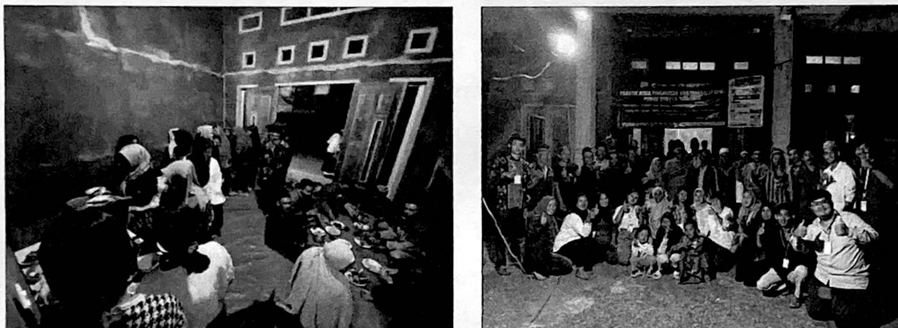
Gambar 2.12. Perpisahan bersama Masyarakat Gunung Rejo

Kegiatan perpisahan menjadi momen penting selama PKPM kami di dusun Tegairejo. Kami berperan dalam mengorganisir dan mendukung berbagai aspek acara perpisahan ini, termasuk pemilihan tema, persiapan dekorasi, dan perencanaan acara. Dengan kerja keras tim, kami dapat menciptakan perpisahan yang berkesan dan penuh makna bagi seluruh warga dusun Tegalrejo.