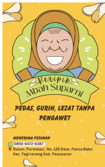
Gambar 2. 4 Brosur/ Poster Media Promosi