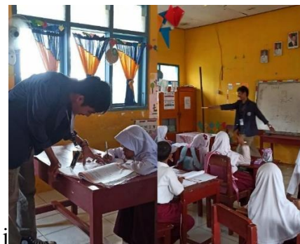
Gambar 2. 8 Belajar Bersama Adik adik SD di Desa Panca Bakti

Kegiatan ini membantu para anak-anak sd kelas 3 dalam belajar karena dengan dilakukannya kegiatan ini adalah mengajarkan anak-anak kelas 3 lebih paham dalam belajar membaca dan menghitung. Sehingga adanya kegiatan ini menghasilkan anak-anak lebih memahami, lancar dalam membaca maupun berhitung