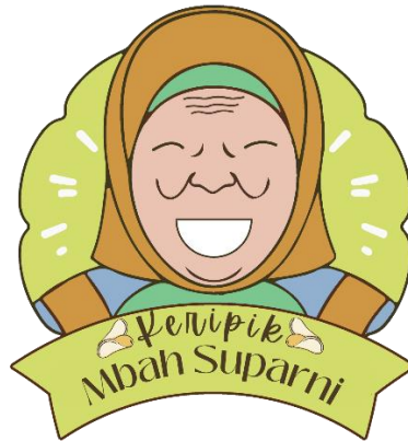
Gambar 2. 2 Digitalisasi Logo

Setelah didapatkan beberapa sketsa logo dan sesuai dengan brand tersebut kami lakukan digitalisasi guna logo yang tadinya di kertas dapat digunakan di manapun brand tersebut melakukan sebuah promosi.