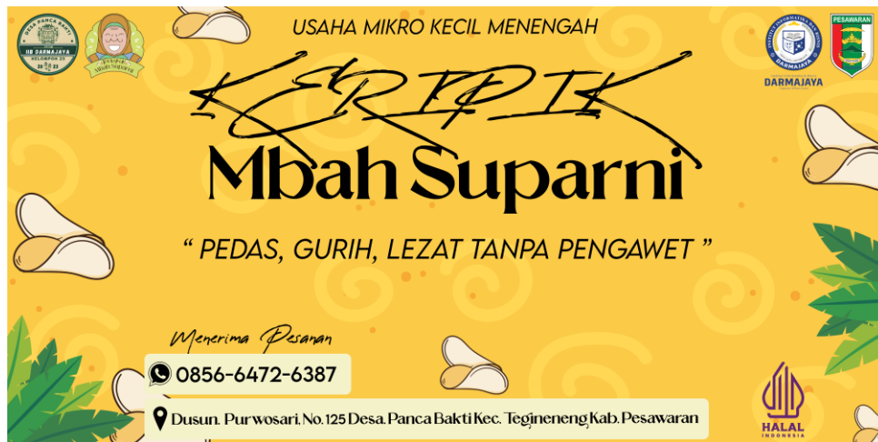
Gambar 2. 3 Media Promosi Banner