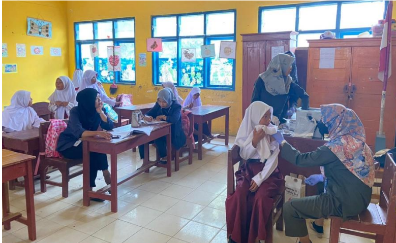
Gambar 2. 9 Kegiatan Imunisasi HPV di Sekolah SD N 11 Tigeneneng

Pelaksanaan Imunisasi HPV bertujuan untuk dapat mencegah/mengobati infeksi virus HPV, vaksin ini sangat bermanfaat untuk mencegah dan menurunkan jumlah kasus kanker genital, terutama kanker SERVIKS. Kegiatan ini di hadiri oleh seluruh siswa SD Kelas 1&6 di Desa Pancabakti