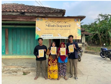
Gambar 2. 7 Pemasangan Media Promosi Banner dan Brosur

Memasang banner dan poster di toko usaha dapat membantu meningkatkan penjualan dan meningkatkan kesadaran merek secara lokal. Pastikan desain dan lokasi pemasangan dipilih dengan cermat untuk mendapatkan hasil terbaik dari kampanye promosi ini.