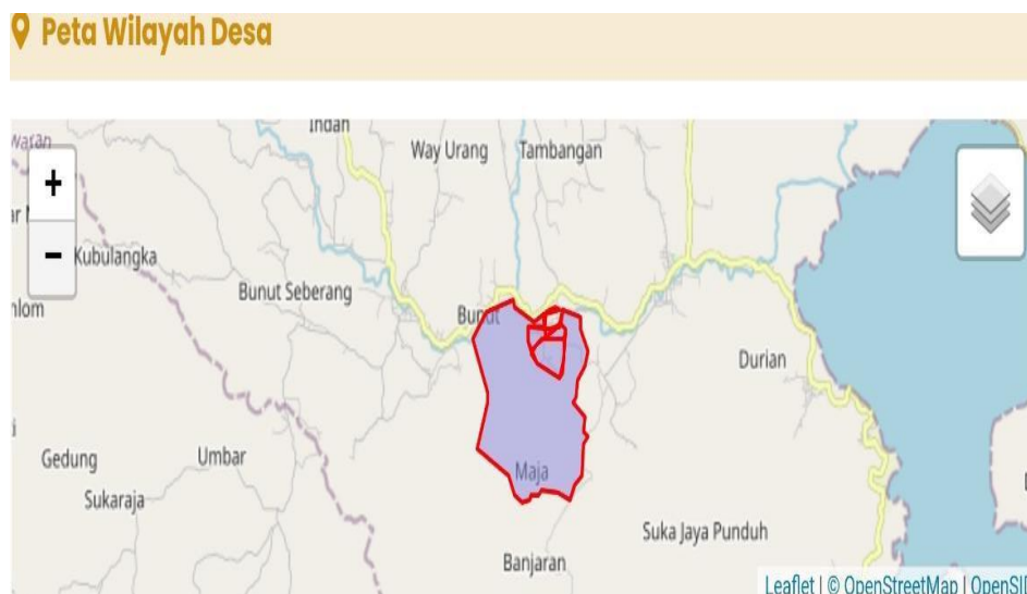
Gambar 1 1 Peta Wilayah Desa Trimulyo

Desa Trimulyo merupakan salah satu dari 12 desa di wilayah Kecamatan Padang cermin, yang terletak kurang lebih 7 km ke arah barat daerah kecamatan, sebelah timur berbatasan dengan Desa Banjaran, sebelah selatan berbatasan dengan hutan register 20 Kabupaten Tanggamus , sebelah barat berbatasan dengan Desa Bunut kecamatan way ratai dan sebelah utara berbatasan dengan sungai way ratai dan Desa Way Urang. Desa Trimulyo awalnya merupakan wilayah hutan rakyat yang dirubah menjadi areal pertanian, persawahan, perkebunan dan pemukiman, Desa Trimulyo di buka menjadi area pemukiman dan produksi pertanian sejak tahun 1936 , saat itu pemeritah Kolonial Belanda menjalankan program pemerataan penduduk dari pulau jawa keluar pulau jawa khususnya sumatera, dengan program kolonisasi maka Lampung adalah wilayah yang menjadi tujuan utama dari tahun 1908. Masyarakat Desa Trimulyo didatangkan dari daerah Jogjakarta,jawa tengah dan jawa timur. Pada tahun 1937 terbentuklah desa pertama yang bernama Banjaran, karena perkembangan kehidupan , perekonomian dan administrasi pemerintahan desa banjaran dimekarkan direvitalisasi menjadi beberapa Desa diantaranya desa Gayau dan Desa Trimulyo. Desa Trimulyo mempunyai luas wilayah 612 Hektare. Sebagian wilayah Desa Trimulyo terdiri dari perbukitan dan persawahan . Ketinggian rata-rata 10– 500 meter di atas permukaan laut.