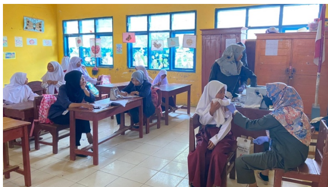
Gambar 2.5 Kegiatan Imunisasi HPVdi SDN 11 Tegineneng

Pelaksanaan Imunisasi HPV bertujuan untuk dapat mencegah/mengobati inveksi virus HPV, vaksin ini sangat bermanfaat untuk mencegah dan menurunkan jumlah kasus kanker genital, terutama kanker SERVIKS. Kegiatan ini di hadiri oleh seluruh siswa SD Kelas 1&6 di Desa Pancabakti