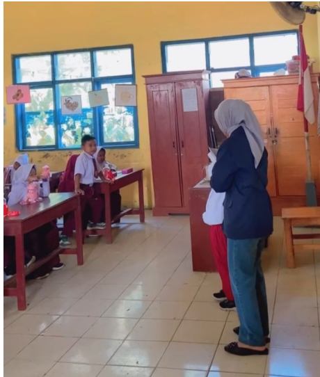
Gambar 2.4 Belajar Bersama di SDN 11 Tegineneng

Kegiatan ini membantu para anak-anak sd kelas 1 dalam belajar karena dengan dilakukanya kegiatan ini adalah mengajarkan anak-anak kelas 1 lebih paham dalam belajar membaca dan menghitung. Sehingga adanya kegiatan ini menghasilkan anak-anak lebih memahami, lancar dalam membaca maupun berhitung.