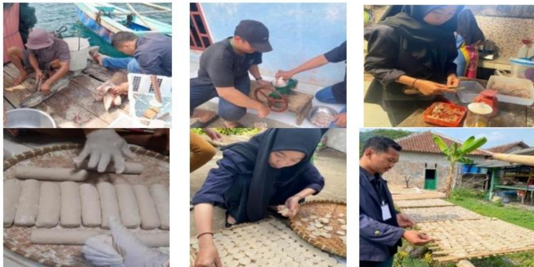
Gambar 2.3 Membantu proses pembuatan kerupuk ikan

Membantu proses produksi kerupuk ikan mulai dari pemotongan dan pembersihan ikan, kemudian penggilingan daging ikan, membuat bumbu untuk pembuatan kerupuk, pembuatan kerupuk, pemotongan dan penyusunan kerupuk sebelum di jemur, dan terakhir proses penjemuran kerupuk di bawah terik matahari agar kerupuk kering dengan sempurna.