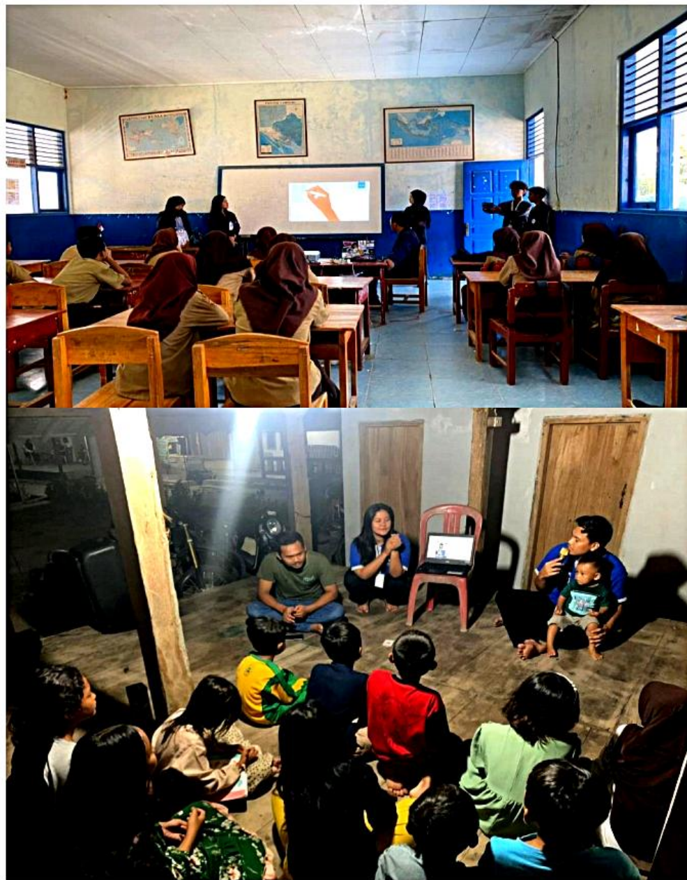
Gambar 2.4 Sosialisasi kepada anak smp dan anak-anak dusun jelarangan

Sosialisasi kepada anak smp tentang bahayanya gadget dan bullying. Serta Sosialisasi kepada anak-anak dusun jelarangan tentang pentingnya menabung sejak dini dan bertata krama yang baik.