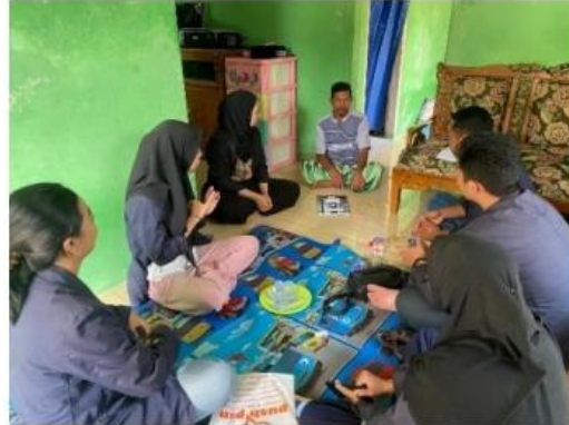
1. Gambar 2.1 Sosialisasi fungsi aplikasi facebook