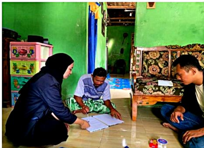
Gambar 2.6 Membantu membuat laporan keuangan

Membantu membuat laporan keuangan menggunakan buku kas dan mencontohkan cara Pencatatan laporan keuangan di buku kas.