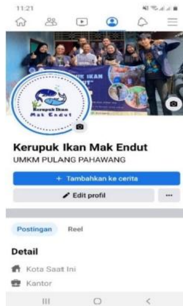
Gambar 2.2 Membantu membuat akun facebook UMKM