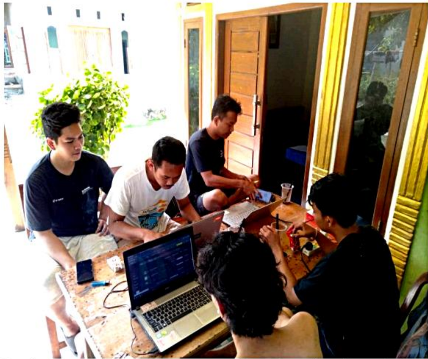
Gambar 2.5 Pembuatan web desa dan memasukkan data-data ke web desa