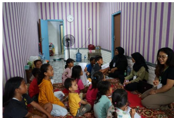
Gambar 2.7 Bimbingan Belajar

Kegiatan Bimbingan belajar merupakan agenda harian dari PKPM IIB darmajaya, kegiatan ini berlangsung di dua dusun desa ketapang barat & ketapang timur. Bimbingan belajar juga difokuskan ke beberapa kurikulum pembelajaran seperti matematika, bahasa indonesia, umum.