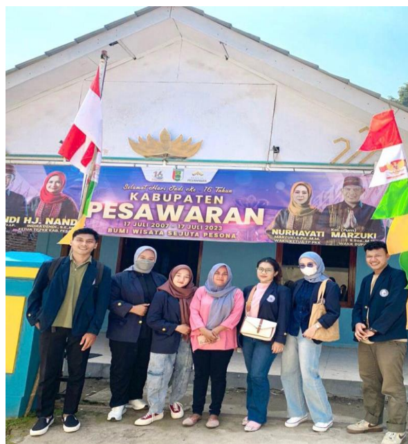
Gambar 2.1 survey balai desa

Agar selama PKPM berlangsung berjalan dengan baik kami semua mengunjungi Balai desa Batu Menyan. Kedatangan saya ke desa Batu Menyan adalah meminta izin kepada aparat desa untuk melaksanakan kegiatan PKPM dan meminta arahan serta dukungan selama pkpm berlangsung.