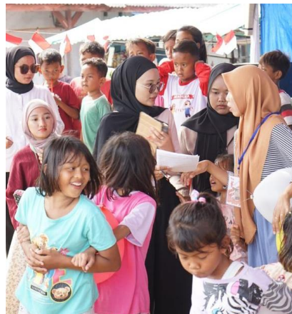
Gambar 2.12 Perayaan Lomba Kemerdekaan

Desa batu menyan mengadakan perayaan kemerdekaan Indonesia dengan mengadakan lomba” yang berlangsung selama kurang lebih 1 minggu, kegiatan ini diikuti oleh seluruh Masyarakat dan mahasiswa/I KKN di desa batu menyan. Kegiatan ini juga menyertakan PKPM IIB Darmajaya sebagai panitia lomba kegiatan kemerdekaan yang berlangsung di desa batu menyan.