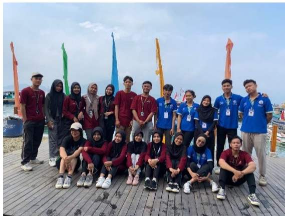
2.9 Kegiatan Senam bersama

Kegiatan senam Bersama merupakan program mingguan dari PKPM IIB Darmajaya yang bertujuan untuk meningkatkan taraf hidup sehat di desa batu menyan, kegiatan ini berlangsung setiap hari jumat pagi / kamis sore, berlangsung selama 1 hingga 2 jam.