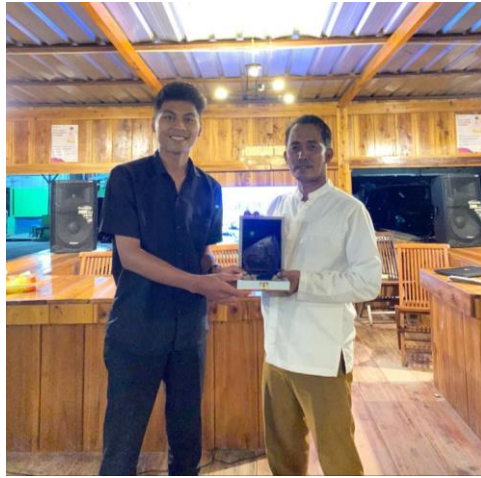
Gambar 2.13 Penyerahan Simbolis