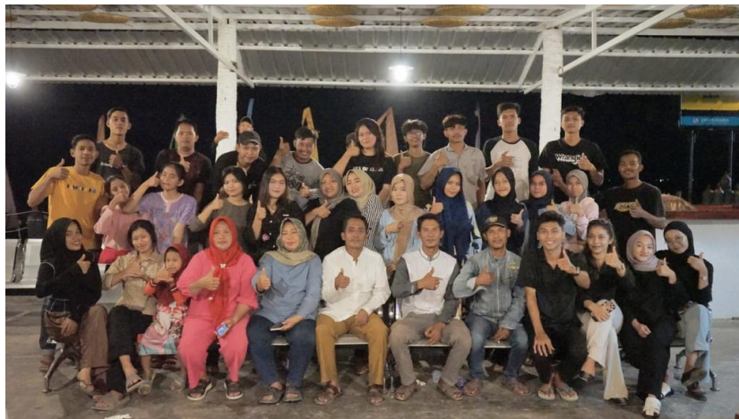
Gambar 2.14 Kegiatan Makan Bersama