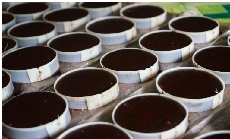
Gambar 2.3 pembuatan Gula Aren

Proses pembuatan Gula Aren yang berbahankan air nira dimana proses tersebut dilakukan dengan memasak air nira tersebut sampai mengental setelah itu dilakukan pencetakan kedalam pencetakan yang telah disediakan sampai akhirnya Gula Aren mengeras dengan sendirinya.