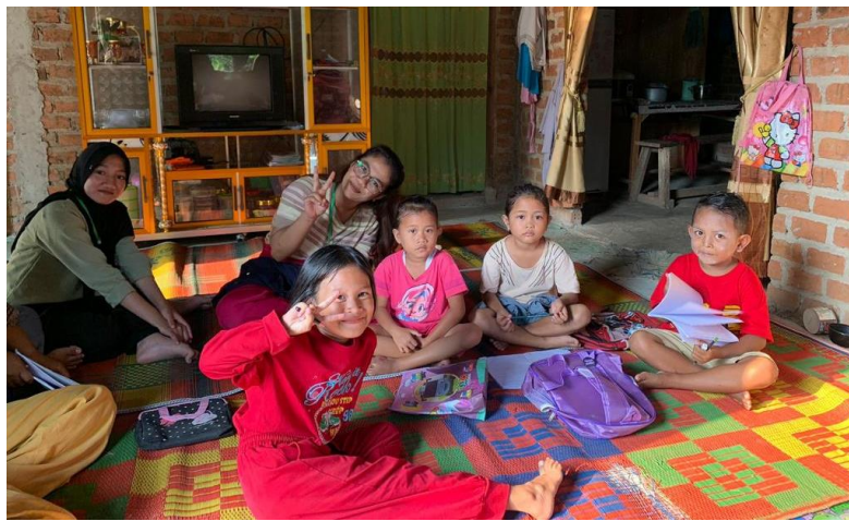
Gambar 2.8 Kegiatan Bina Baca

Kegiatan Bina Baca merupakan Program Kerja harian dari PKPM IIB Darmajaya, kegiatan ini berlangsung setiap hari secara rutin yang difokuskan di desa batu menyan bagian Ketapang barat dan Ketapang timur, kegiatan ini biasanya berlangsung berbarengan dengan kegiatan bimbingan belajar. Kegiatan ini difokuskan kepada siswa/siswi SD kelas ½