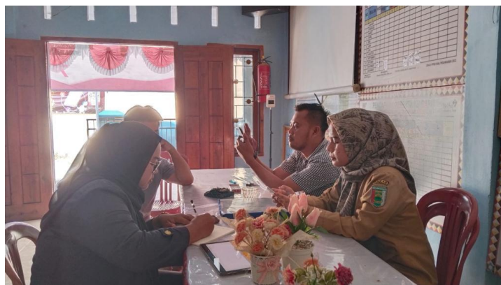
2.11 Pendataan Kependudukan

Kegiatan ini dilakukan sekali di balai desa batu menyan guna mengetahui jumlah populasi di desa batu menyan serta profesi Masyarakat sekitar.