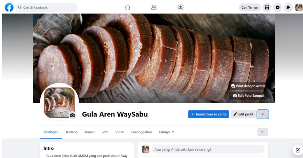
Gambar 2.4 Profil Sosial Media UMKM Gula Aren