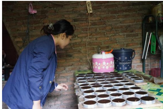
Gambar 2.2 UMKM Gula Aren Sabu