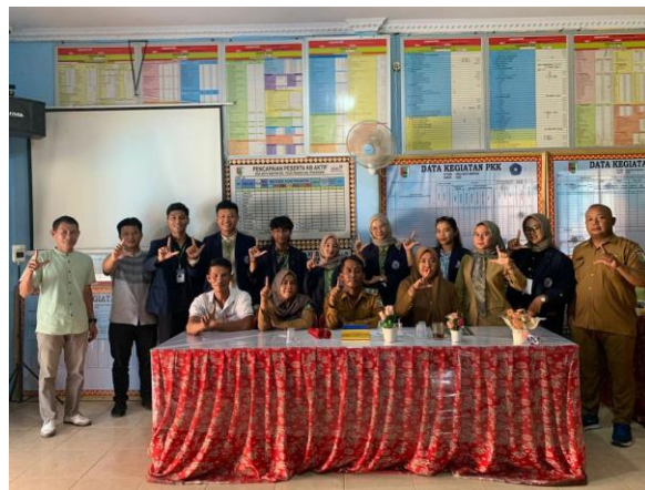
Gambar 2.6 Pemaparan Program Kerja PKPM IIB Darmajaya

Pemaparan program kerja dilakukan tanggal 6 agustus 2023, pemaparan ini dihadiri oleh kepala desa batu menyan, aparatur desa batu menyan, BUMDES, Masyarakat desa batu menyan. Pemaparan ini berguna untuk menjelaskan program” apa yang akan dilakukan sekaligus meminta izin untuk melakukan program” di desa batu menyan.