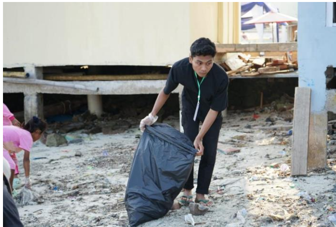
2.10 Kegiatan Bersih Pantai

Kegiatan bersih Pantai merupakan kegiatan yang rutin dilakukan setiap jumat pagi guna menjaga kelestarian Pantai di desa batu menyan, diikuti oleh mahasiswa/I kkn di desa batu menyan serta Masyarakat desa batu menyan.