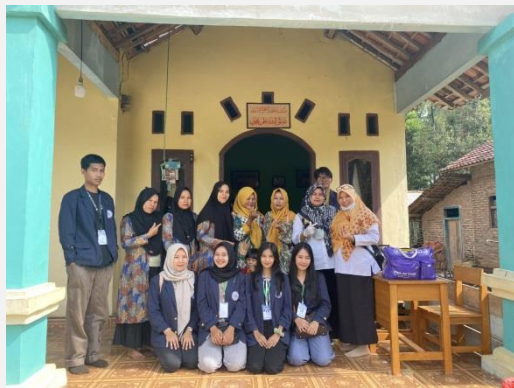
Sosialisasi Edukasi ECO Print