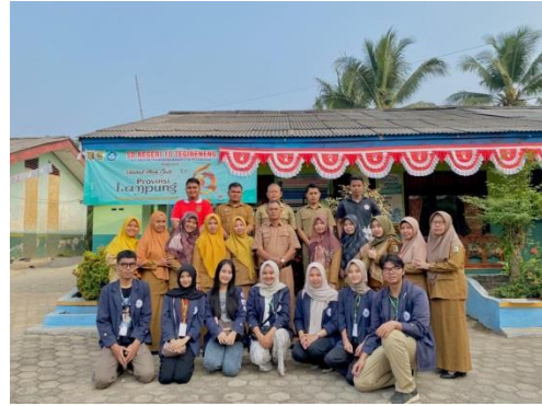
Pemberian Sertifikat Kerjasama kepada SDN 10 Tegineneng