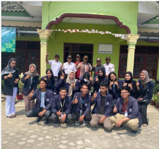
Penyerahan Cenderamata kepada Desa