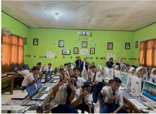
Sosialisasi Pelatihan Microsoft Office Power Point dan Hyperlink di SMPN 15 Pesawaran