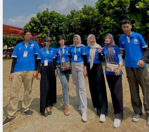
Logo UMKM Tempe Om Santo