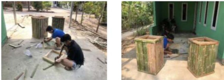
Gambar2.9Proses pembuatan bank sampah

Pembuatan bank sampah ini agar masyarakat lebih paham dengan budaya hidup sehat dengan membuang sampah pada tempatnya.