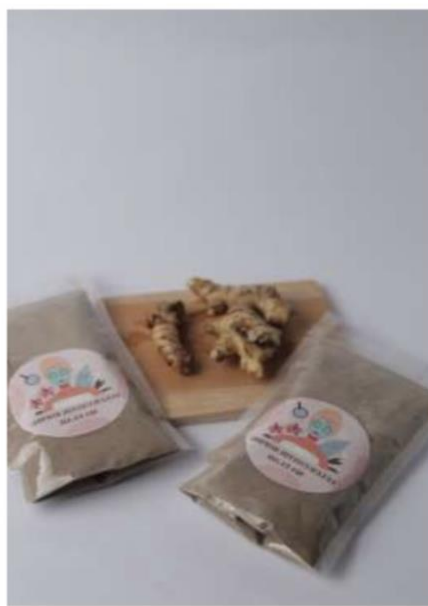
Gambar 2.1 Proses pembuatan Lulur.