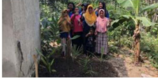
Gambar2.8 Pembuatan Apotik Hidup

Bertujuan untuk penghjau lingkungan tanaman juga dapat dimanfaatkan sebagai obat.