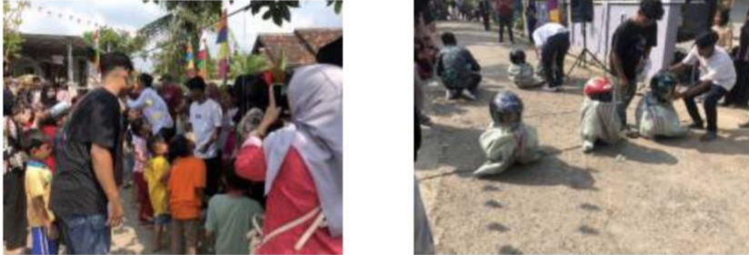
Gambar2.7panitia acara HUT RI

Ikut serta dalam menjadi panitia acara HUT RI 17 agustus desa kota jawa