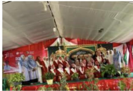
Gambar 2.5 mendampingi Ibu-ibu lomba antar dusun Lomba Marawis, sambung ayat & memandikan jenazah dalam rangka memperingati Bulan Muharam serta HUT RI.