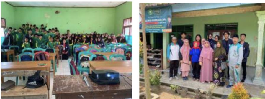
Gambar 2.4 sosialisasi ke sekolah