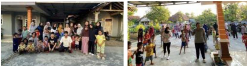
Gambar 2.6 Senam bersama ibu-ibu

Kegiatan Senam Bersama dengan Ibu-Ibu Dusun 8 dan Kelompok 30 yang dilakukan setiap hari Rabu dan Sabtu sore jam 16.00 PM Untuk meningkatkan Solidaritas Kemasyarakatan warga dengan mahasiswa PKPM