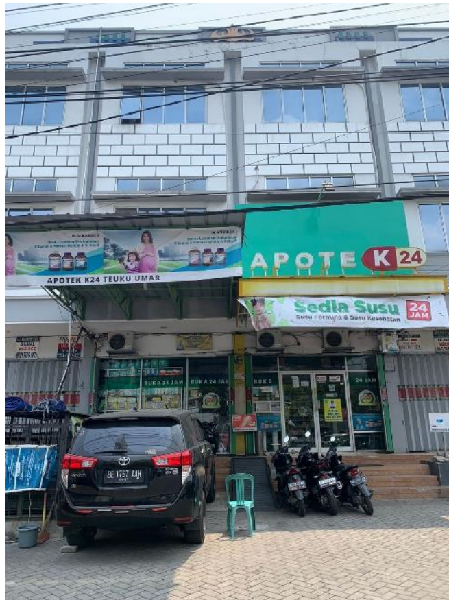
Gambar 2.1 Bangunan Apotek K24 Teuku Umar

Jalan Teuku Umar No 3C-D, Sidodadi, Kec. Kedaton, Kota Bandar Lampung.