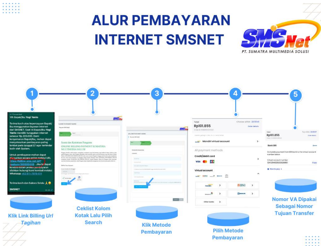
Gambar 4.2 Alur Pembayaran Tagihan Internet Sebelum

Pada saat ini Perusahaan sedang berusaha untuk mencari kesalahan yang terjadi pada system pembayaran broadcast whatsapp melalui ERP (Enterprise Resource Planning), agar meminimalisir kesalahan yang akan terjadi masa mendatang.