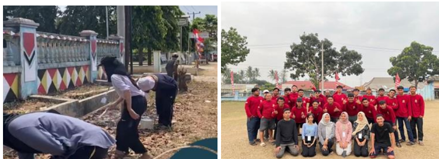
Gambar 2.4 Memasang patok jalan dan berpartisipasi dalam kegiatan lomba HUT RI

Kegiatan seperti membantu warga dalam memasang patok jalan dan berpartisipasi dalam kegiatan lomba 17 Agustus.