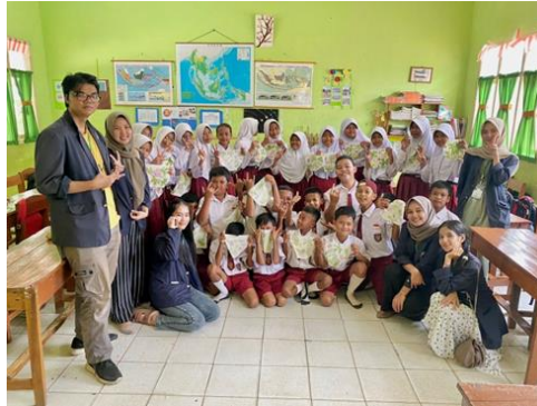
Gambar 2.6 Edukasi EcoPrint

Ecoprint dapat diartikan sebagai teknik mencetak pada kain dengan menggunakan pewarna alami dan membuat motif dari daun secara manual yaitu dengan cara ditempel sampai timbul motif pada kain. Edukasi Ecoprint di SDN 10 Tegineneng membantu anak-anak untuk menjadi lebih kreatif.