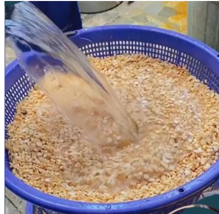
Gambar 1.5 Proses Perendaman Kedelai Gambar 1.6 Proses Pencucian Kedelai