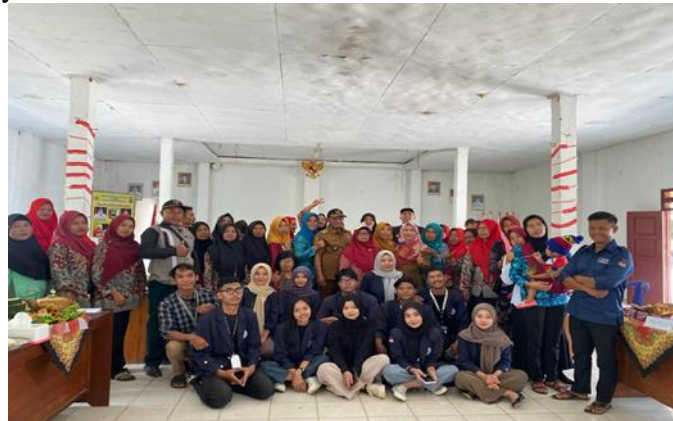
Gambar 2.2 Lomba Tumpeng antar Dusun

Kegiatan ini membantu ibu-ibu PKK desa Trimulyo dalam rangka memperingati hari kemerdekaan dengan lomba tumpeng antar dusun yang diselenggarakan oleh Desa Trimulyo.