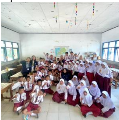
Gambar 2.5 Sosialisasi Gemar Menabung Sejak Dini di SDN 10 Tegineneng

Pentingnya menabung sejak dini tidak hanya akan membantu dalam mengelola uang untuk masa depan, tetapi juga membentuk kebiasaan baik secara terus menerus ketika sudah dewasa, bekerja, bahkan berkeluarga. Menabung sejak dini tidak hanya bermanfaat untuk mengelola keuangan di masa depan, tetapi juga bisa membentuk kebiasaan-kebiasaan baik kepada anak-anak.