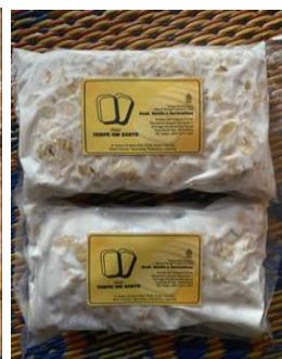
Gambar 1.9 Proses Penirisan & Peragian Kedelai Gambar 1.10 Proses Packaging Kedelai menjadi Tempe