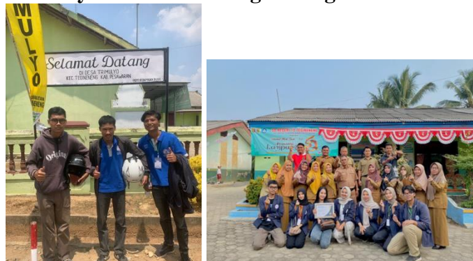
Gambar 2.8 Memberikan Cindramata dan Sertifikat Ucapan Terimakasih