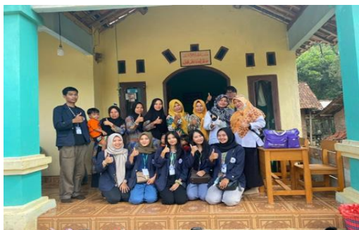
Gambar 2.3 Kegiatan Posyandu