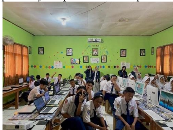
Gambar 2.7 Sosialisasi Edukasi Pentingnya Microsoft PowerPoint

Sosialisasi ini dilakukan untuk memberikan edukasi terhadap siswa kelas 9 SMPN 15 Pesawaran yang akan menempuh pendidikan tingkat SMA dengan tujuan sebagai bekal kemudahan dalam pembelajaran presentasi kelompok maupun individu.