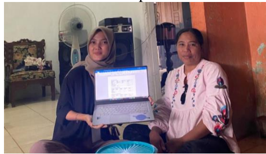
Gambar 1.4 Sosialisasi tentang Pembuatan Laporan Pendapatan dan Pengeluaran

Mengoptimalkan biaya produksi antara pendapatan dan pengeluaran merupakan salah satu strategi yang umum dilakukan oleh perusahaan untuk menurunkan anggaran pengeluaran. Maka dari itu, saya melakukan pelatihan mengenai pencatatan serta perhitungan untuk pendapatan dan pengeluaran di UMKM Tempe Om Santo.