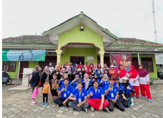
Gambar 2.1 Senam Jantung Sehat

Senam jantung sehat adalah suatu kegiatan olah raga jasmani yang dilakukan dalam durasi waktu 30 menit. Melalui kegiatan diharapkan dapat secara rutin untuk melakukan senam jantung.