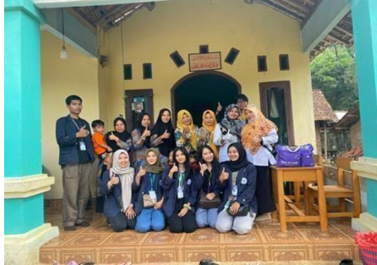
Gambar 2.3 Kegiatan Posyandu

Kegiatan Posyandu dilakukan untuk mengetahui tumbuh kembang balita yang terdapat di Dusun Ogan I, Desa Trimulyo untuk mengetahui dan mencegah terjadinya stunting pada balita.