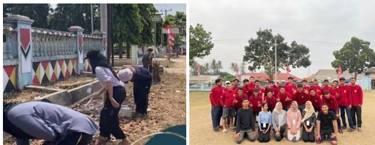
Gambar 2.4 Memasang patok jalan dan berpartisipasi dalam kegiatan lomba HUT RI

Kegiatan seperti membantu warga dalam memasang patok jalan dan berpartisipasi dalam kegiatan lomba 17 Agustus.