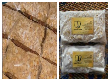
Gambar 1.10 Proses Packaging Kedelai menjadi Tempe