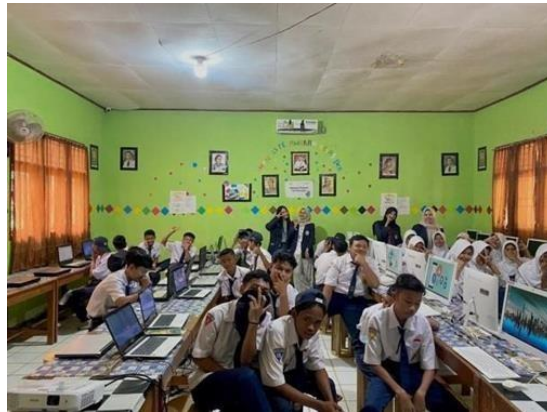
Gambar 2.7 Sosialisasi Edukasi Pentingnya Microsoft Power Point

Sosialisasi ini dilakukan untuk memberikan edukasi terhadap siswa kelas 9 SMPN 15 Pesawaran yang akan menempuh pendidikan tingkat SMA dengan tujuan sebagai bekal kemudahan dalam pembelajaran presentasi kelompok maupun individu.