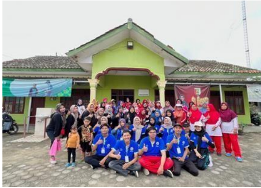
Gambar 2.1 Senam Jantung Sehat

Senam jantung sehat adalah suatu kegiatan olah raga jasmani yang dilakukan dalam durasi waktu 30 menit. Melalui kegiatan diharapkan dapat secara rutin untuk melakukan senam jantung.