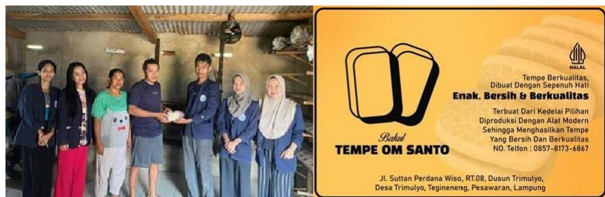
Gambar 1.3 Menyerahkan Logo serta Stiker kepada pemilik UMKM

Brand identity adalah aspek branding yang berfokus pada kepribadian dan identitas dari suatu brand. Brand identity juga mengacu pada value atau nilai. Branding identity mencakup logo, tipografi, warna, kemasan, dan pengirimanpesan. Manfaat identitas brand dalam suatu usaha dalah meningkatkan jumlahprofit. Ketika perusahaan memiliki brand identity yang kuat, biasanya pelanggan akan loyal dan muncul pelanggan yang baru. Semakin banyak pelanggan yang membeli produk perusahaan, maka semakin meningkat pula profitnya. Oleh karena itu kami berinovasi membuat logo untuk membantu UMKM Tempe Om Santo guna meningkatkan pendapatan serta membuat produk dikenal banyak oleh konsumen serta dapat dijadikan sebagai media pemasaran untuk lebih memperkenalkan UMKM Tempe Om Santo agar lebihdiketahui banyak orang.