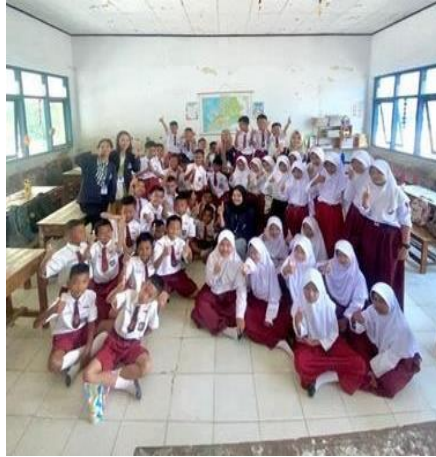
Gambar 2.5 Sosialisasi Gemar Menabung Sejak Dini di SDN 10 Tegineneng