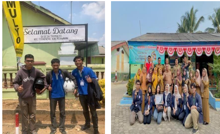
Gambar 2.8 Memberikan Cindramata dan Sertifikat Ucapan Terimakasih