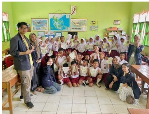
Gambar 2.6 Edukasi Ecoprint

Ecoprint dapat diartikan sebagai teknik mencetak pada kain dengan menggunakan pewarna alami dan membuat motif dari daun secara manual yaitu dengan cara ditempel sampai timbul motif pada kain. Edukasi Ecoprint di SDN 10 Tegineneng membantu anak-anak untuk menjadi lebih kreatif.