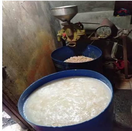
Gambar 1.5 Proses Perendaman Kedelai

Tahapan pembuatan tempe meliputi perendaman, penggilingan, pencucian, perebusan, pendinginan, penambahan ragi, pengemasan dan fermentasi. Pada masing- masing tahapan memiliki tujuan yang berbeda-beda. Setiap tahapan akan memicu proses fermentasi yang terjadi pada tempe kedelai dan tempe kacang merah.