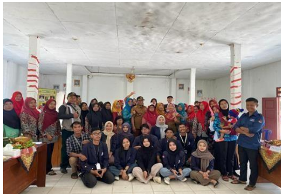
Gambar 2.2 Lomba Tumpeng Antar Dusun

Kegiatan ini membantu ibu-ibu PKK desa Trimulyo dalam rangka memperingati hari kemerdekaan dengan lomba tumpeng antar dusun yang diselenggarakan oleh Desa Trimulyo.