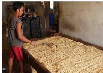
Gambar 1.9 Proses Penirisan & Peragian Kedelai