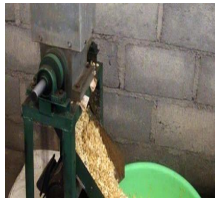
Gambar 1.8 Proses Penggilingan Kedelai