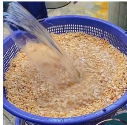
Gambar 1.6 Proses Pencucian Kedelai