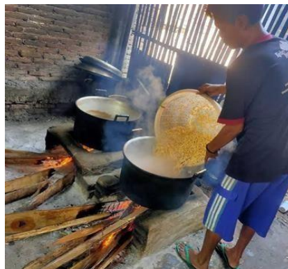
Gambar 1.7 Proses Perebusan Kedelai