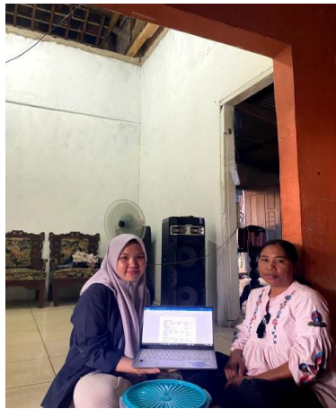
Gambar 1.2 Penerapan Pembuatan Anggaran untuk UMKM

Penyusunan anggaran yang baik terbukti merupakan hal yang menyulitkan bagi perusahaan, karena berdasarkan penelitian ternyata banyak pihak dalam perusahaan yang merasa kurang puas terhadap hasil anggaran. Anggaran bagian HR merupakan salah satu anggaran yang sulit untuk dibuat, dan ada kecenderungan untuk menyusun anggaran hanya berdasarkan angka-angka tahun lalu yang disesuaikan, dan kemudian keberhasilannya hanya dilihat dari tercapai atau tidaknya jumlah orang yang dikirim dalam program Workshop Hal-hal tersebut sebenarnya merupakan cara yang salah dalam menyusun dan mengendalikan anggaran.