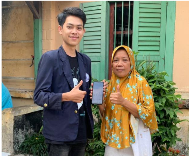
Gambar 1.1 Pembuatan Akun Media Sosial