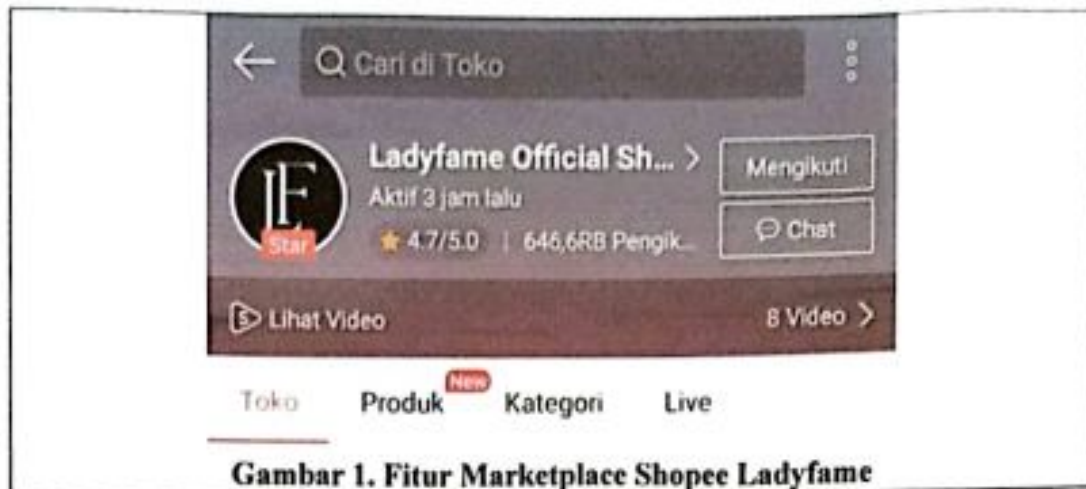
Gambar 1. Fitur Marketplace Shopee Ladyfame