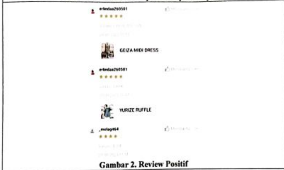
Gambar 2. Review Positif