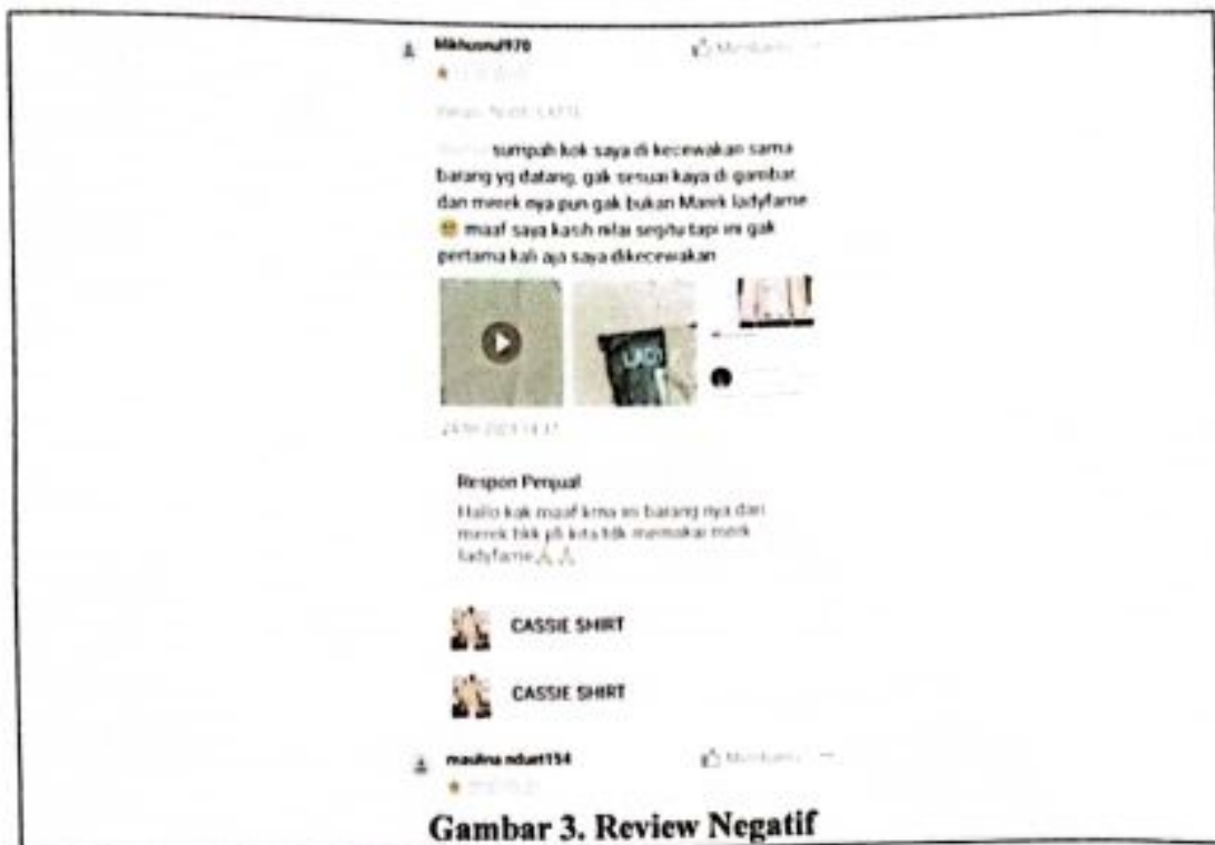
Gambar 3. Review Negatif