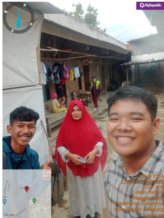
Gambar 3 2 Kunjungan ke pelanggan