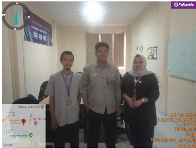
Gambar 3.1 Kunjungan ke Kantor Myrepublic Lampung