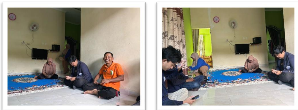
Gambar 2. 11 Silaturahmi Ibu Kades Dan Perkenalan Karang Taruna