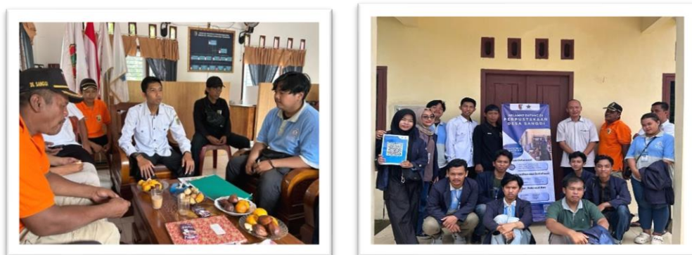
Gambar 2. 15 Pemaparan Program Kerja Serta Perpisahan Dengan Aparat Desa

Pemaparan Program Kerja Serta Perpisahan Dengan Aparat Desa