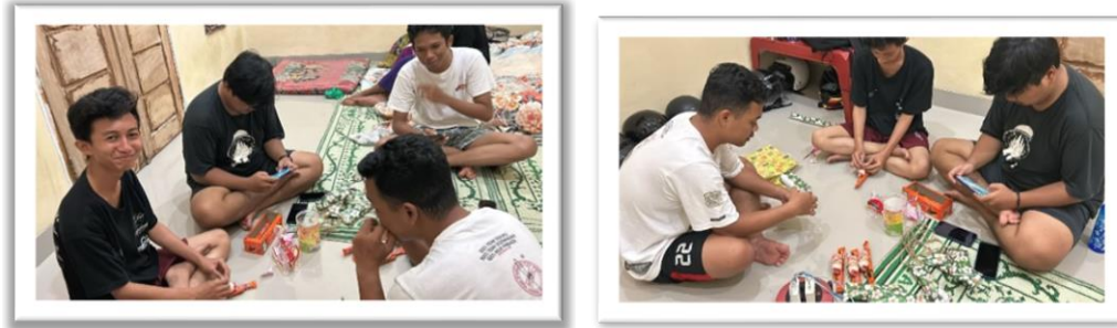
Gambar 2. 12 Membuat Hadiah Untuk Sosialisasi Ke SDN 14 Padang Cermin