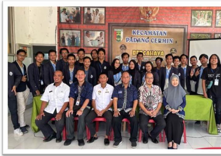
Gambar 2. 16 Penarikan dan Presentasi Akhir Hasil Kerja di Kecamatan Padang Cermin

Penarikan dan Presentasi Akhir hasil kerja di kecamatan