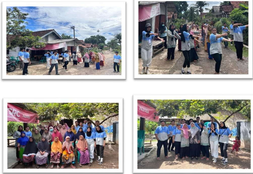
Gambar 2. 6 mengikuti posyandu lansia dan senam bersma ibu-ibu desa sanggi

Mengikuti Dan Membantu Posyandu Lansia Dan Senam Bersama Ibu-Ibu Di Desa Sanggi Piabung Guna Menjaga Kesehatan Dan Juga Mempererat Silaturahmi Antara Mahasiswa Dan Warga Desa.