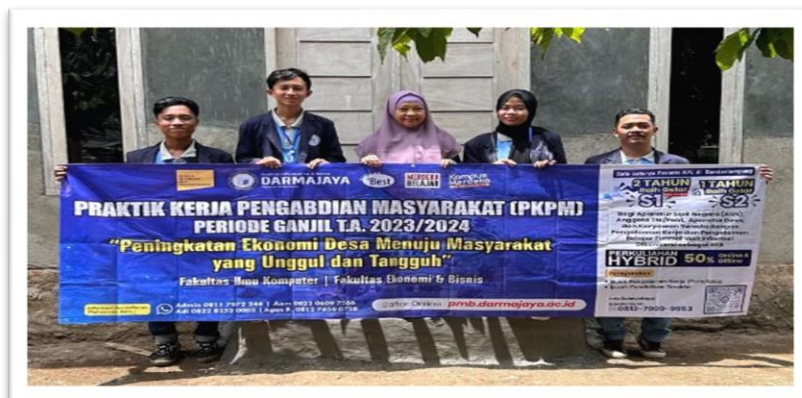
Gambar 2. 5 bersama ibu pembimbing lapangan di posko

Kunjungan hari pertama kedatangan mahasiswa pkpm dan ibu dosen pembimbing lapangan ke posko.