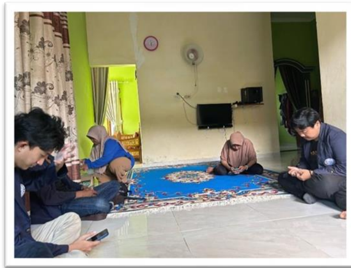
Gambar 2. 1 Sosialisasi Pada Pemilik UMKM

Sosialisasi kepada pemilik UMKM sebagaimana mengoptimalkan penjualan produk Kopi Mangrove Desa Sanggi