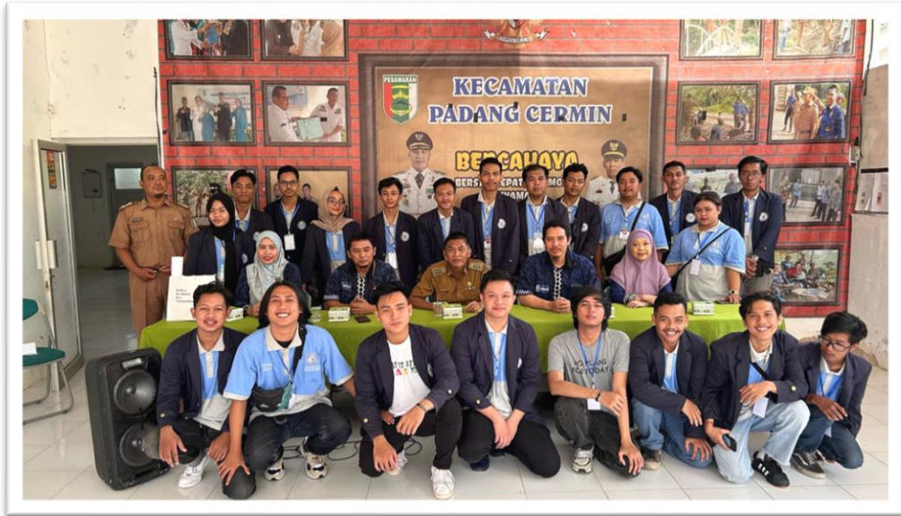
Gambar 2. 4 penyambutan mahasiswa PKPM di kecamatan padang cermin

Keberangkatan dan penyambutan mahasiswa PKPM di kecamatan padang cermin .sekaligus kami melakukan perkenalan kepada aparaturnya untuk kami melaksanakan kegiatan pengabdian dari tanggal 5 februari – 29 Februari 2024