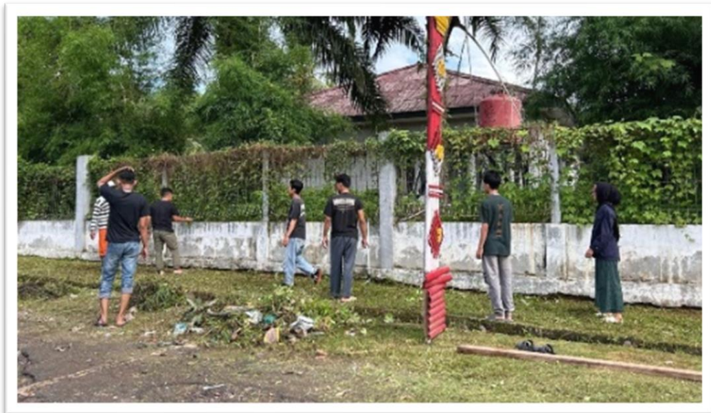
Gambar 2. 9 Kegiatan Gotong Royong