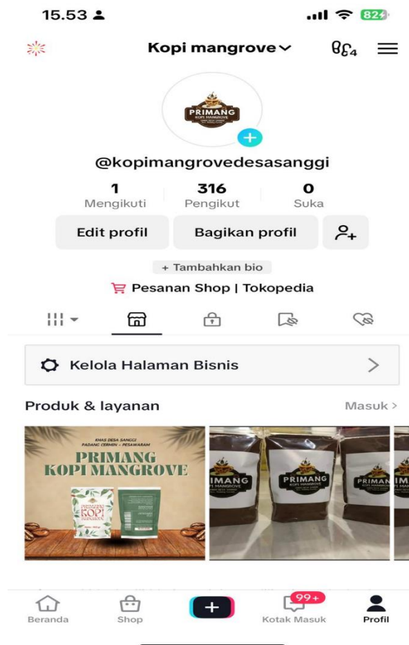
Gambar 2.3 Pemasaran melalui Aplikasi Media Sosial