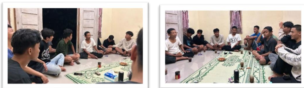
Gambar 2. 7 perkenalan dan kunjungan pemuda-pemuda desa sanggi di posko

Perkenalan Dan Kunjungan Pemuda-Pemuda Desa Sanggi Di Posko Agar Mempererat Silaturahmi Antara Mahasiswa Dan Pemuda Desa.