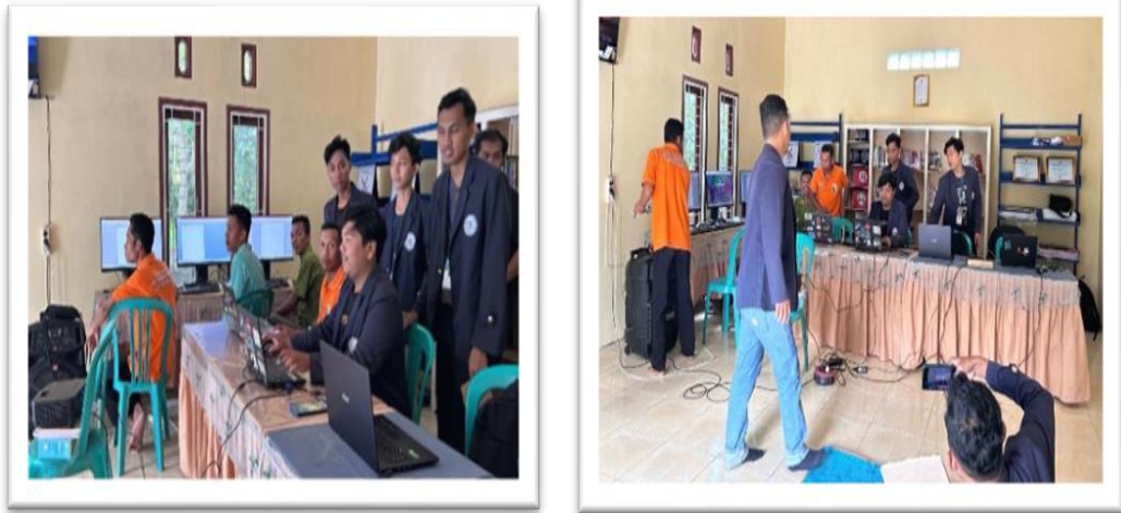
Gambar 2. 10 Pelatihan Ms.Word