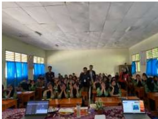
Gambar 2.4 Foto bersama siswa SMP