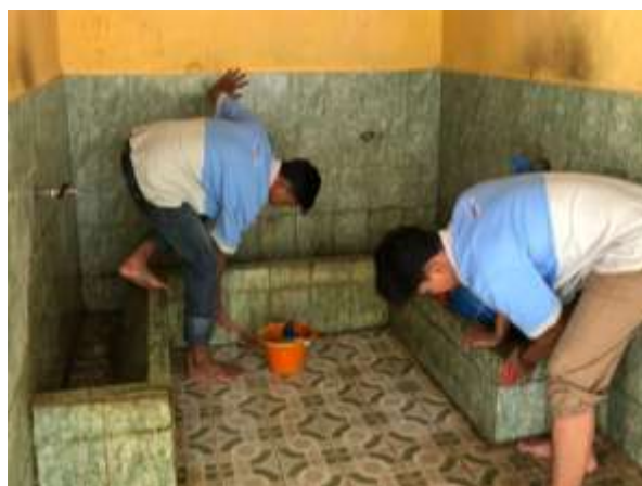
Gambar 2.5 Bersih-bersih masjid

Pada program ini kami menjalankan giat bersih-bersih masjid yang kami lakukan pada tanggal 23 Februari 2024 yang lakukan di masjid Nurul Iman dusun I. kegiatan ini dilakukan bertujuan untuk meningkatkan solidaritas, menjaga kebersihan, mendorong untuk lebih bekerja sama dalam berbagai kegiatan, menumbuhkan sikap saling tolong menolong dan membuat masyarakat yang hendak melaksanakan peribadahan maupun kegiatan keagamaan lainnya dapat merasa aman dan nyaman serta lebih khusyu dalam beribadah. Kegiatan yang kami lakukan yaitu mulai dari membersihkan bagian dalam masjid , membersihkan ambal dan membersihkan kamar mandi seta tempat wudhu.