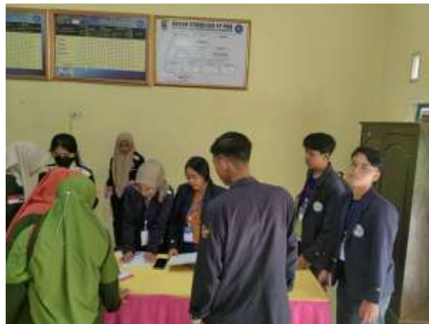
Gambar 2.11 kegiatan sosialisasi malaria

Membantu kegiatan posyandu lansia di Desa Sidodasi dengan membantu pendataan warga lansia lalu mengkoordinir warga yang datang untuk melakukan pengecekan kesehatan dan membantu pencatatan hasil pengecekan kesehatan.