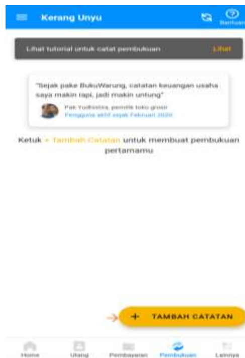
Gambar 2.6 menambah catatan pembukuan