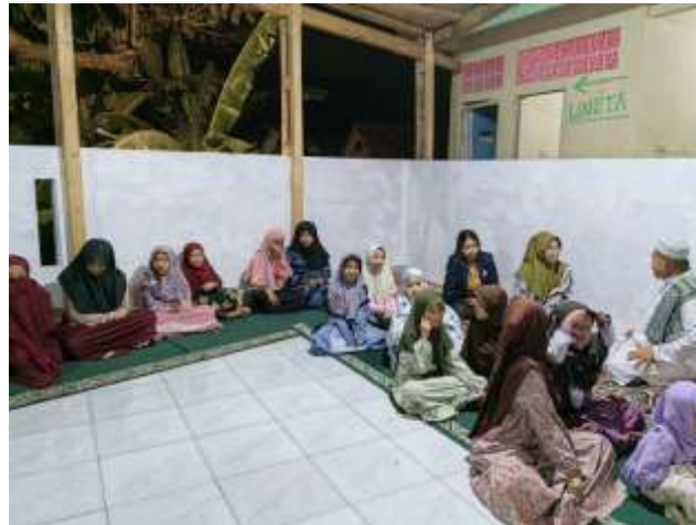
Gambar 2.14 menghadiri khatam qur'an

Ikut menghadiri acara khataman qur'an anak-anak di TPA Mushola dusun IV, ikut bersosialisasi pada pengurus TPA, mengikuti makan bersama pengurus TPA dan ikut membantu membereskan TPA setelah selesai Khataman.