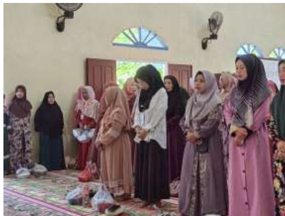
Gambar 2.12 kegiatan isra mi'raj

Turut serta menjadi panitia dalam acara sosialisasi penyakit malaria di Kantor Balai Desa Sidodadi. Mahasiswa PKPM ikut serta dalam pendataan tamu yang hadir sesuai dengan undangan yang di berikan.