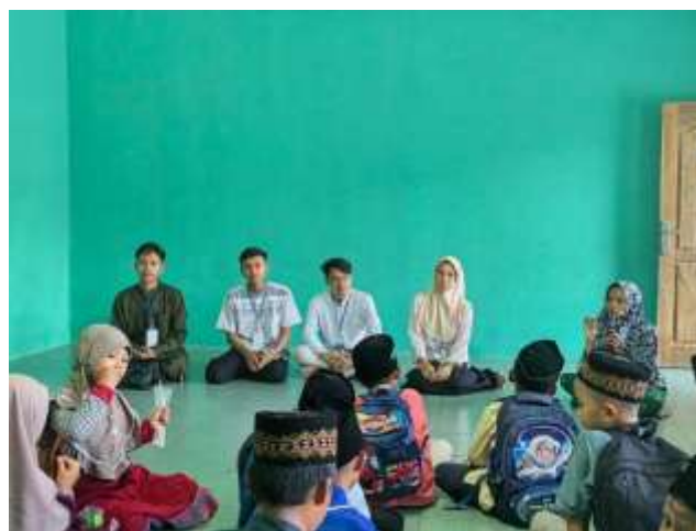
Gambar 2.13 mengajar TPA

Pada kesempatan PKPM kali ini juga, kami mengikuti kegiatan pengajian peringatan hari besar Isra Mi'raj di masjid dusun II dan dusun III desa Sidodadi dalam dua hari berturut-turut.