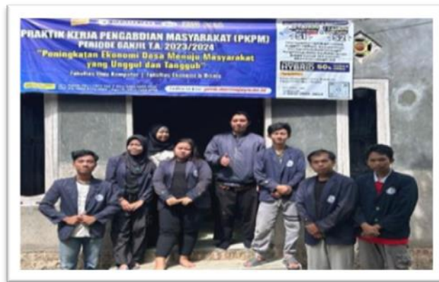
Gambar 2. 15 Kunjungan DPL Ke Lokasi Pkpm

2.4.14 Pemaparan Program Kerja Serta Perpisahan Dengan Aparat Desa