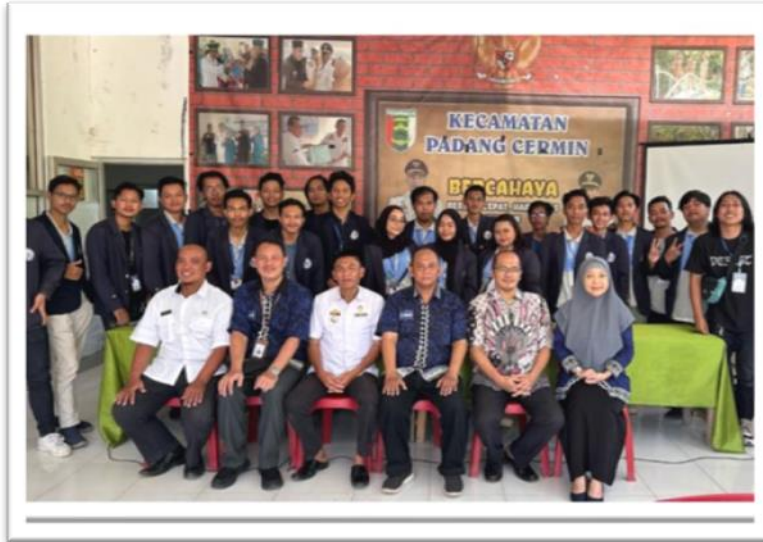
Gambar 2. 17 Penarikan dan Presentasi hasil kerja di kecamatan