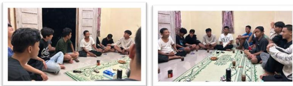
Gambar 2. 7 Kunjungan Pemuda-Pemuda Desa Sanggi Di Posko