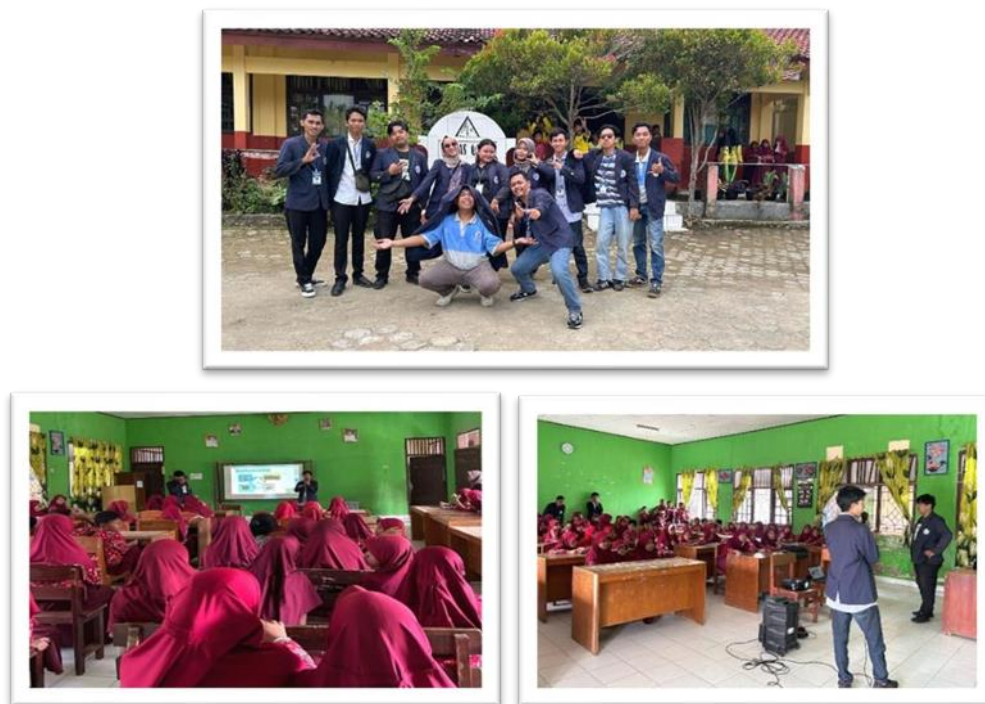
Gambar 2. 13 Sosialisasi Kepada Anak-Anak Sekolah Tentang Komputer Dan Bahaya Internet Guna Mencerdaskan Generasi Muda