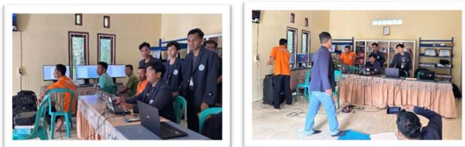
Gambar 2. 10 Pelatihan Ms.Word Yang Diikuti Oleh Aparatur Desa Sanggi