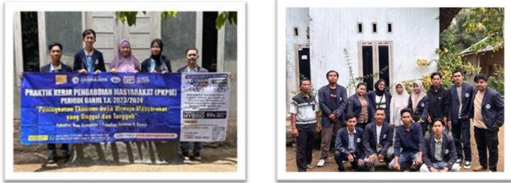
Gambar 2. 4 Kunjungan hari pertama kedatangan mahasiswa pkpm dan ibu dosen pembimbing lapangan ke posko

2.4.1 Kunjungan hari pertama kedatangan mahasiswa pkpm dan ibu dosen pembimbing lapangan ke posko