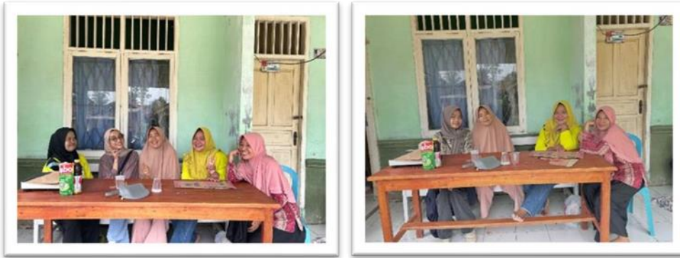
Gambar 2. 14 12 Mengikuti Dan Membantu Posyandu Anak-Anak Dan Ibu Hamil Di Desa Sanggi Piabung

2.4.12 Mengikuti Dan Membantu Posyandu Anak-Anak Dan Ibu Hamil Di Desa Sanggi Piabung Guna Menjaga Kesehatan Dan Juga Mempererat Silaturahmi Antara Mahasiswa Dan Warga Desa.