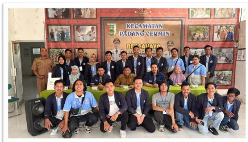
Gambar 2. 3 penyambutan mahasiswa PKPM di kecamatan padang cermin

Keberangkatan dan penyambutan mahasiswa PKPM di kecamatan padang cermin .sekaligus kami melakukan perkenalan kepada aparaturnya kecamatan untuk kami melaksanakan kegiatan pengabdian dari tanggal 5 february – 29 february 2024