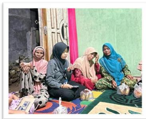
Gambar 2. 5 Mengikuti Pengajian Rutin Ibu-ibu Rt 02 Setiap Senin Malam

2.4.2 Mengikuti Pengajian Rutin Ibu-ibu Rt 02 Setiap Senin Malam