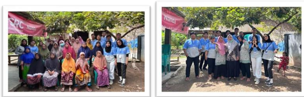
Gambar 2. 6 Mengikuti Dan Membantu Posyandu Lansia Dan Senam Bersama Ibu-Ibu