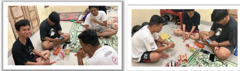
Gambar 2. 12 Membuat Hadiah Kecil Untuk Anak-Anak Saat Menjawab Quiz