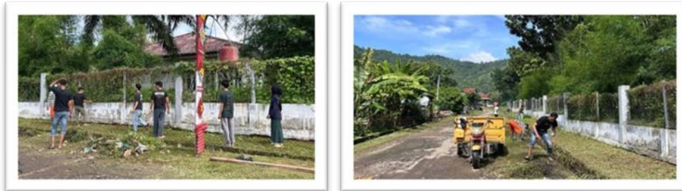
Gambar 2. 9 Gotong Royong Membersihkan Lingkungan Desa Bersama Aparatur Desa