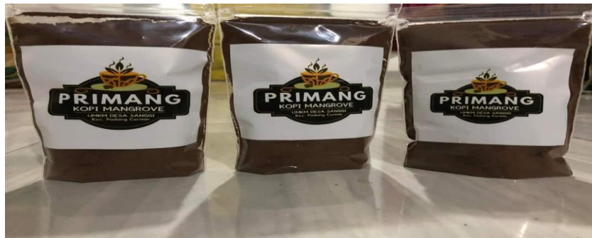
Gambar 2. 2 Produk UMKM MANGROVE