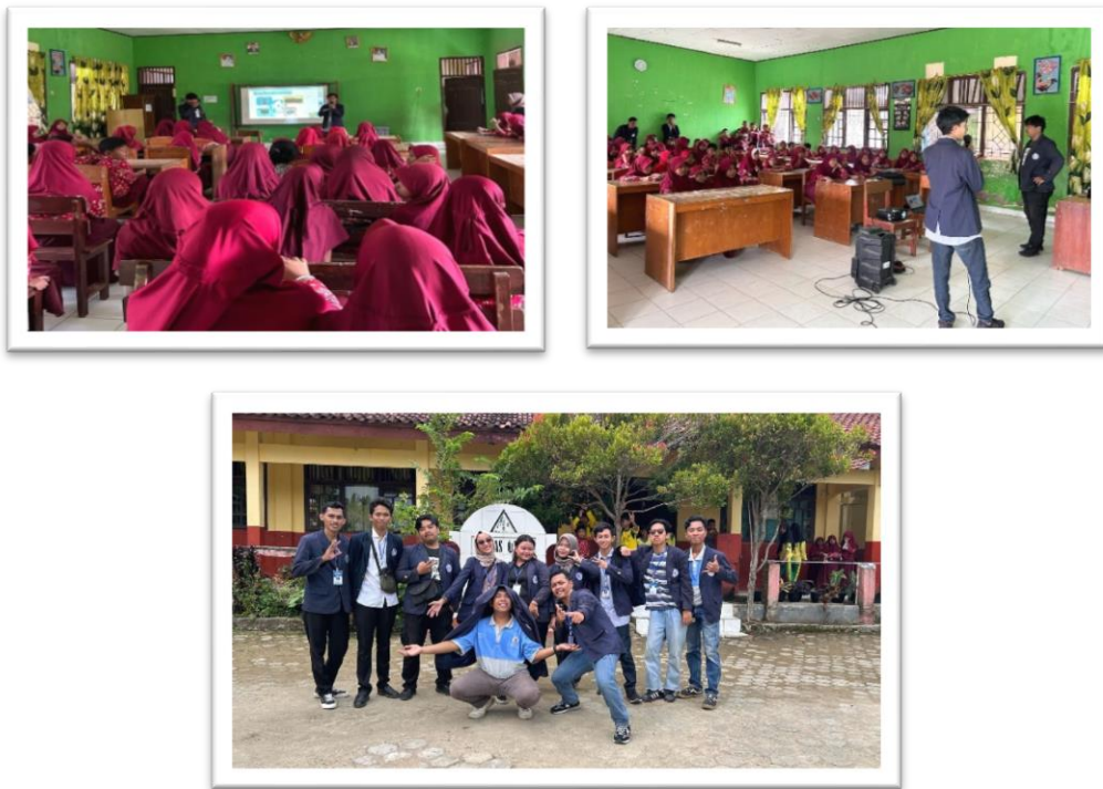
Gambar 2.12 Sosialisasi SD N 14