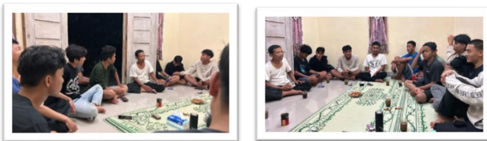
Gambar 2. 6 perkenalan dan kunjungan pemuda-pemuda desa sanggi di posko