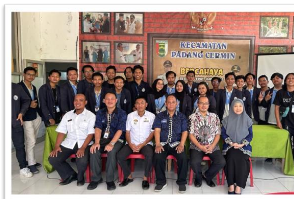
Gambar 2.15 Penarikan dan Presentasi Akhir hasil kerja di kecamatan

15. Penarikan dan Presentasi Akhir hasil kerja di kecamatan