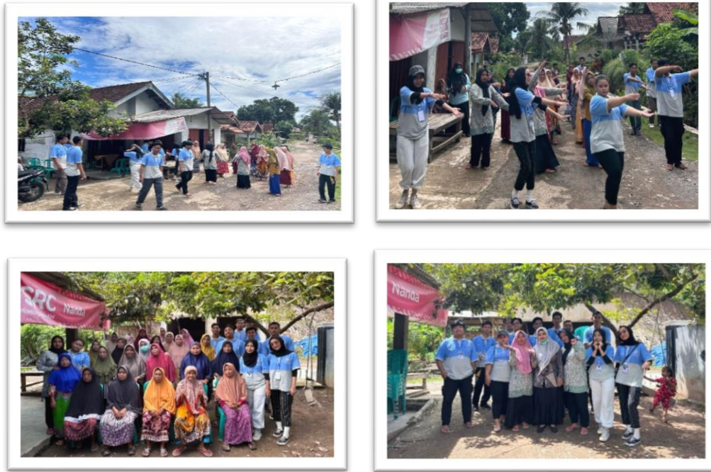
Gambar 2. 5 mengikuti posyandu lansia dan senam bersma ibu-ibu desa sanggi