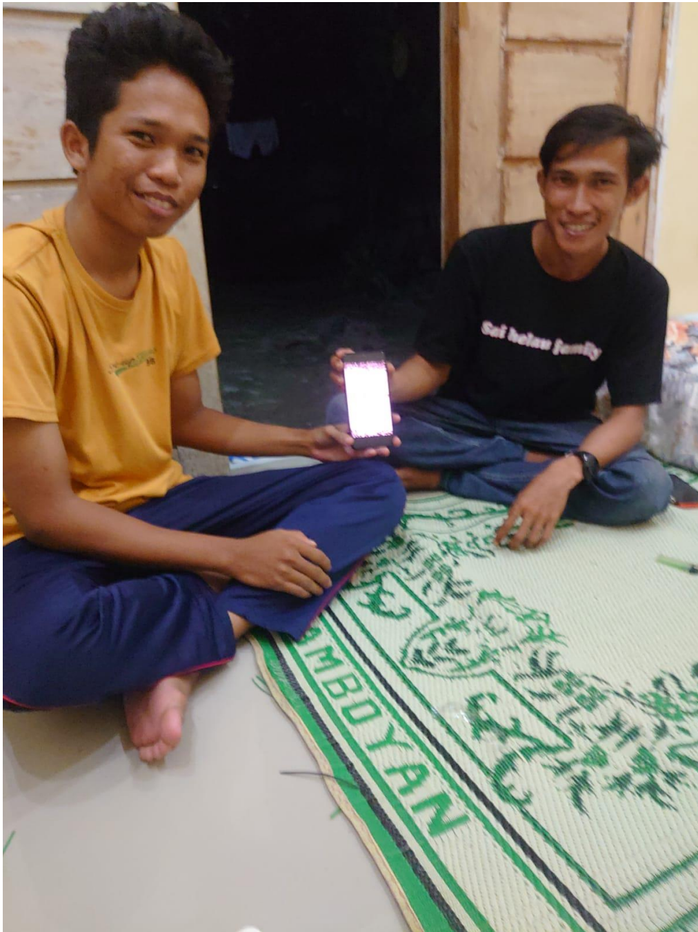
Gambar 2. 2 Penyerahan Design Logo dan Kemasan Kepada Pemilik UMKM