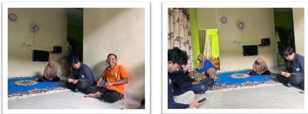
Gambar 2. 10 Silaturahmi Ibu Kades Dan Perkenalan Karang Taruna