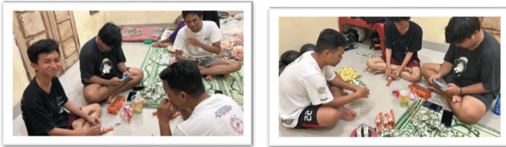
Gambar 2.11 Membuat Hadiah Untuk Sosialisasi Ke SDN 14 Padang Cermin