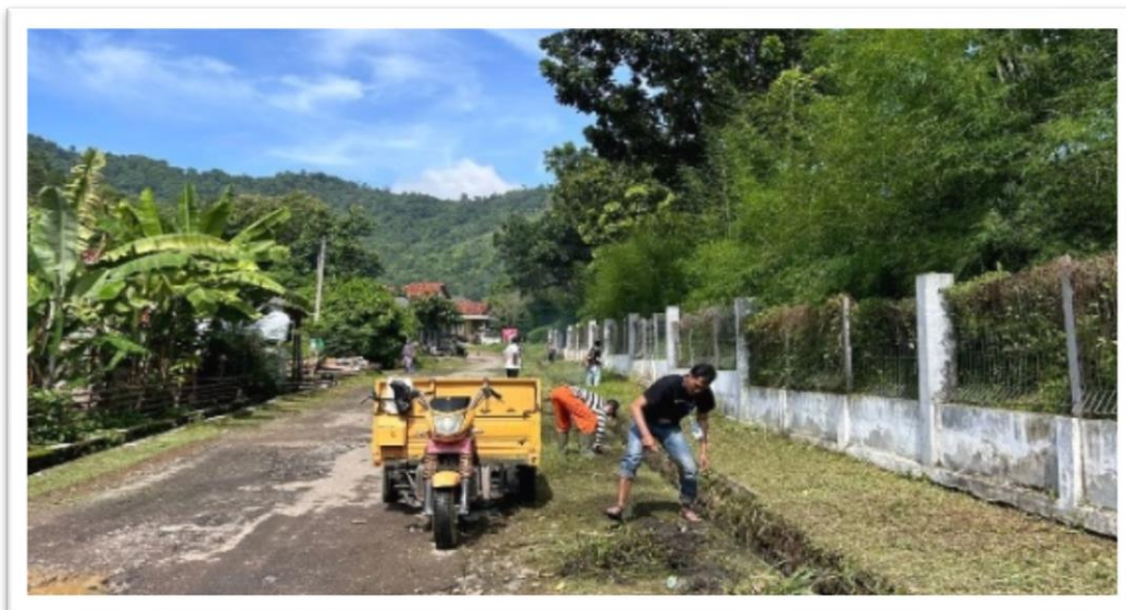
Gambar 2. 8 Kegiatan Gotong Royong