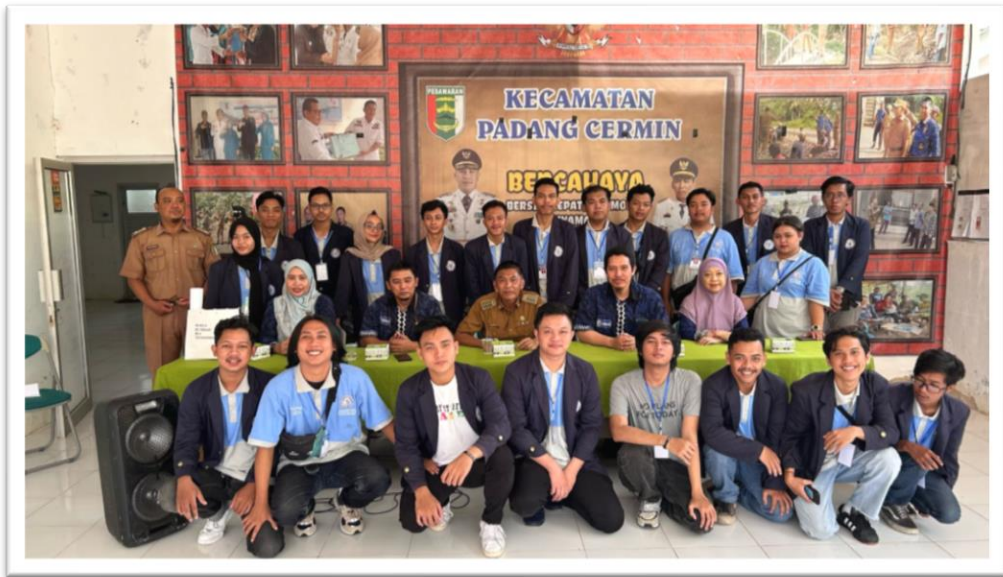
Gambar 2. 3 penyambutan mahasiswa PKPM di kecamatan padang cermin

Keberangkatan dan penyambutan mahasiswa PKPM di kecamatan padang cermin .sekaligus kami melakukan pengenalan kepada aparaturnya kecamatan untuk kami melaksanakan kegiatan pengabdian dari tanggal 5 februari – 29 Februari 2024