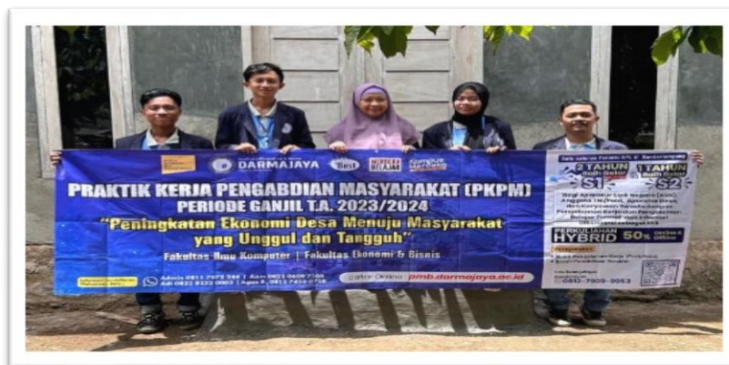
Gambar 2. 4 bersama ibu pembimbing lapangan di posko