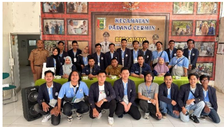
Penerimaan Mahasiswa PKPM di Kecamatan Padang Cermin