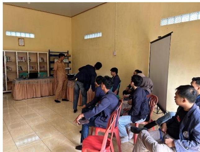
Penerimaan Mahasiswa PKPM di Balai Desa Sanggi