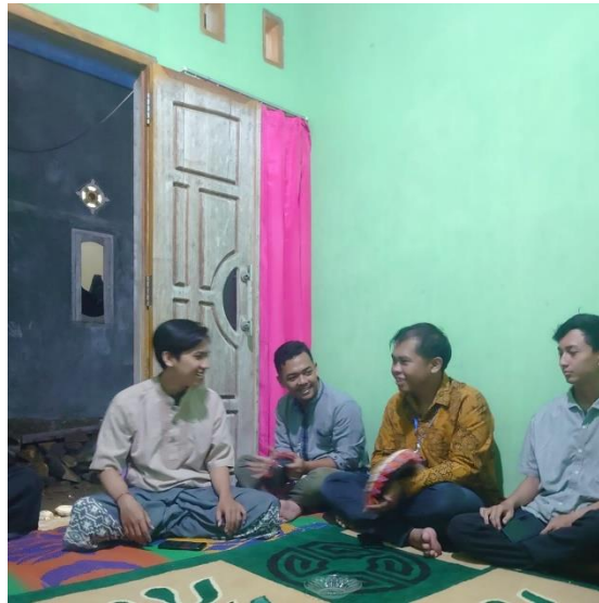
Kegiatan Rebana Dengan Risma Dusun Piabung