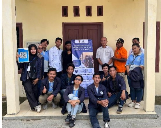
Foto Bersama Dengan Aparatur Dan Penyerahan Design Banner Perpustakaan Serta Scan QR Code Buku Tamu Balai Desa Sanggi Izin Undur diri