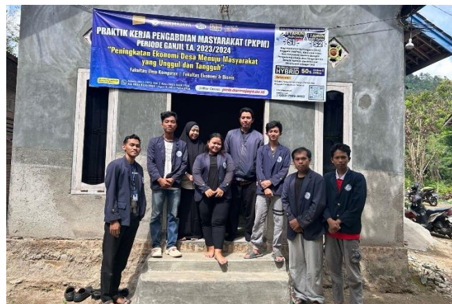
Kunjungan Dosen Pembimbing Lapangan Ke Posko Mahasiswa